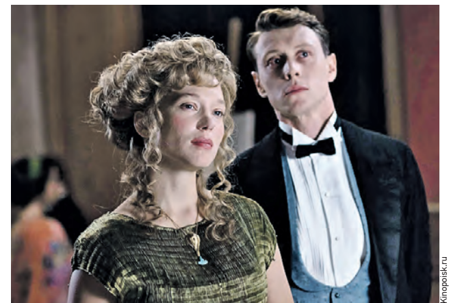
Кадр из фильма «Предчувствие» (2023): актриса Леа Сейду в образе Габриэль и актер Джордж Маккэй в роли Луи

Габриэль собирается пройти процедуру по очистке от эмоций, во время которой вспоминаются прошлые жизни и происходит встреча с Луи.