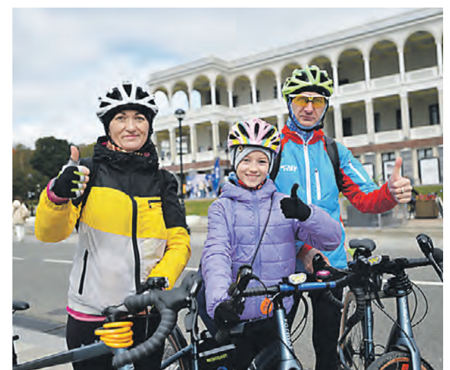
16 сентября 2023 года. Участники велофестиваля на Северном речном вокзале.