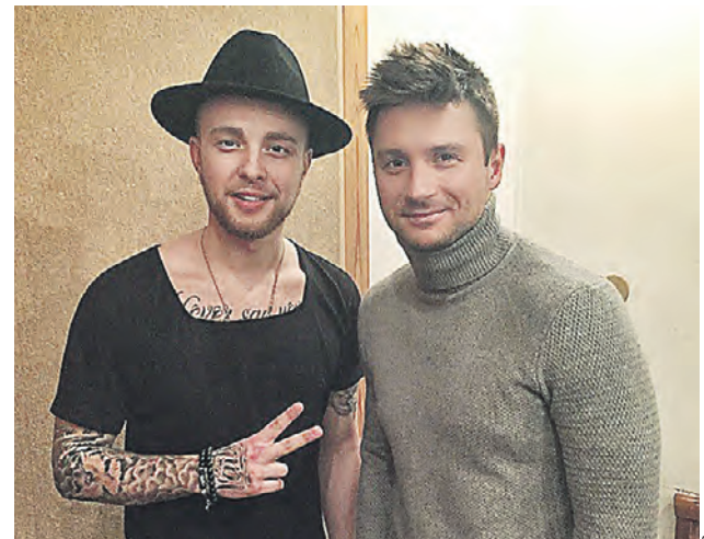
Певцы Егор Крид (слева) и Сергей Лазарев часто пересекаются на светских мероприятиях и концертах