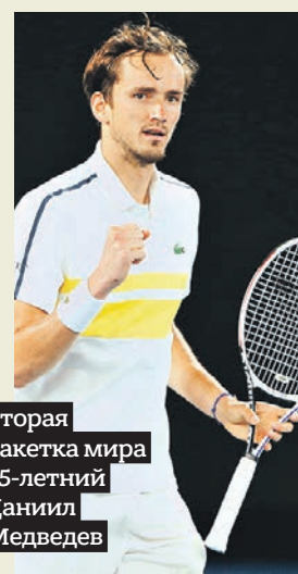
Вторая ракетка мира 25-летний Даниил Медведев

До открытия Олимпиады-2020 в Токио остался один день, а событие уже обросло скандалами и неприятностями. Вчера в сеть утекли личные данные людей, купивших билеты на Олимпиаду. В руках злоумышленников оказались логины и пароли покупателей. Тем временем у наших спортсменов свои проблемы с. 14