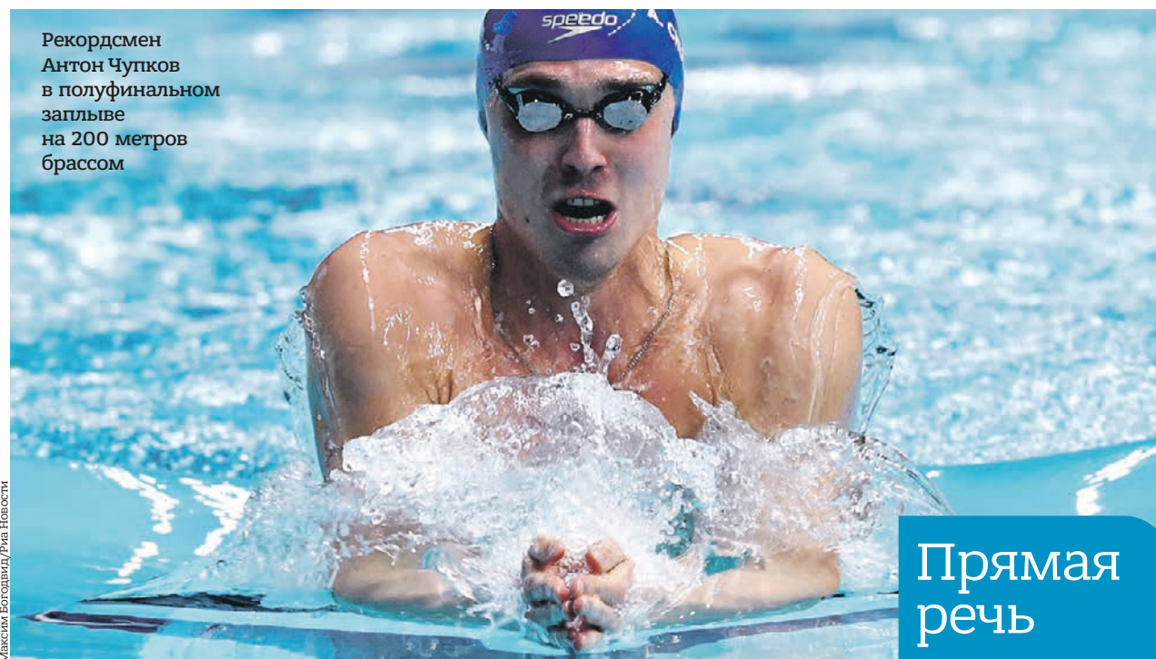
Рекордсмен Антон Чупков в полуфинальном заплыве на 200 метров брассом

Главные олимпийские надежды России на золотые медали Игр в Токио: пловцы Евгений Рылов (двукратный чемпион мира на коронной