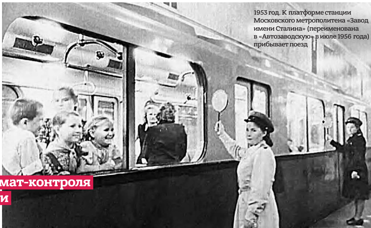
1953 год. К платформе станции Московского метрополитена «Завод имени Сталина» (переименована в «Автозаводскую» в июле 1956 года) прибывает поезд

■ В номере «Вечерки», вышедшем в понедельник, 27 июля 1936 года, жители столицы узнали, как в метрополитене будут бороться с жарой. Конец июля 1936 года выдался жарким. Газета сообщила, что в метрополитене имени Кагановича «утром температура на платформах была 18–19 градусов, в вагонах 24–25 градусов. Намечаются специальные меры для понижения температуры в вагонах». Погоде было посвящено несколько материалов номера. Редакция связалась с Центральным институтом погоды (Гидрометцентр