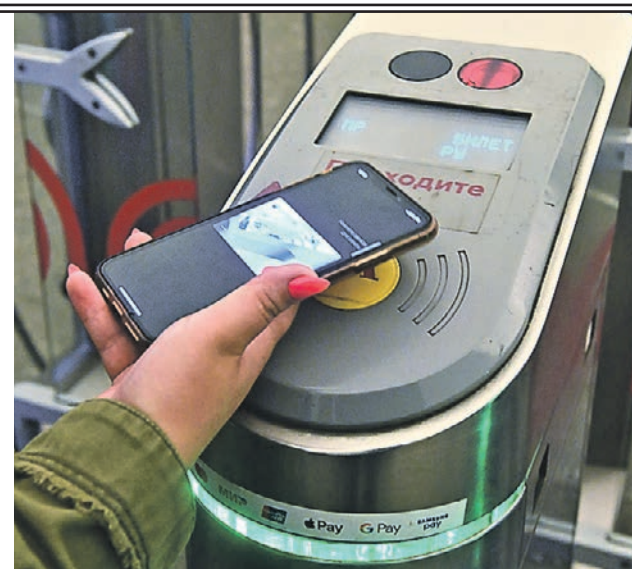
Все больше пассажиров метро выбирают бесконтактный способ оплаты проезда