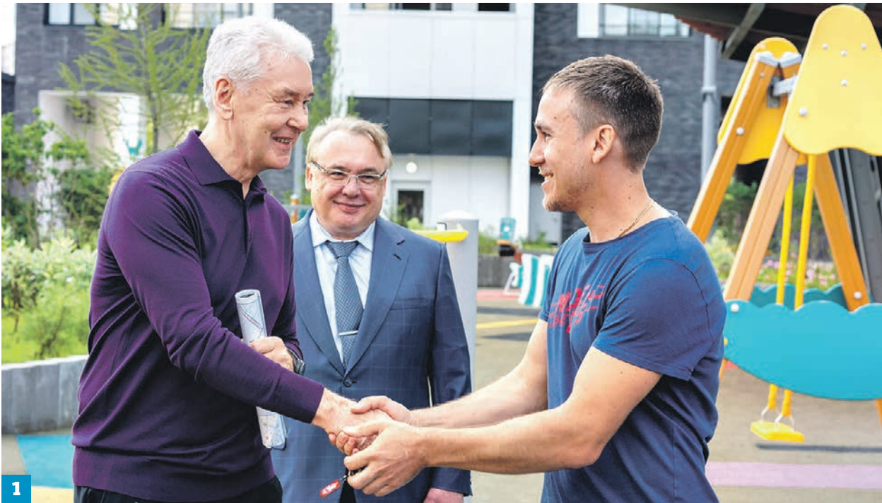
Владимир Новиков/Пресс-служба мэра и Правительства Москвы