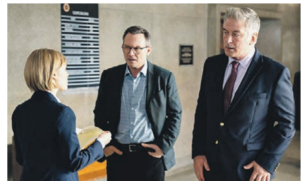
Алек Болдуин (справа) и Кристиан Слейтер в сериале «Плохой доктор»

из череды подобных сериалов. Речь — о состоящем из восьми эпизодов первом сезоне «Плохого доктора». Так называли хирурга-социопата, пациентов которого с какого-то момента будто начало преследовать проклятие. Но дело тут совсем не в мистике,