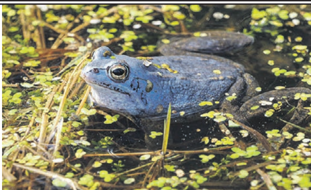
Самец травяной лягушки в период брачных игр

Напомним, что пользователи интернета стали обвинять экологию и ратовать за спасение лягушек в связи с тем, что сравнили природное явление с техногенным случаем, который произо-