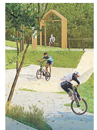
Парк, в котором проложат тропу, станет прекрасным местом отдыха.

— На участке от проезда Дежнева до улицы Молодцова река протекает около жилой застройки районов Отрадное и Южное Медведково, но не везде есть возможность подойти к воде или перейти на другую сторону. Поэтому было принято решение сделать экотропу на сваях, которая будет проходить вдоль всего участка и обеспечит связь между двумя районами, — рассказал заместитель мэра Москвы Петр Бирюков.