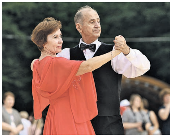
27 июля 2018 года. Участники первого танцевального марафона в «Сокольниках»