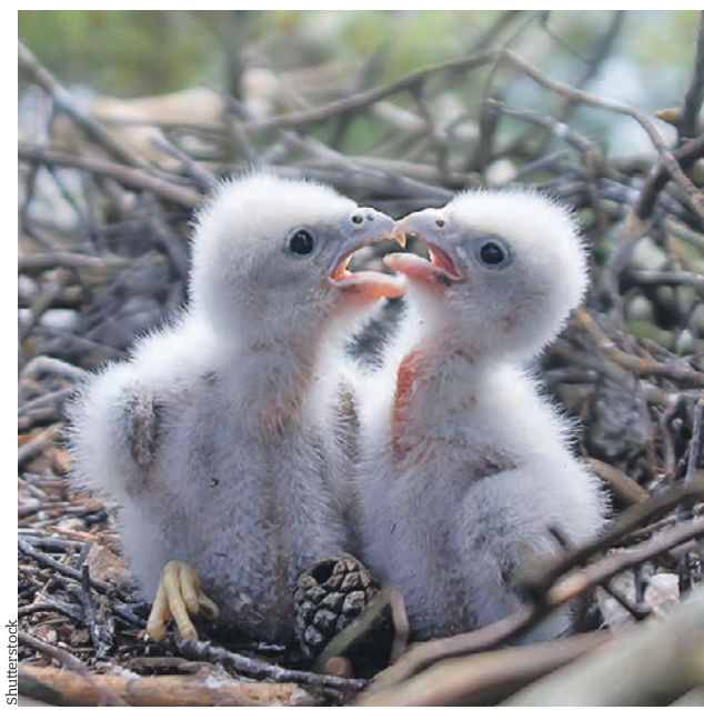
Даже птенцы хищных птиц, например соколята, могут быть опасны для человека