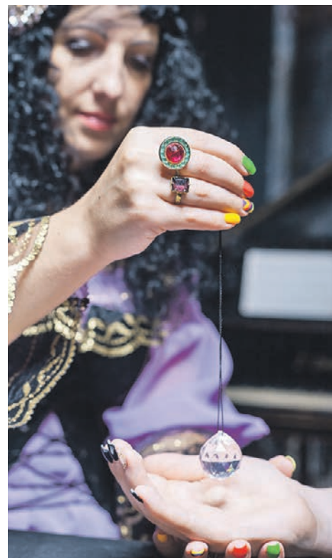
Психолог уверена: цыгане не владеют гипнозом, им многое приписывают