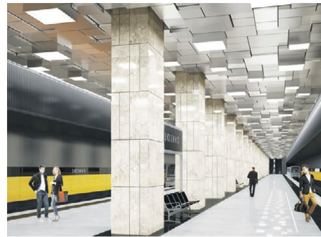
Проект станции «Зюзино» Московского метрополитена

Случайный пассажир Жизнь в метро кипит с раннего утра до глубокой ночи. Запечатлеть один миг, сюжет или случай в подземке мы решили в нашей новой рубрике.