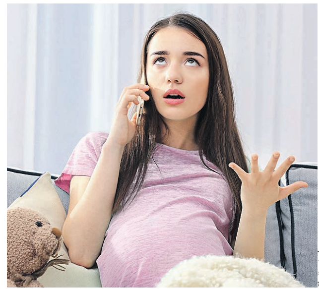
Трудно радоваться будущему материнству, когда раздражает любая мелочь