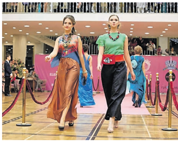
Участницы конкурса «Династия» демонстрируют умения многодетных родителей