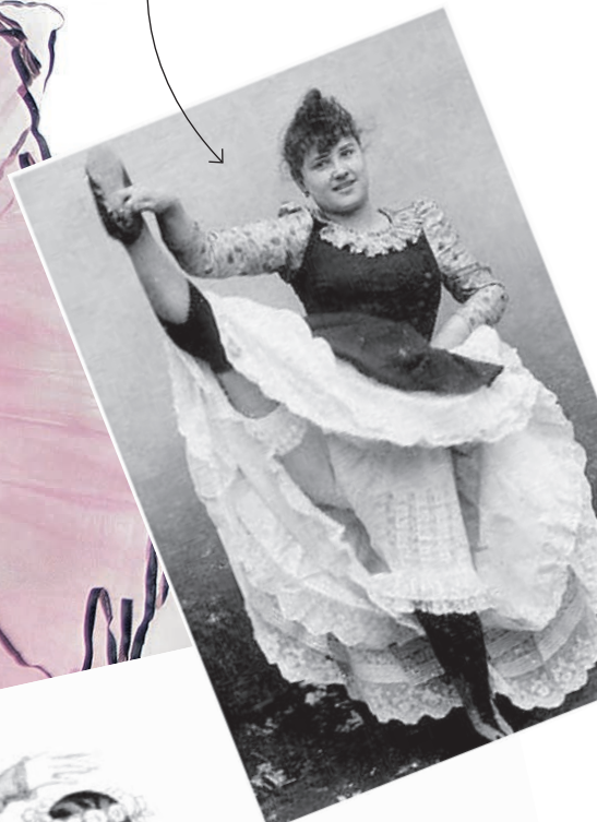
В 1889 году канкан входит в программу профессиональных танцевальных коллективов Парижа.

Любая мало-мальски уважающая себя танцовщица канкана должна подобрать себе альтернативное имя. Например, одной из самых эксцентричных танцовщиц в Париже была Ла Гулю ( обжора — фр. ), а в жизни ее звали Луиза Вебер. Дебютировав в 19 лет, она почти сразу стала яркой звездой салонных танцев.