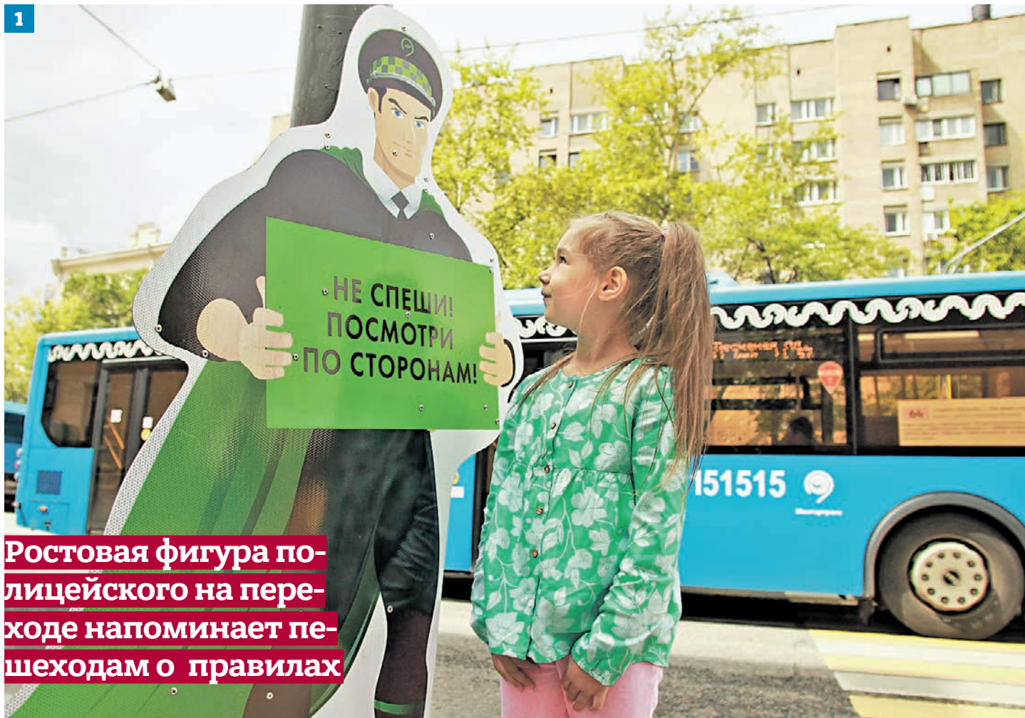
Ростовая фигура полицейского на переходе напоминает пешеходам о правилах

В районе станции «Филатов Луг» заработали две станции городского велопроката и велодорожка. Теперь горожане могут с комфортом на своем или арендованном велосипеде за 10 минут доехать от поселения Московский до станции «Филатов Луг», оставить транспорт на перехватывающей парковке и пересесть на метро. — Это веломаршрут так называемой последней мили протяженностью 2,5 километра. В начале и конце дорожки открылись станции городского проката на 15 и 18 мест, — рассказали в пресс-службе Департамента транспорта и развития дорожно-транспортной инфраструктуры Москвы.