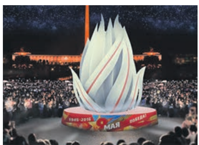
Проект оформления Парка Победы на Поклонной горе. Вечный огонь в виде цветка станет символом праздника

предупреждает, что с 1 по 10 мая Красная площадь будет закрыта для посещения. Впервые в истории празднования Великой Победы будет украшена набережная Москвы-реки. Без оформления не останутся и фасады зданий организаций и предприятий, вокзалов, аэропортов, строительных площадок. В последний день апреля на жилых и административных зданиях будут размещены государственные флаги России и города Москвы. Такое праздничное оформление предусмотрено не только ко Дню Победы, но и к другим праздникам. Например, к Первомаю, Дню герба и флага Москвы. Всего к 8 мая в Москве будет установлено более 330 декоративных конструкций. Перед началом торжества каждый гость получит от организаторов спе-