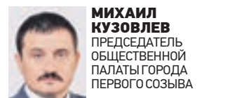
МИХАИЛ КУЗОВЛЕВ ПРЕДСЕДАТЕЛЬ ОБЩЕСТВЕННОЙ ПАЛАТЫ ГОРОДА ПЕРВОГО СОЗЫВА

Сформирован окончательный состав Общественной палаты Москвы второго созыва. Это важное событие для города. В состав палаты вошли самые лучшие и достойные. Всего было три этапа выборов. В результате удалось определить 64 человека. Что интересно, одна треть состава — опытные члены Общественной палаты, которые были в первом созыве, а две трети — новые люди, которые вносят много сил, труда и будут представлять разные мнения жителей. Информация о новом составе палаты появится на сайте Общественной палаты.