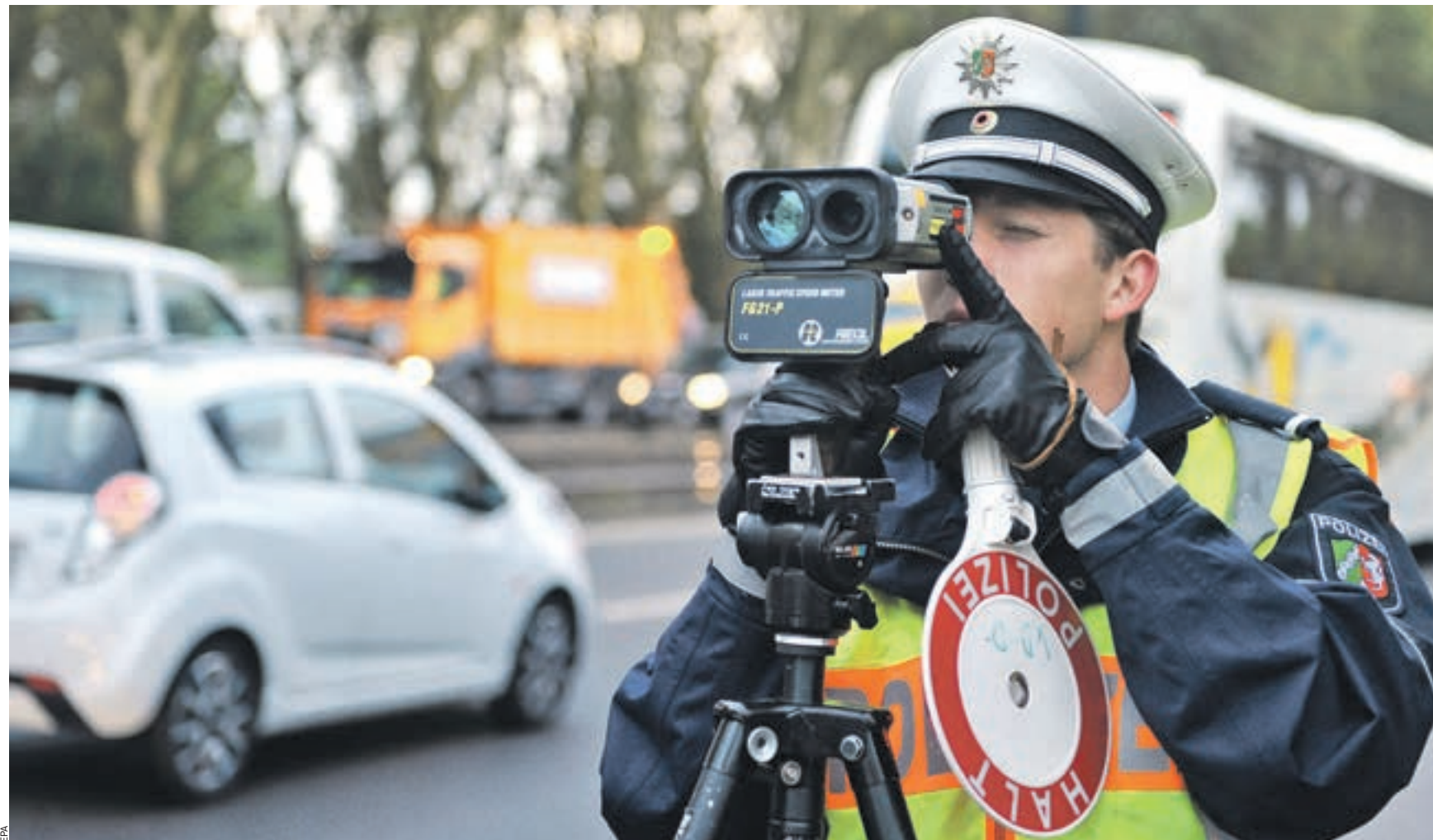
10 сентября 2013 года. Офицер полиции меряет скорость автомобилей лазерным детектором скорости. Обычное антирадарное устройство работу лазерного детектора «не видит». Такую сцену можно наблюдать по всей Германии. Дюссельдорф, Германия

ОПЫТ Практика использования камер фото- и видеofиксации нарушений Правил дорожного движения различна в разных странах. Кто и как должен принимать решение — участники движения или государство?