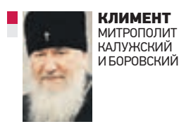
КЛИМЕНТ митрополит калужский и боровский

Первой библейские слова, в которых выражается воля Божия, могут вызвать мысль о присутствии в действиях Господа своего рода «провокации». Так, Бог говорит пророку Моисею: «Я ожесточил сердце фараона», и он не захочет отпустить еврейский народ из Египта. А в ситуации с праведным Иовом Господь словно бы подзадоривает сатану: «Обратил ли ты внимание твое на раба Моего Иова? Ибо нет такого, как он, на земле: человек непорочный, справедливый, богобоязненный и удаляющийся от зла». И тогда диавол начинает действовать против Иова. Надо признать, что никакой «Божественной провокации» не существует, ибо Вседержителю чужды любые страсти, свойственные неуравновешенной человеческой натуре. Библейские строки, в которых мы видим наличие побуждения в действиях Божиих, называются антропоморфизмами. Они приписывают Господу человеческие эмоции, чтобы повествование Священной истории сделать более понятным для людей, живших тысячелетия назад. Это обстоятельство нужно учитывать, поскольку с тех