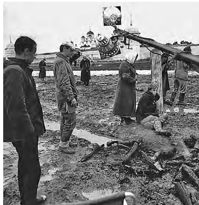
Хроника со съемок «Андрея Рублева»: Андрей Тарковский (второй слева) и Николай Бурляев (сидит справа)