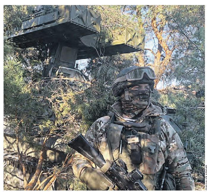
29 апреля. Боец с позывным «Тиран» на фоне ЗРК «Стрела-10»

Боец с позывным «Тиран» из зенитного дивизиона 61-й бригады выполняет боевые задачи на херсонском направлении спецоперации. Он рассказал «ВМ», почему решил отправиться на СВО, а также о работе на зенитно-ракетном комплекте (ЗРК) «Стрела-10».