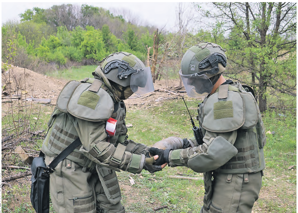
29 апреля. Саперы представительства Международного противоминного центра Министерства обороны России по Луганской Народной Республике проводят гуманитарное разминирование и очистку территорий от неразорвавшихся боеприпасов в ЛНР. Саперы ежедневно выявляют несколько десятков опасных объектов, включая иностранные боеприпасы, в том числе натовские. Все обнаруженные предметы специальным образом уничтожают на полигоне.