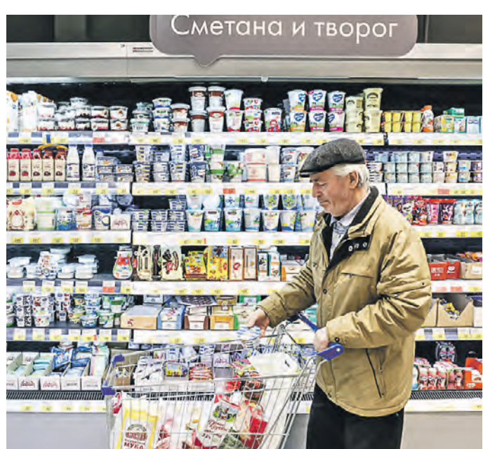
18 марта 2022 года. Покупатель в молочном отделе супермаркета на Дмитровском шоссе

Идея обязать ретейлеров создавать социальные полки с продуктами, у которых истекает срок годности, правильная, но трудно реализуемая. Лучше поощрять продавцов это делать.