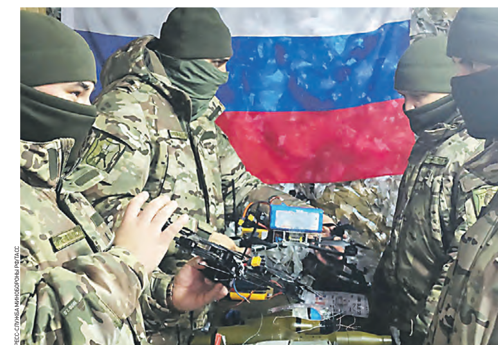
13 февраля. Военнослужащие 132-й отдельной гвардейской мотострелковой бригады 1-го Армейского корпуса Вооруженных сил РФ обучаются управлению FPV-дронами. Подобные беспилотники позволяют эффективно проводить разведку, сохраняя жизни российских солдат. Кроме того, FPV-дроны снабжены камерой и могут нести на себе боеприпас, способный поразить технику противника.