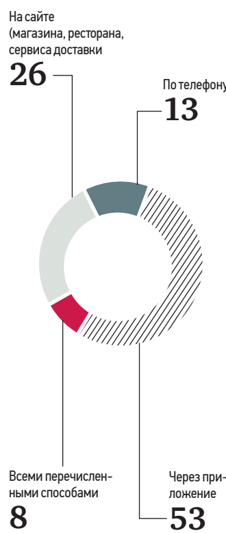
По данным опроса холдинга Romir