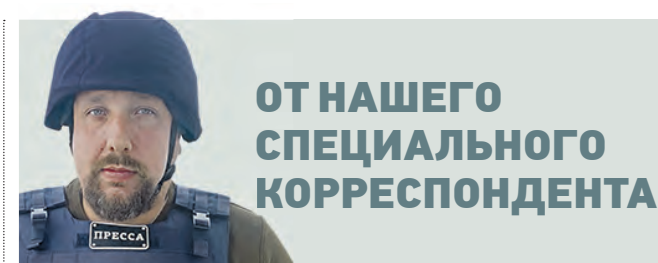
ОТ НАШЕГО СПЕЦИАЛЬНОГО КОРРЕСПОНДЕНТА

Здоровый выбор. Россияне стали чаще покупать мясо и фрукты, снизили потребление мучного и «быстрых» углеводов → СТР. 6