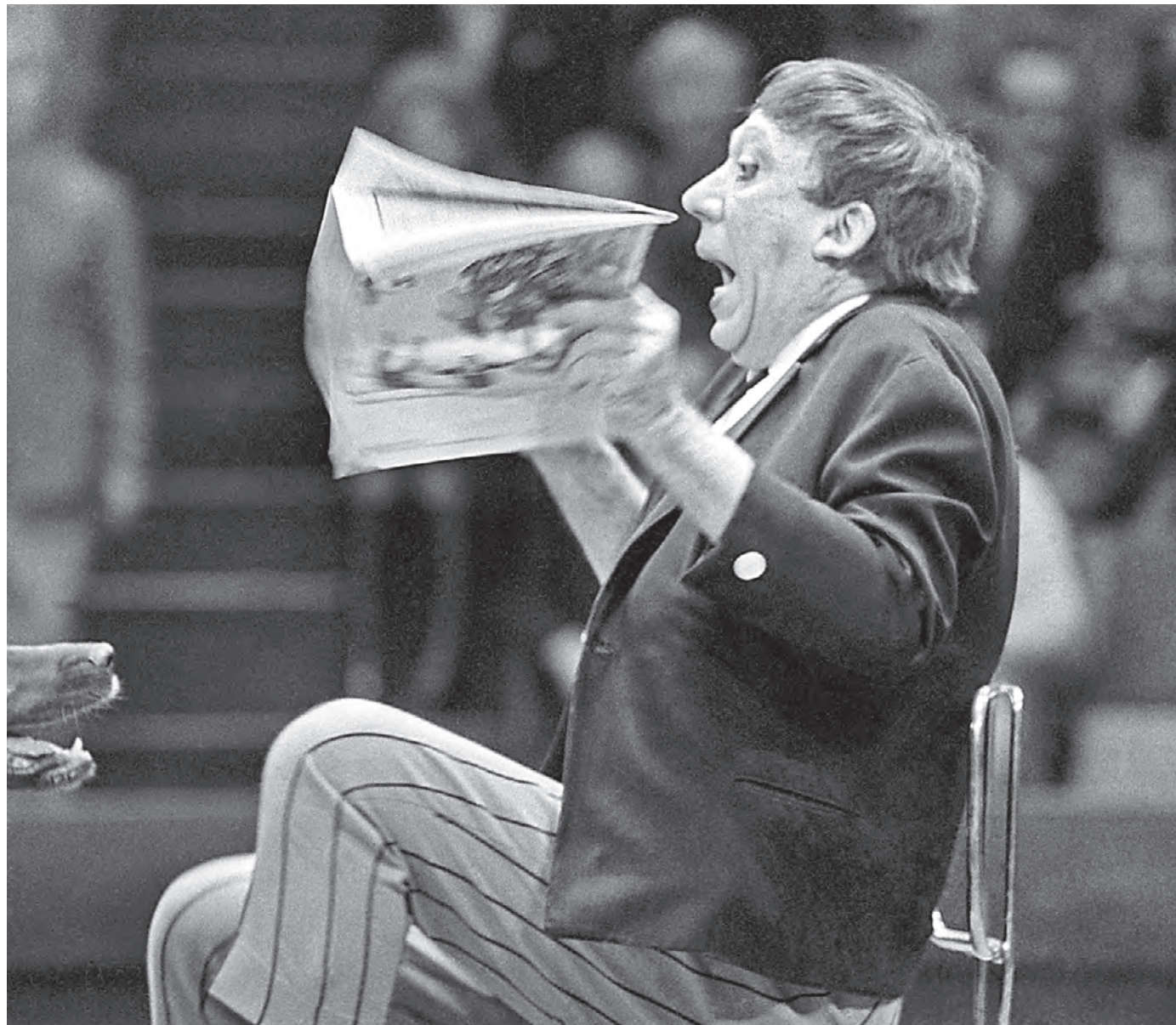
10 октября 1977 года. Народный артист СССР Юрий Владимирович Никулин на сцене Цирка на Цветном бульваре с газетой в руках. Пройдет немного времени, и он добьется издания газеты «Советский цирк», печатавшей острейшую публицистику и поэзию