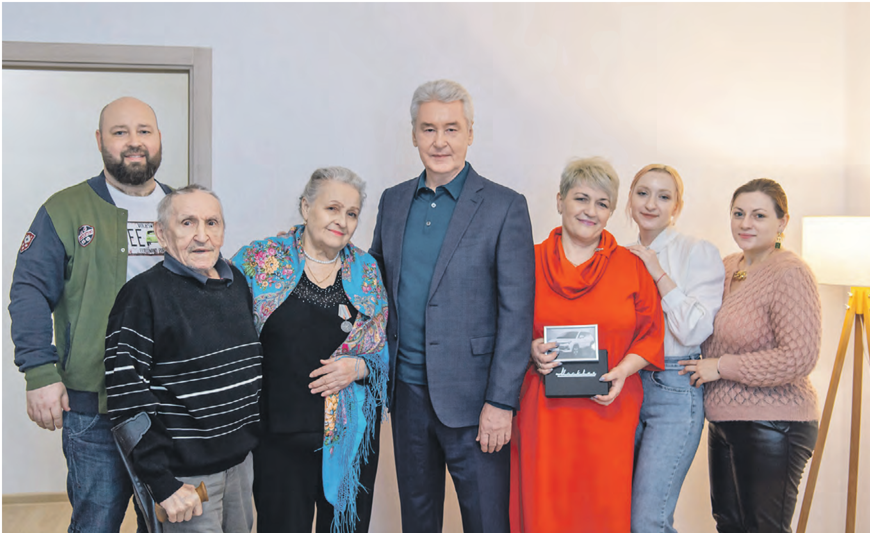
10 января. Мэр Москвы Сергей Собянин (в центре) встретился с новоселами дома, который ввели по программе реновации в столичном районе Гольяново. С каждым годом количество новостроек увеличивается, а значит, все больше москвичей улучшают свои жилищные условия

Улучшить операционные На страницах своего персонального сайта Сергей Собянин рассказал о развитии хирургической службы города. — Особое внимание уделяем переоснащению хирургиче-