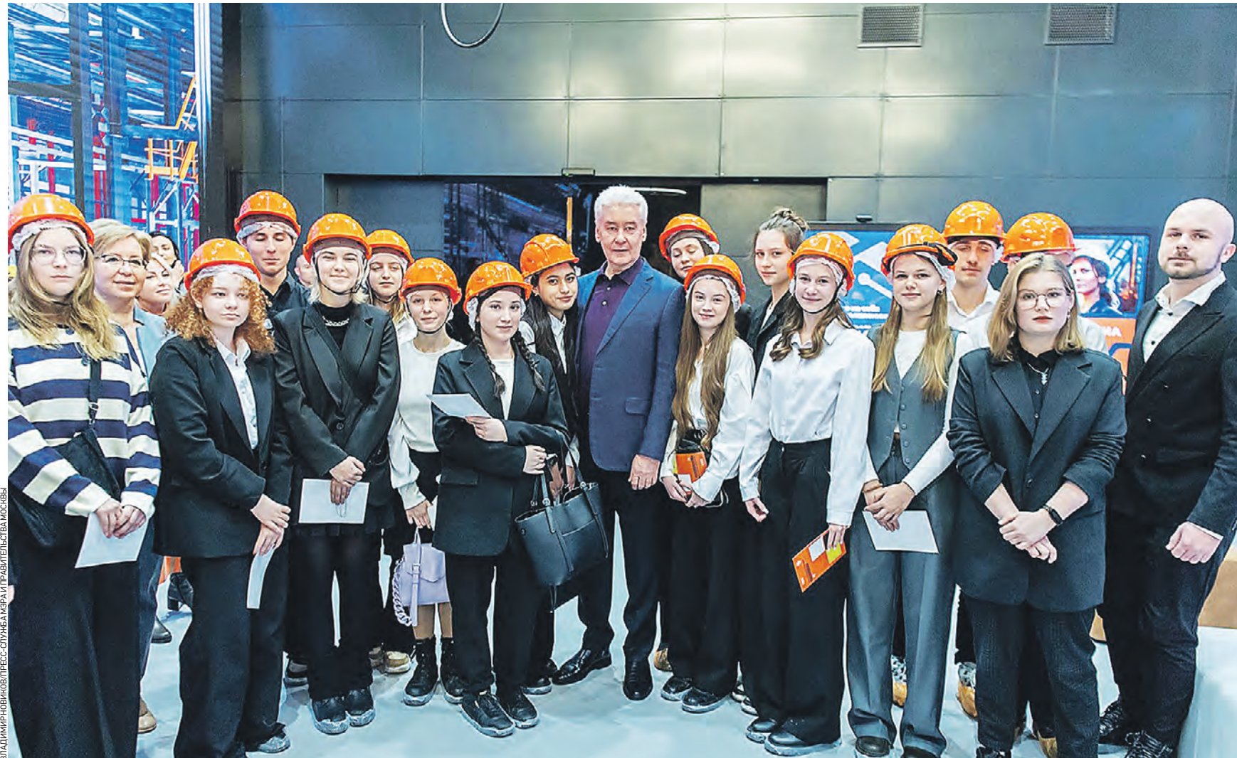
26 декабря. Мэр Москвы Сергей Собянин (в центре) пообщался с посетителями центра «Профессии будущего». Взрослым здесь помогут найти работу, школьникам — определиться с выбором будущей специальности. Кадровый центр сотрудничает с предприятиями города и столичными колледжами

Соискатели могут выбрать одну из 75 востребованных профессий в различных отраслях экономики. Образовательные программы длятся до 3,5 месяца. Часть из них доступна дистанционно. При этом рабочим специальностям обучают на производственных площадках предприятий города.