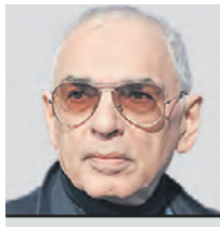
КАРЕН ШАХНАЗАРОВ РЕЖИССЕР, ГЕНЕРАЛЬНЫЙ ДИРЕКТОР КИНОКОНЦЕРНА «МОСФИЛЬМ»

Больших успехов наш концерн достиг на международном видеоэкстиве, куда выкладываются работы «Мосфильма». Мы были первыми, кто сделал доступ к своему кино бесплатным. Согласно статистике, к концу 2023 года наша студия с результатом в 3,4 миллиарда просмотров на этой платформе занимает четвертое место, уступая лишь ведущим мировым лидерам индустрии. При этом количество картин на канале у нас в два раза меньше, чем у ведущих рейтинга. Немаловажно, что 16 процентов из числа зрителей наших работ составляют жители Украины. Мы делаем субтитры для советских и российских фильмов на английском, испанском и арабском языках. На наше кино есть спрос у иностранного зрителя.