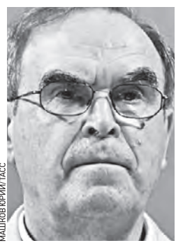
НАИЛОВА БРИГАДА ТАСС

2 марта 1938 — 30 апреля 2023 Легендарный модельер и дизайнер, первый известный модельер в нашей стране, живописец и график. У Вячеслава Михайловича было множество наград и званий, его знала вся страна — и как создателя образов звезд, и как телеведущего. Добросовестный трудоголик с честью носил присвоенное народом звание главного модельера Советского Союза.