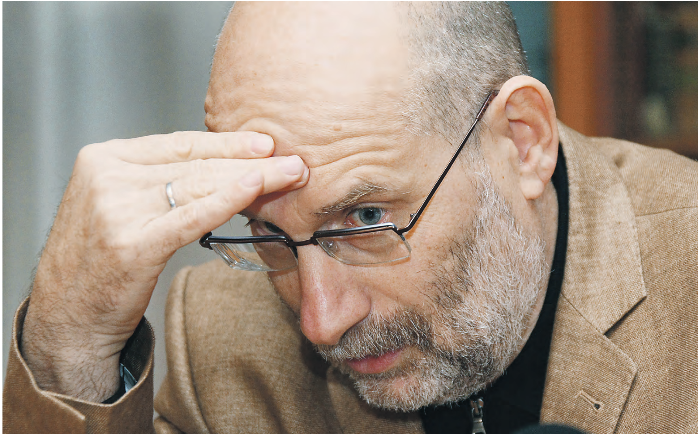
24 октября 2008 года. Борис Акунин на пресс-конференции в Москве. На днях писателю-экстремисту пришлось снова хвататься за голову: вскоре изрядно обмелеет поток финансов, получаемых из нелюбимой им России

Нужны ли нам произведения людей, которые предали свою страну