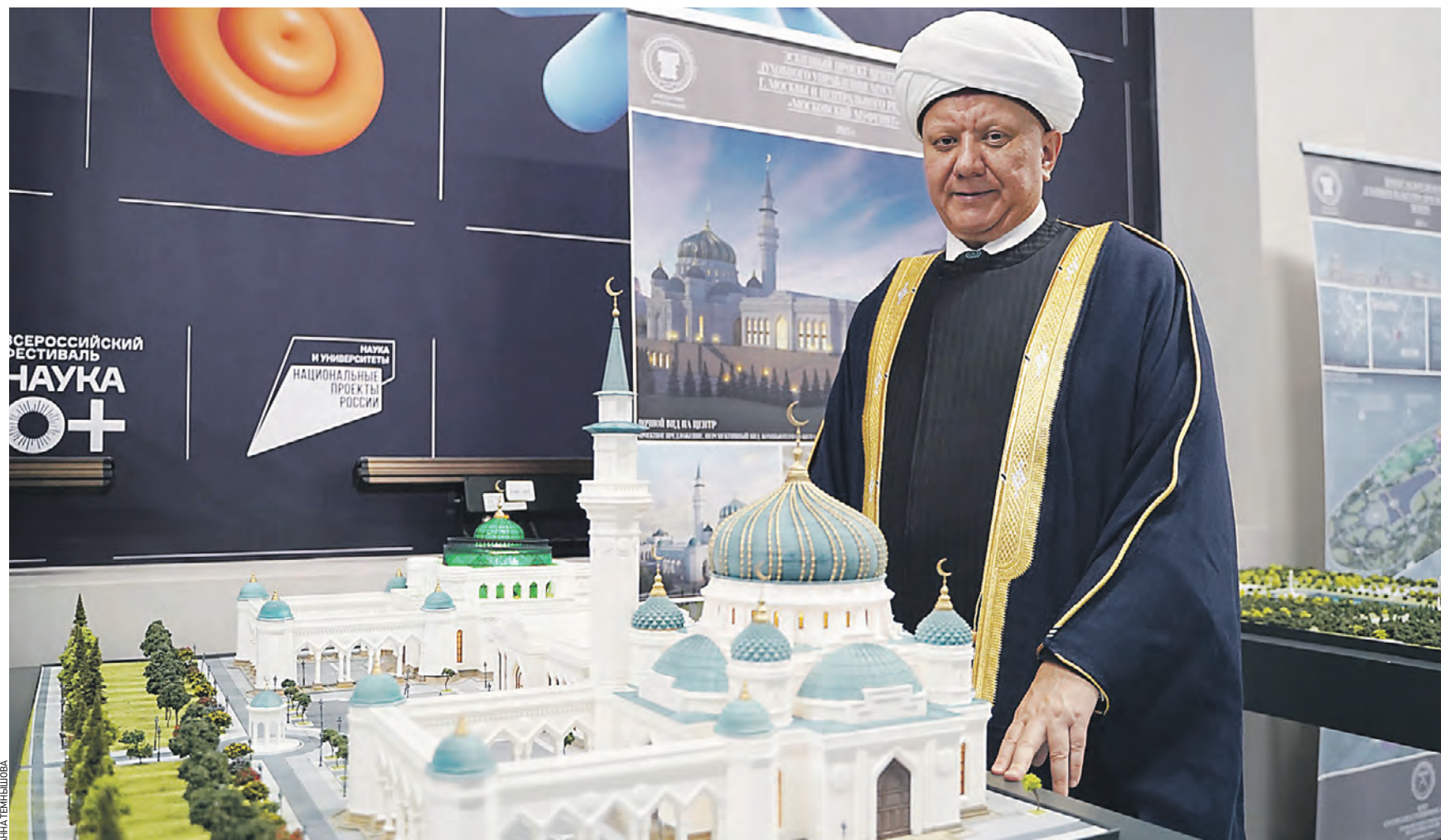
26 декабря. Глава Духовного собрания мусульман России Альбир Крганов рассматривает макет мечети, который представили в рамках проекта «Межрелигиозный духовный культурно-просветительский центр в районе Коммунарка Новой Москвы»