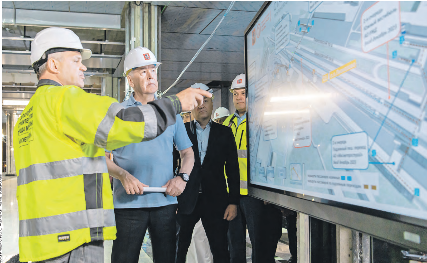
27 июня. Мэр Москвы Сергей Собянин (в центре) и генеральный директор компании-подрядчика Сергей Жуков осматривают ход строительства станции «Лианозово» Люблинско-Дмитровской линии метро. Эта и еще две станции — «Яхромская» и «Физтех» — будут запущены нынешней осенью