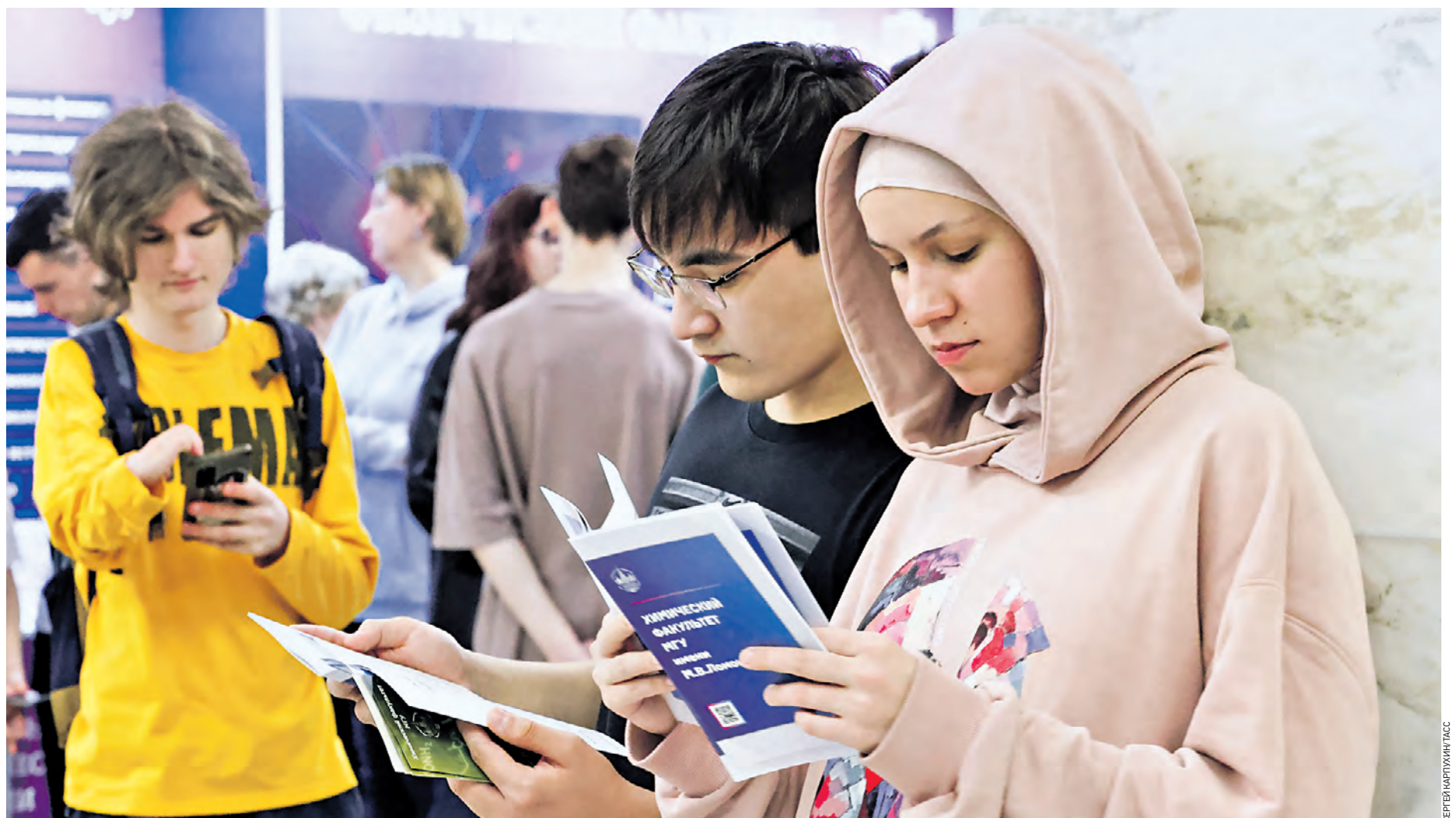
26 марта 2023 года. Посетители собрались на Дне открытых дверей, который проводился в главном здании Московского государственного университета. Каждый год будущие студенты удивляют тех, кто станет их обучать, при этом далеко не всегда приятно

Oleg Проблема проста: многие родители хотят, чтобы их дети «нем-то стали». Поэтому их накручивают какими-то своими ожиданиями и надеждами. Отсюда бесконечный стресс. Лично мне кажется, что ребенок должен оставаться собой и делать то, что ему по жизни нравится, лишь бы не губил здоровье и не нарушал закон.