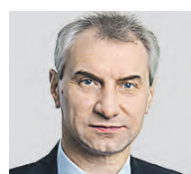
ОЛЕГ СКВОРЦОВ ПРЕДСЕДАТЕЛЬ ПРАВЛЕНИЯ АССОЦИАЦИИ РОССИЙСКИХ БАНКОВ

Одно из самых тяжелых чувств человека — это чувство долга. Мы всю жизнь кому-то должны. И часто так бывает, что различные ссуды или кредиты становятся последней каплей, и стресс по этому поводу приводит к нервным срывам. Долг — это сознательное взятие на себя дополнительной тяжести, особенно учитывая, что банкам деньги возвращаются с процентами. Если у человека есть обязательство, он теряет чувство свободы и даже счастья, попадая в состояние зависимости и угнетения. Психологическое давление долга бывает настолько велико, что иногда даже нужна помощь соответствующего специалиста. Если же речь идет о займе у друзей, то велика вероятность эти взаимоотношения испортить.