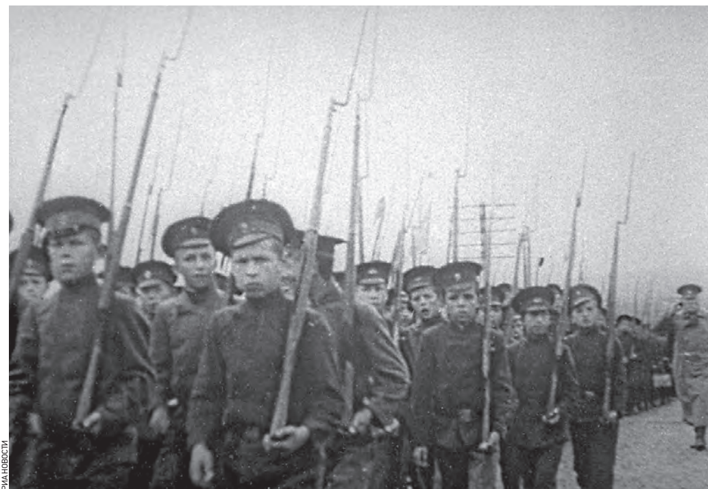
1914 год. Кадр кинохроники «Потешные полки (классы)» царской армии, состоящие из учащихся средних школ

дата 1 августа 1914 года началась Первая мировая война. С 2013 года в России отмечается День памяти российских воинов, погибших в Первой мировой войне.