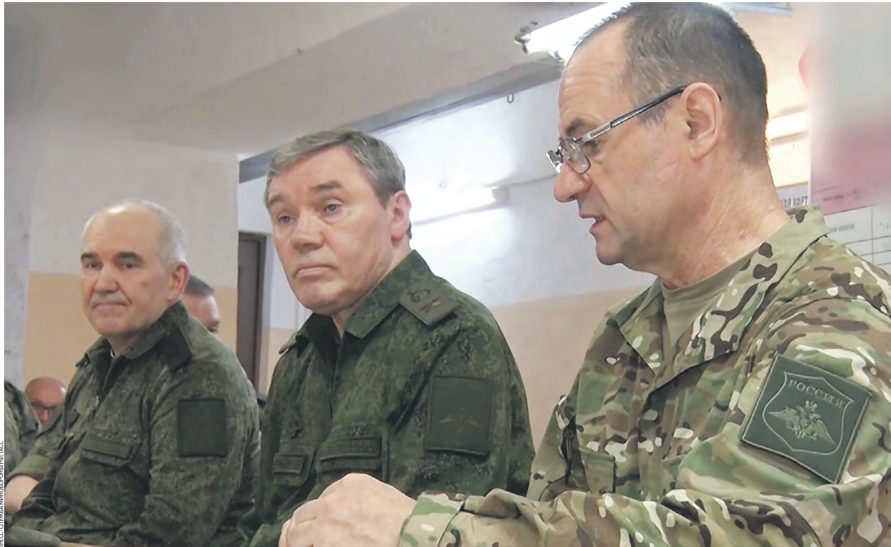
Вчера 10:16 Начальник Генерального штаба Вооруженных сил России Валерий Герасимов (в центре) во время проверки передового пункта управления группировки «Восток» в зоне проведения спецоперации