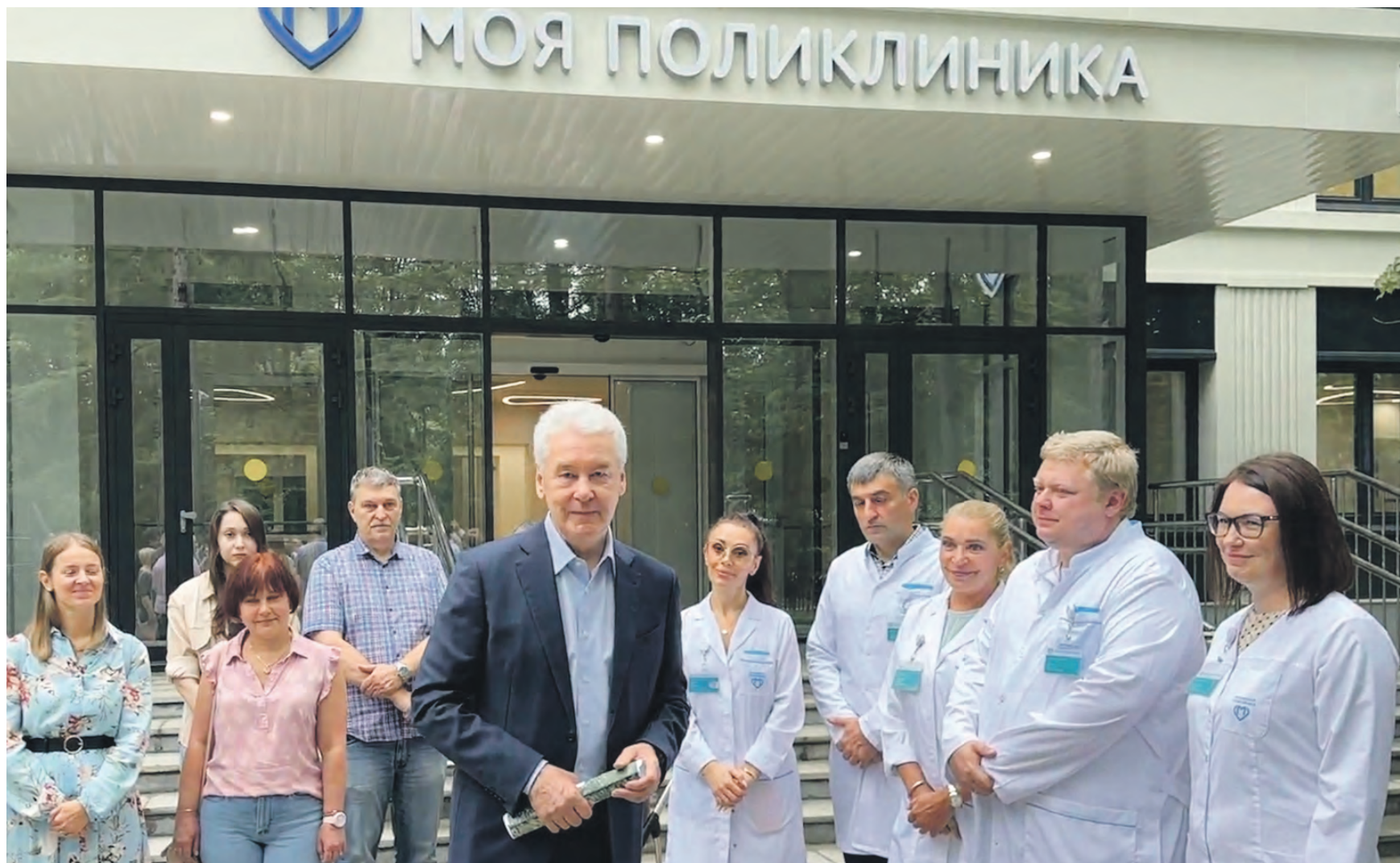
Вчера 11:37 Мэр Москвы Сергей Собянин (в центре) пообщался с медиками филиала № 4 городской поликлиники № 6 и жителями Тимирязевского района, которые ждут открытия медучреждения после реконструкции. По словам главврача поликлиники № 6 Инги Кокаревой (третья справа), первых пациентов здесь примут 7 августа

Полное обновление Три года назад по просьбе врачей и москвичей власти города запустили масштабную программу модернизации ам-