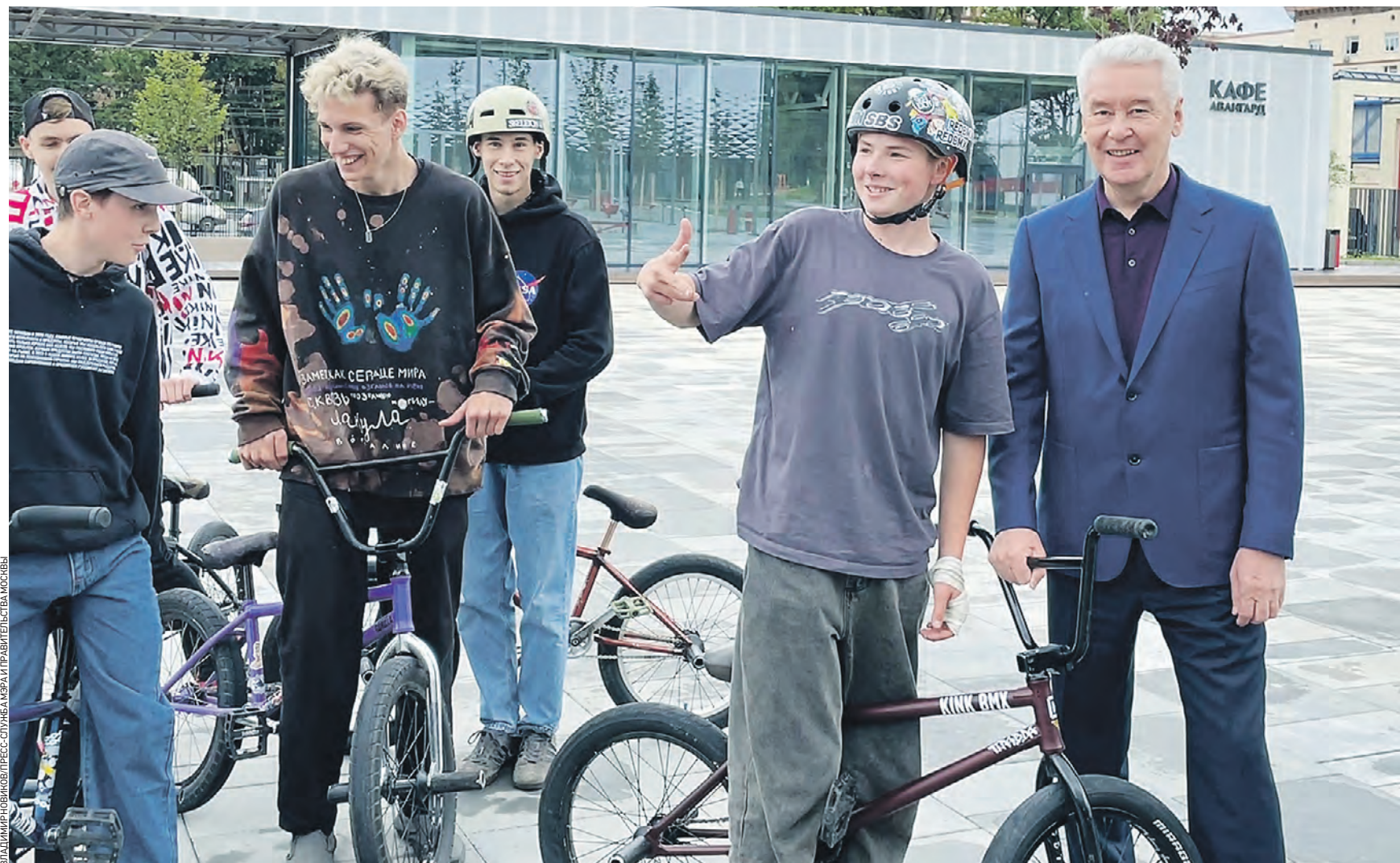
Вчера 13:05 Мэр Москвы Сергей Собянин (справа) фотографируется с молодыми спортсменами во время осмотра результатов реконструкции стадиона «Авангард» в районе Перово — здесь сделали шесть площадок для занятий разными видами спорта

— Стадион теперь — это масштабный спорткомплекс, — подчеркнул глава города. Там появились шесть площадок для занятий разными видами спорта, футбольное поле с искусственным газоном и системой подогрева, фитнес-зона со специальными тренажерами для старшего поколения, площадка для игры в петанк, шахматными