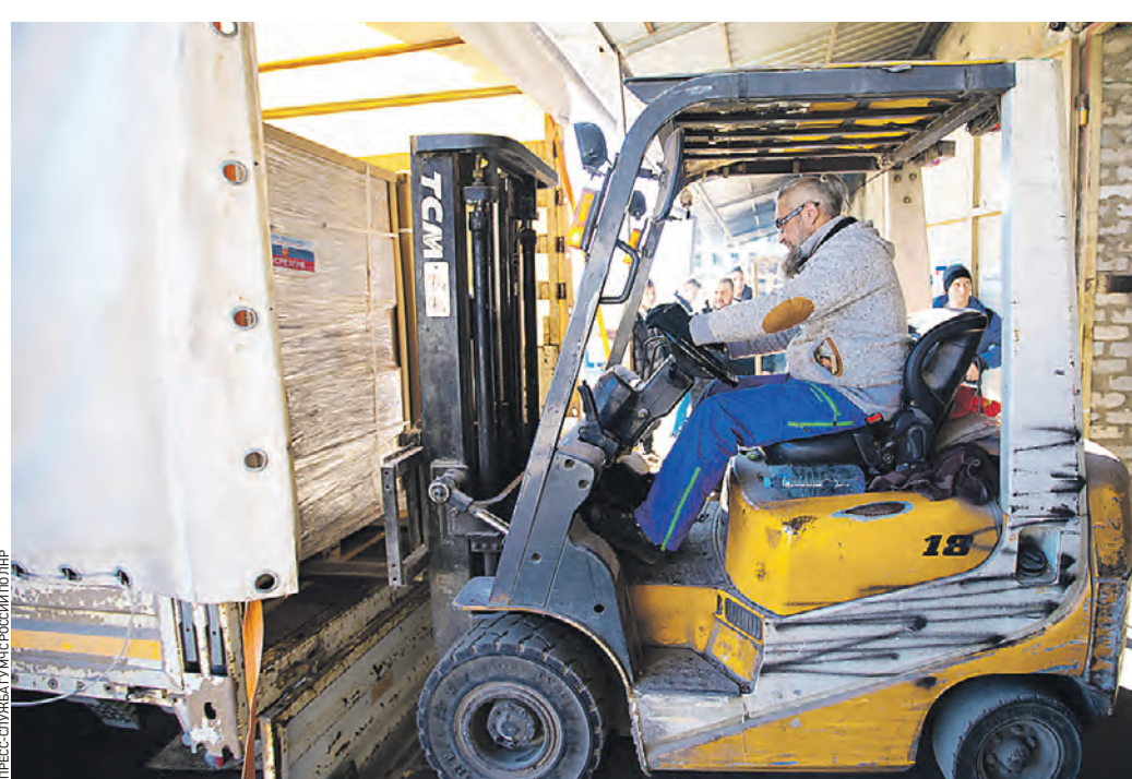
6 июля 2023 года. Спасатели ГУ МЧС по ЛНР грузят тонны гуманитарной помощи для жителей Донбасса

С первых дней спецоперации участники общественной акции #МыВместе поддерживали мирных жителей Донбасса, помогали вынужденным переселенцам и российским военным. На освобожденных территориях добровольцы организовали более 200 гуманитарных миссий. Оказали поддержку более 700 тысячам жителей новых регионов.