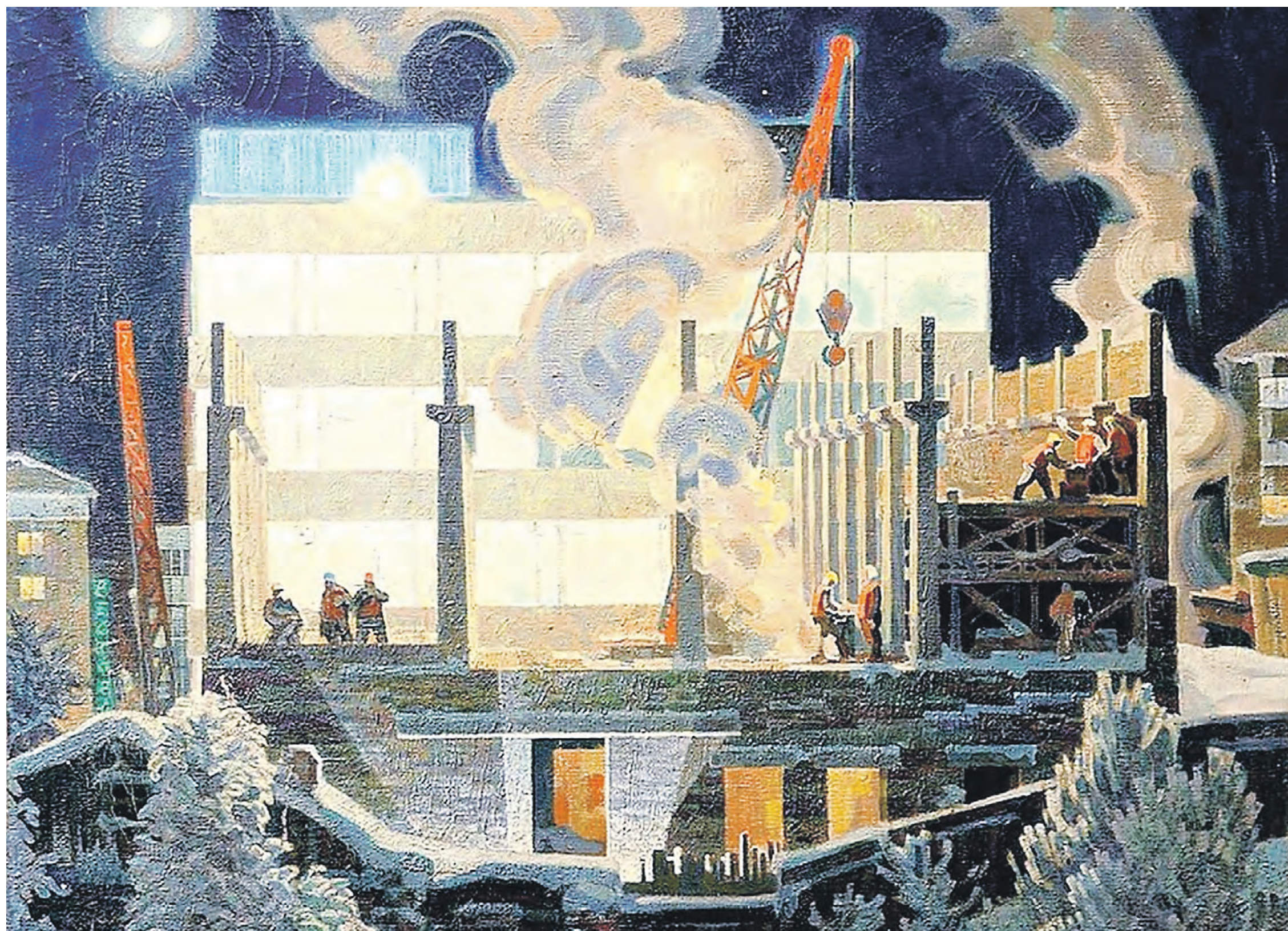
Картина «Стройка в декабре», написанная художником Александром Николаевичем Безумовым в 1978–1979 годах

Вернутся ли на экраны, страницы книг и в живопись простые люди труда