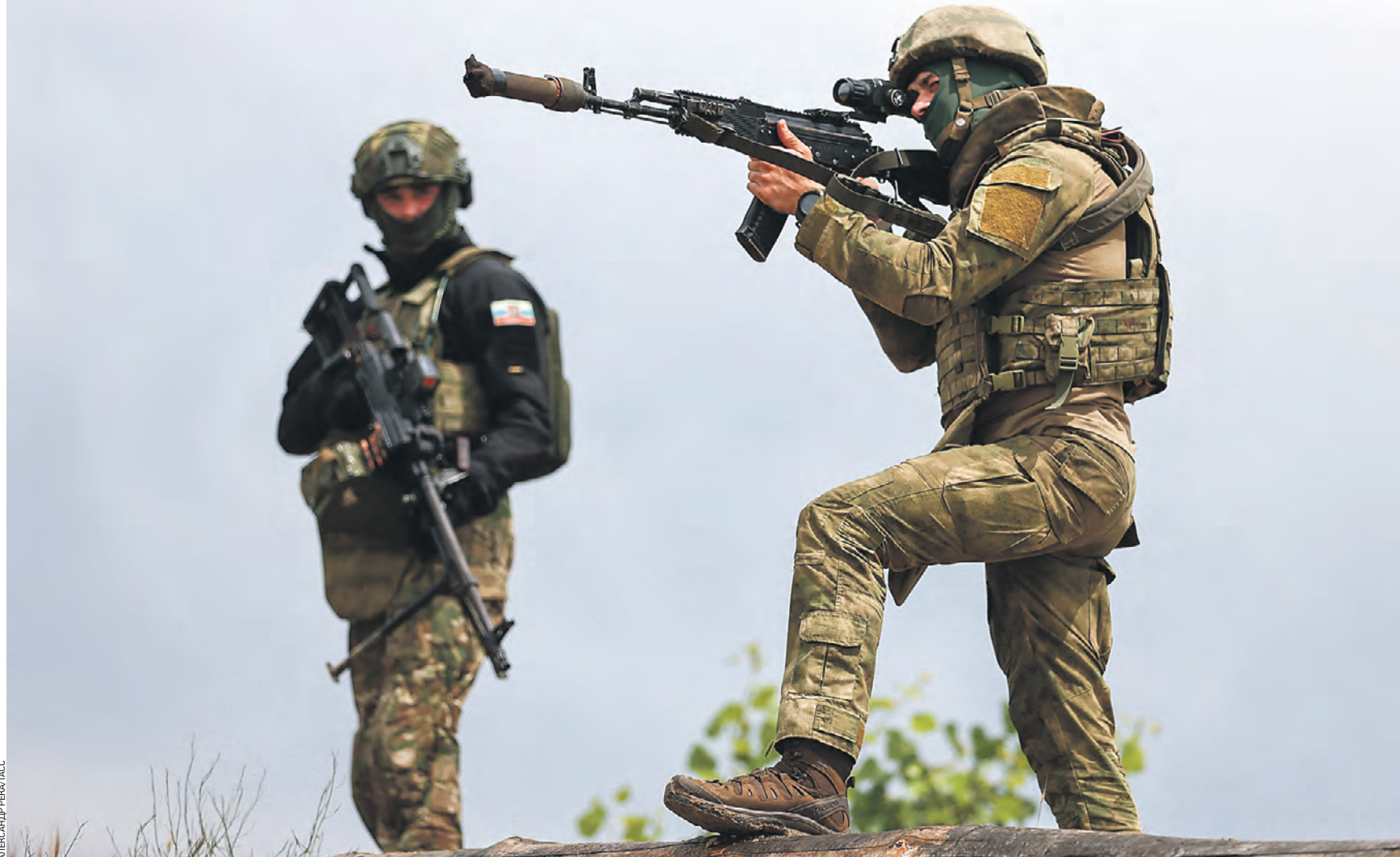
11 июля 11:12 Военнослужащие личного состава командира разведывательной роты с позывным Метис в Луганской Народной Республике отрабатывают свои навыки и проходят специальную подготовку перед выполнением предстоящих боевых задач

Помимо этого, официальный представитель Минобороны РФ отметил, что российскими средствами противовоздушной обороны за сутки перехвачены четыре крылатые ракеты Storm Shadow и уничтожены 15 украинских беспилотных летательных аппаратов.