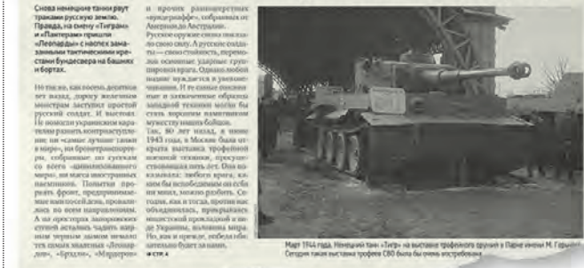
В выпуске газеты от 13 июня 2023 года редакция поддержала идею выставки трофейной техники Украины

Победы русского оружия нужно показывать народу