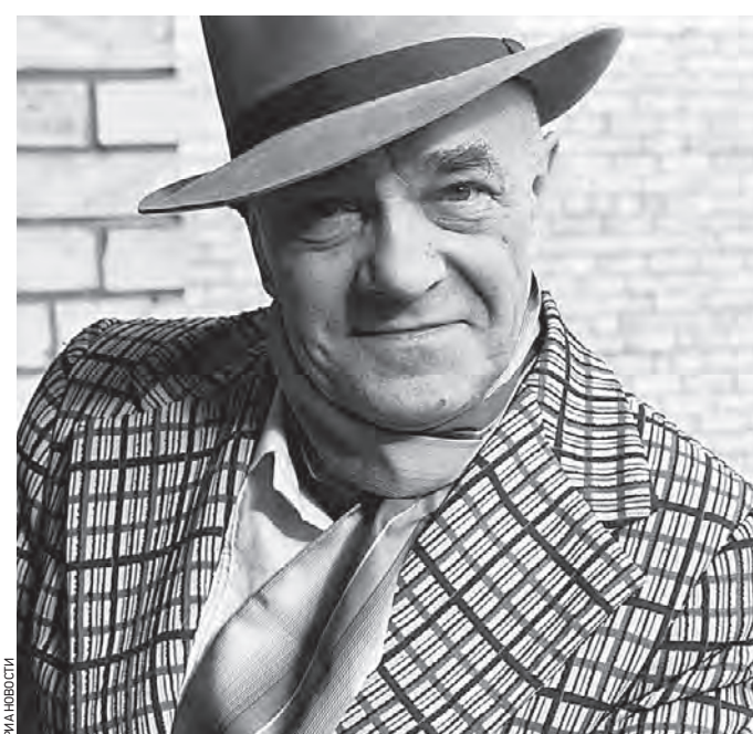
29 сентября 1985 года. Писатель Валентин Саввич Пикуль