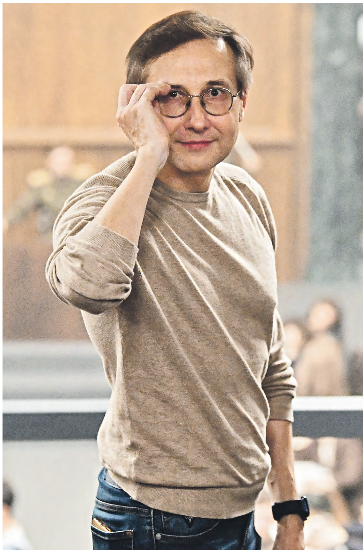
22 июня 2021 года. Режиссер Николай Лебедев во время съемок одной из сцен киноленты «Нюрнберг» в павильоне киностудии «Мосфильм»

В России существует много образовательных проектов для подростков, а особое значение в воспитании молодого поколения играет творчество. Министерство культуры РФ совместно с Киностудией имени Горького впервые провели фестиваль детского кино, в рамках которого киноэкспедицию для школьников организовали Российский фонд культуры и Кинокампус Горького. Корреспондент «ВМ» поговорила с одним из мастеров, режиссером Николаем Лебедевым, о роли кино в формировании системы ценностей через экран, о входе в профессию для молодых специалистов и о том, как наша киноиндустрия реагирует на вызовы времени. Николай Игоревич, вам важно участвовать в проекте, связанном с детско-юношеским кино? Мне кажется, мы все хорошо помним, как в детстве нас формировало кино. Во всяком случае, я это помню со всей очевидностью. Без сказок Надежды Кошеверовой, Александра Роу, Александра Птушко, без музыкальных картин Леонида Нечаева и Алексея Рыбникова лично я не представляю себе ни детства, ни подросткового возраста. Для меня эти фильмы остаются в памяти мерлом доброты, порядочности и смелости, по персонажам из этих фильмов я выстраивал когда-то и свою собственную систему координат. В девяностые годы кинематограф как индустрия в нашей стране перестал существовать, детское кино почти не снимали. Но это не значит, что ребята перестали смотреть кино — они просто выбирали фильмы из других стран. Мне кажется, сейчас наблюдается замечатель-