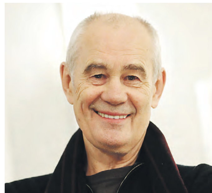
12 октября 2018 года. Режиссер Сергей Бодров-старший на премьере фильма «Два билета домой» режиссера Дмитрия Месхиева в кинотеатре «Иллюзион»