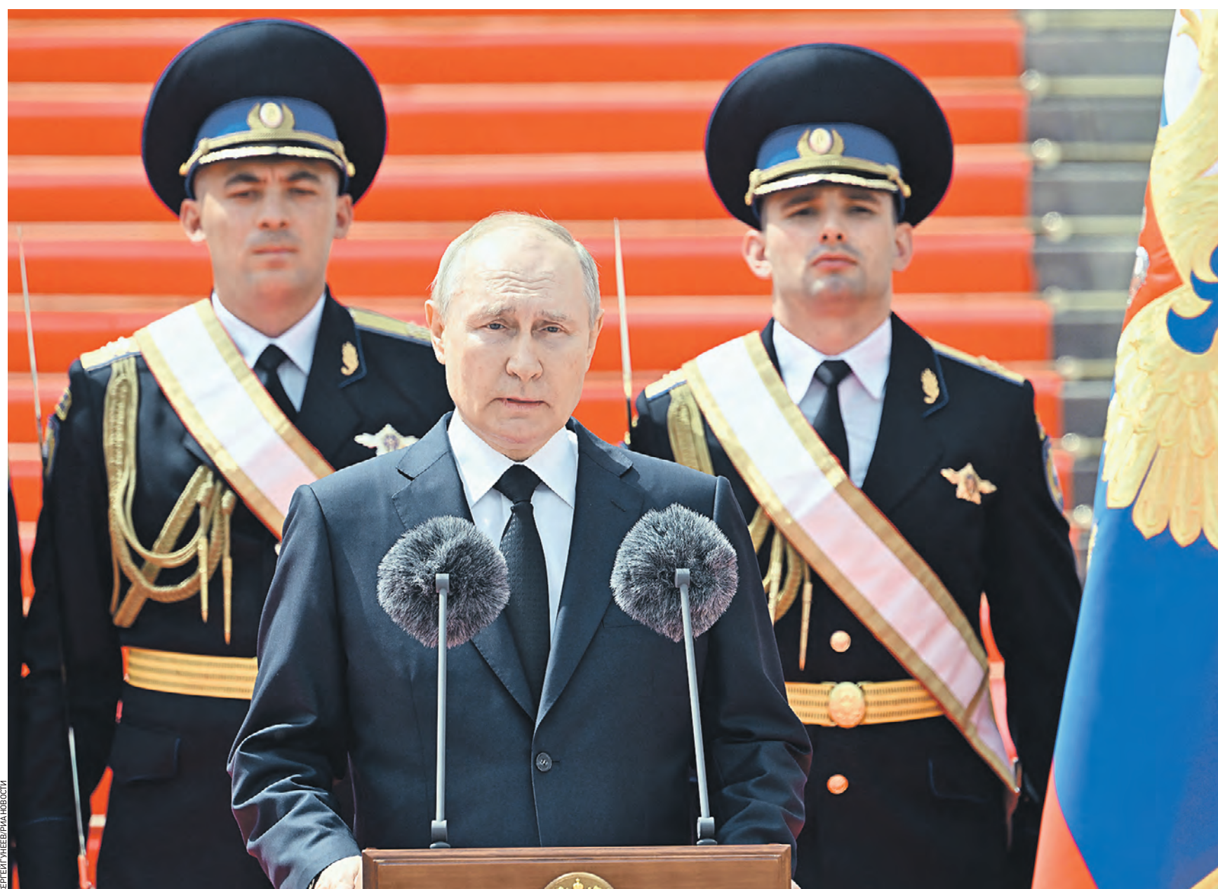
Вчера 13:22 Президент России Владимир Путин выступил перед подразделениями Министерства обороны России, Росгвардии, Федеральной службы безопасности, Министерства внутренних дел и Федеральной службы охраны, которые обеспечили порядок и законность во время мятежа

Президент России Владимир Путин: Жителей страны объединила ответственность за судьбу Отечества