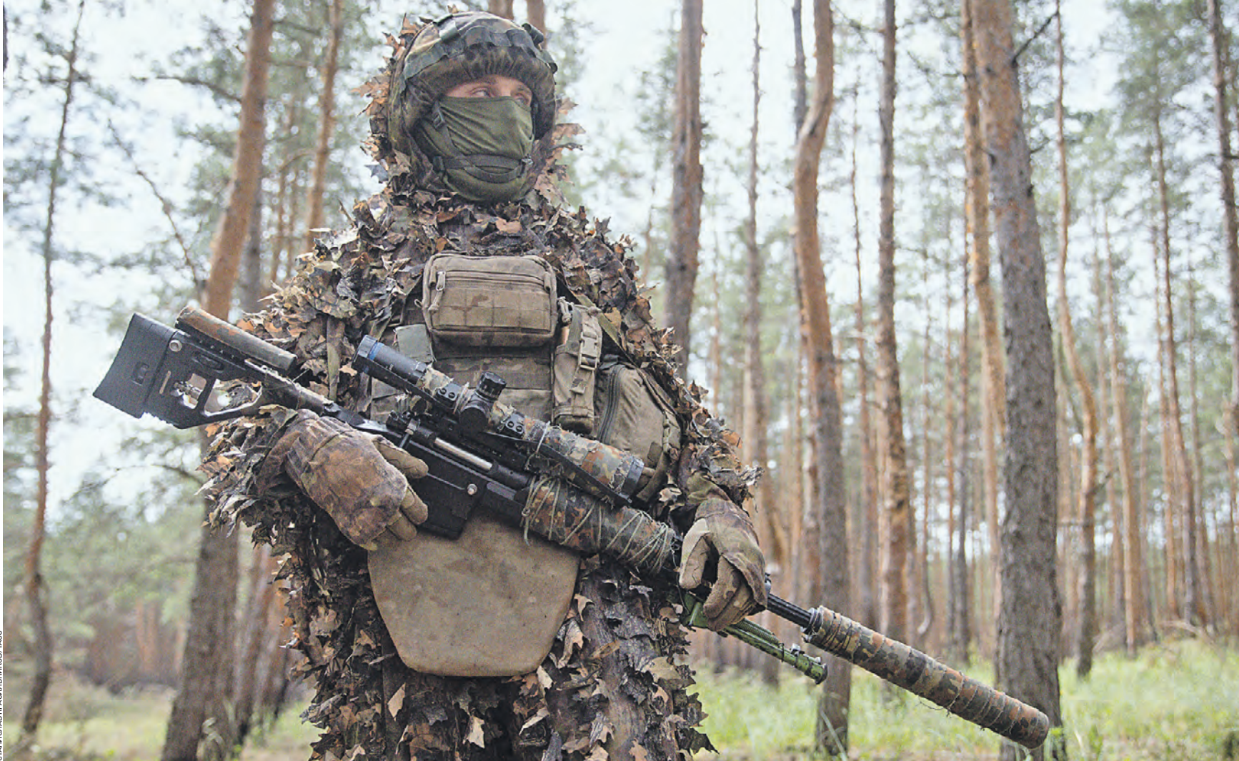
14 июня 2023 года. Снайпер Центрального военного округа выполняет боевую задачу на Краснолиманском направлении в зоне проведения СВО. Вместе с товарищем они прикрыли действия группы специального назначения во время захвата опорного пункта ВСУ

По словам официального представителя Минобороны России генерал-лейтенанта Игоря Конашенкова, при отражении атак ВСУ российские подразделения уничтожили более 100 солдат противника. — На Краснолиманском направлении умелыми и слаженными действиями подразделений группировки войск «Центр» успешно отражены две атаки, — рассказал Конашенков. — Ударами авиации, огнем артиллерии нанесено поражение подразделениям 63-й и 67-й механизированных бригад ВСУ в районах населенных пунктов Червоная Диброва, Червонополонка Луганской Народной Республики и Серебрянка Донецкой Народной Республики. За сутки на данном направлении были уничтожены более 100 военнослужащих противника, самоходные артиллерийские установки «Гвоздика», четыре боевые бронированные машины, три пикапа, гаубицы Д-20 и Д-30. Также Конашенков добавил, что в районе населенного пункта Червоная Диброва в ЛНР российскими подразделениями была успешно пресечена деятельность двух диверсионно-разведывательных групп (ДРГ).