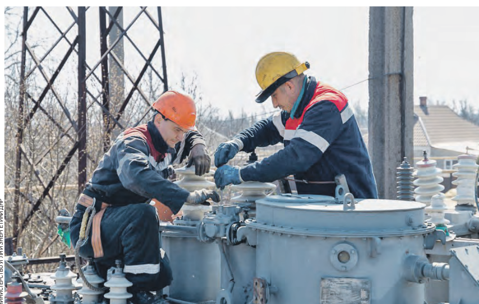
11 апреля 2022 года. ДНР. Энергетики восстанавливают оборудование на подстанции «Ольгинка», поврежденное целенаправленными артиллерийскими обстрелами со стороны вооруженных формирований Украины. После завершения ремонта от нее будет запитан поселок городского типа Ольгинка в Волновском районе республики