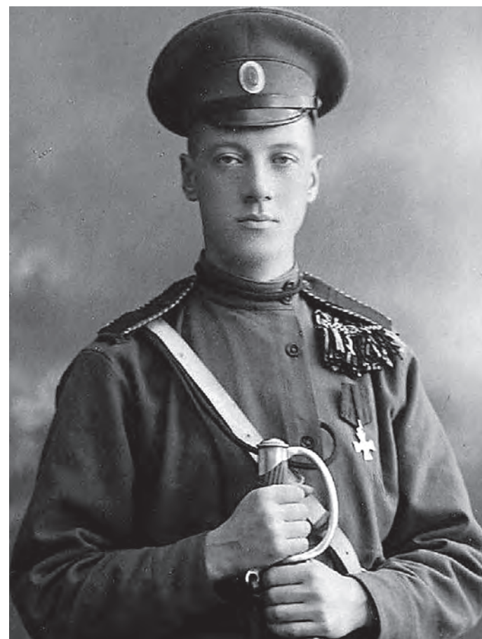
1915 год. Поэт Николай Степанович Гумилев