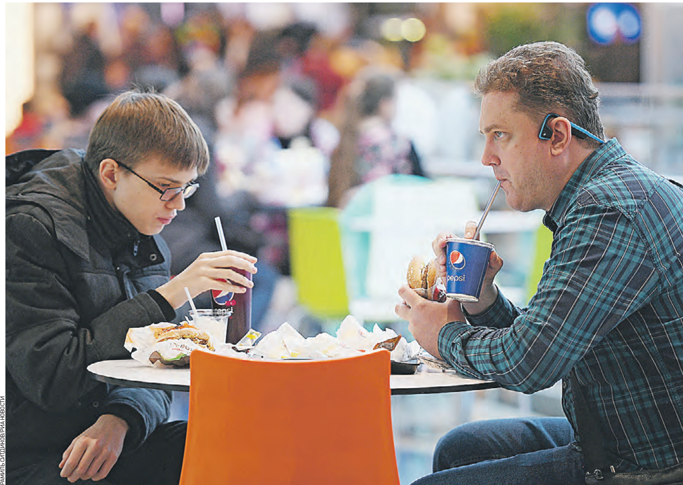
27 октября 2019 года. Посетители ресторанного двора в торговом-развлекательном центре «Каширская Плаза» в Москве. По мнению экспертов, фуд-корты пустыми не останутся: на освободившиеся площади быстро придут новые точки фастфуда

Так, американская сеть пиццерий Papa John's сообщила о приостановке производства. Но все 188 ее ресторанов в России работают и продолжают торговать по договору о франчайзинге с владель-