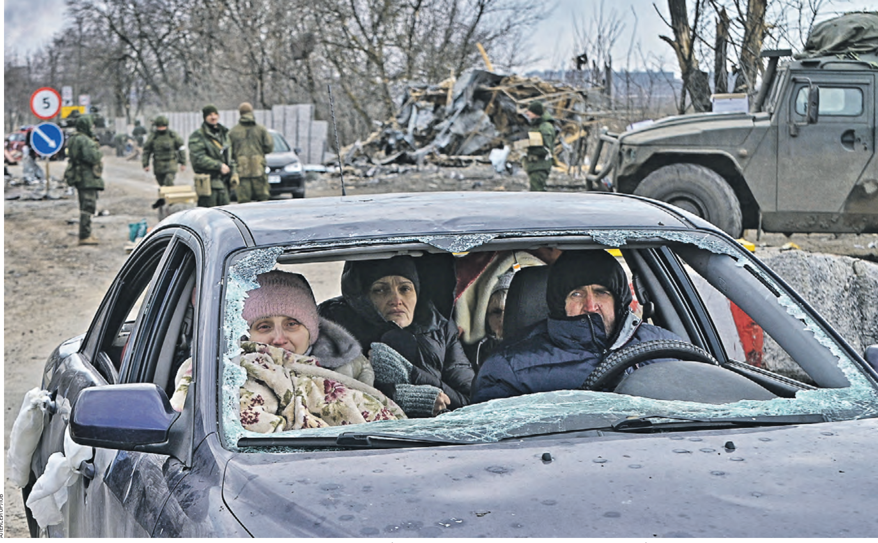
16 марта 13:58 Жители Мариуполя покидают город на своем автомобиле по гуманитарному коридору, который начал работать 15 марта. В первый день из города выехали две тысячи легковых машин с мирными жителями

— Последние две недели мы спокойно затягиваем кольцо, потихоньку выбиваем противника с передней линии обороны, — говорит Ходаковский. — Наша задача — про-