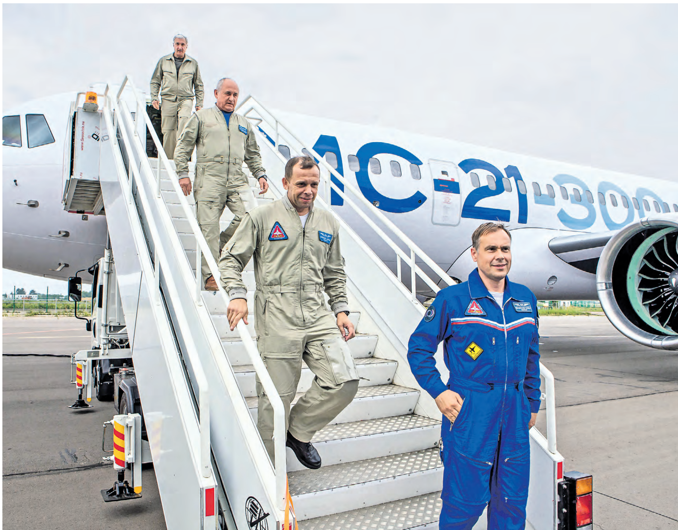
Московская область. Экипаж второго российского пассажирского самолета МС-21-300, прибывшего в аэропорт Жуковский, где он будет направлен на сертификационные тесты

Сегодня мир все больше распадается на противостоящие друг другу экономические блоки