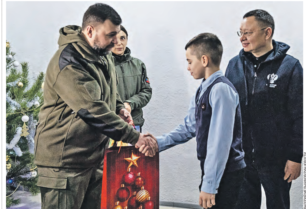
25 декабря 12:59 Денис Пушилин (слева) и министр строительства и ЖКХ РФ Ирек Файзуллин поздравили детей с Новым годом в санатории-профилактории «Чайка» в Мариуполе

МИХАИЛ ГАЛУЗИН ЗАМЕСТИТЕЛЬ МИНИСТРА ИНОСТРАННЫХ ДЕЛ РОССИИ Любые прогнозы относительно времени завершения украинского кризиса могут оказаться несостоятельными. Военное противостояние приняло затяжной характер. Запад настроен на полную и безоговорочную победу Киева с возвращением в состав Украины всех новых российских регионов, а также Крыма. Западники рассчитывают на то, что мы будем выплачивать репарации и заниматься восстановлением Украины. Подобные предварительные условия не могут служить основой для конструктивного диалога.