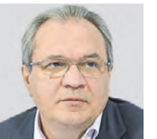
ВАЛЕРИЙ ФАДЕЕВ ПРЕДСЕДАТЕЛЬ СОВЕТА ПО ПРАВАМ ЧЕЛОВЕКА ПРИ ПРЕЗИДЕНТЕ РФ

Есть тема разграничения политических и социальных прав, мол, это разные сферы. Но я с этим категорически не согласен. Мы равно обращаем внимание на обе сферы. Так, в декларации упоминается свобода от нужды — мы начали плотно заниматься этой темой, в частности, вопросом низких реальных доходов медиков. И сейчас Россия имеет реальную возможность стать мировым лидером в сохранении, развитии и защите идеологии прав человека.