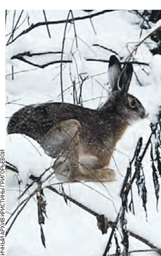
13 декабря. Заяц-русак Профсоюзник вновь в родной природе

Дом Заяца совместно со столичным Департаментом природопользования и охраны окружающей среды в этом году выпустил в лесопарках Новой Москвы 120 белых и русаков. В их число попал и Профсоюзник — заяц, которого спасли в районе одноименной станции метро.