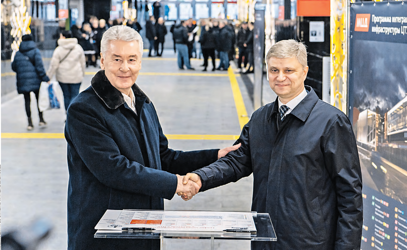
Вчера 13:34 Мэр Москвы Сергей Собянин (слева) и генеральный директор Российских железных дорог Олег Белозеров утвердили план-график строительства и реконструкции станций на третьем и четвертом Московских центральных диаметрах

Вчера мэр Москвы Сергей Собянин и гендиректор Российских железных дорог Олег Белозеров открыли после реконструкции пригородный вокзал Перedelкино и подписали график работ на следующий год.