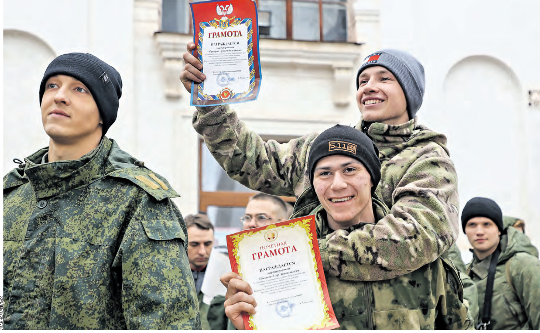
Вчера 13:15 Студенты, призванные для участия в СВО, после церемонии увольнения с военной службы. В самое ближайшее время они вернутся на учебу. Кроме того, всех вернувшихся с СВО переведут на бюджетные места

— На авдеевском направлении после освобождения Опытного у наших подразделений появилась возможность продвигаться вперед