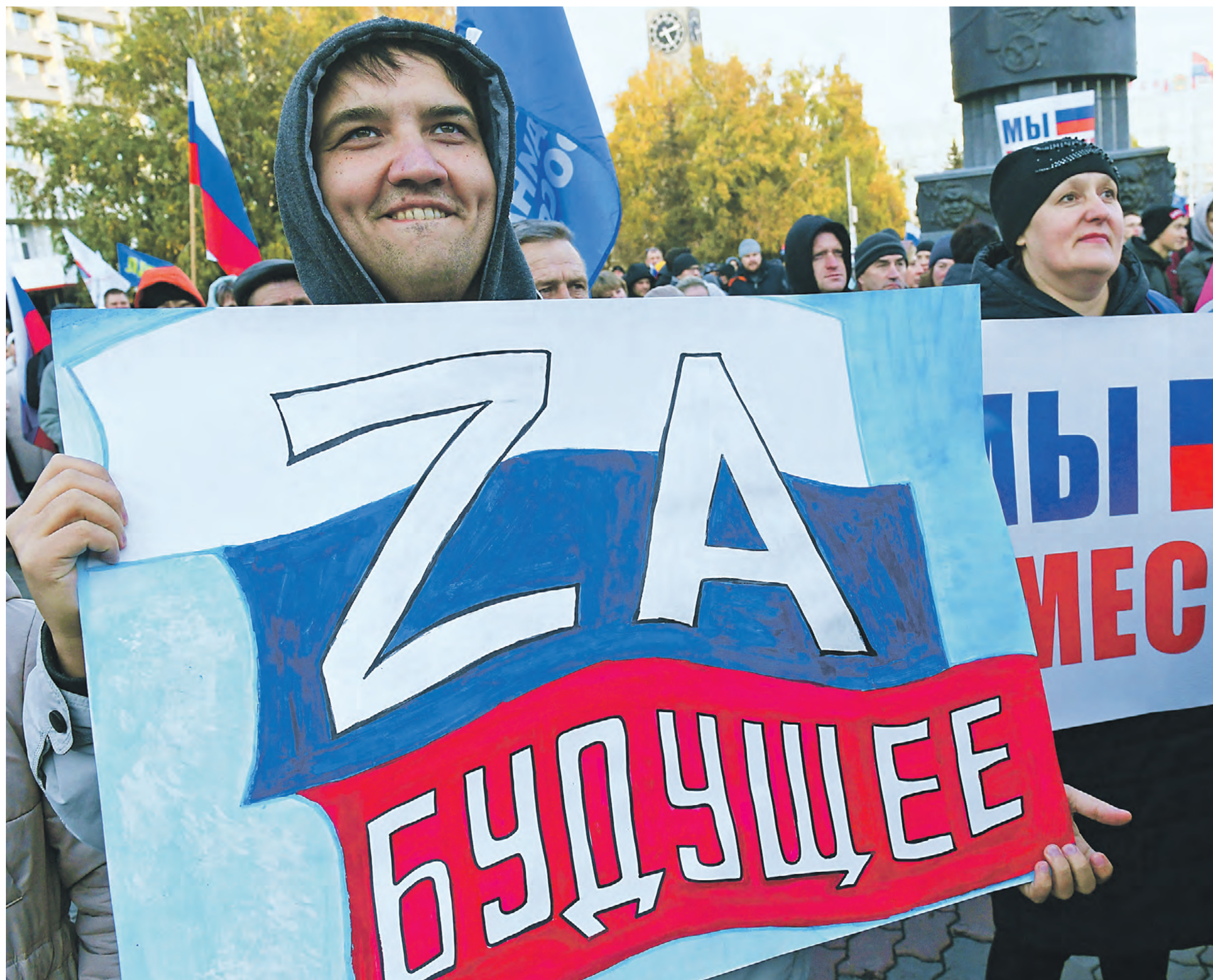
30 сентября 2022 года. Люди на митинге-концерте «Мы вместе» в честь вхождения в состав России ДНР, ЛНР, Херсонской и Запорожской областей на Театральной площади Красноярска

Присоединение новых территорий — лишь начало нашей грядущей трансформации