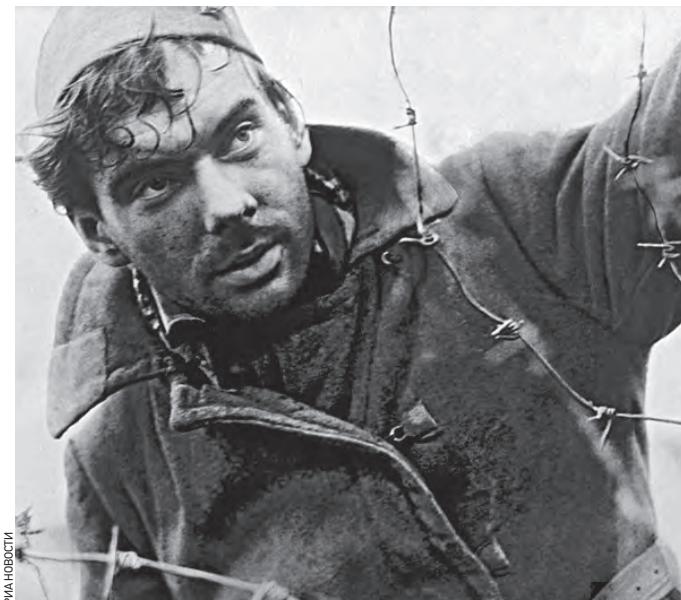
1957 год. Кадр из фильма «Летят журавли» Михаила Калатозова. Алексей Баталов в роли Бориса

Снятый по пьесе Виктора Розова «Вечно живые», фильм сам вошел в категорию вечно живых — несмотря на то, что за 65 лет его жизни мир изменился до неузнаваемости. По-прежнему время и на вечные ценности, даже на любовь. Но «Журавли» сберегли своими «крыльями» и ее, и веру в светлое в сакральной неприкосновенности, став гимном жизни, побеждающей и смерти. Мощных фильмов о том, как война крушила судьбы, было снято немало. Но «Летят журавли» и среди лучших оказывался на ступеньку выше. И эту его загадку силиться отгадать многие. Оставим без обсуждения игру актеров, причем не только дуэта Татьяны Самойловой (Вероники) и Алексея Баталова (Бориса), но и их коллег: она безупречна. Разгадка магического притяжения и обаяния картины — в ее целостности, состоящей из множества знаковых деталей. Конечно, основу успеха фильма заложили гениальная режиссура Михаила Калатозова и безупречный вкус и новаторство оператора Сергея Урушевского. Но главное было в простоте сказанной ими правды. Современного зрителя сюжет «Журавлей» уже не шокирует так, как зрителя советского. Но 65 лет назад он произвел эффект ментального взрыва, поскольку абсолютно не походил на кинопредшественников и накалом страстей, и трактовкой образа главной героини. Она была далека от идеала: не только отличалась дерзкой свободой, но еще и изменила жениху, ушедшему на фронт; не было в ней и смелости, присущей героиням прошлого, но была непорочная сексуальность. Но каким-то загадочным обра-