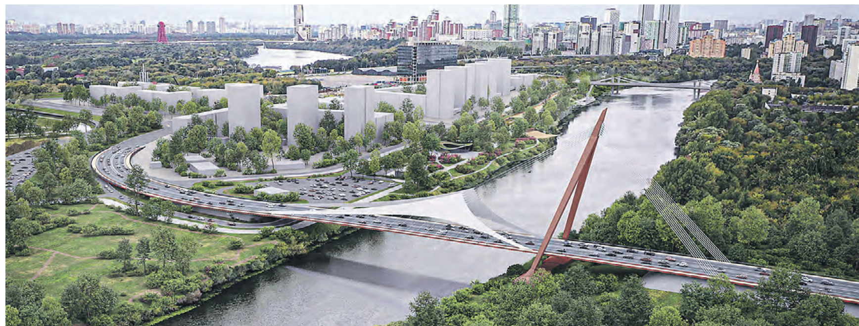
Проект автомобильного моста на территории Мневниковской поймы через Москву-реку вблизи улицы Новозаводской