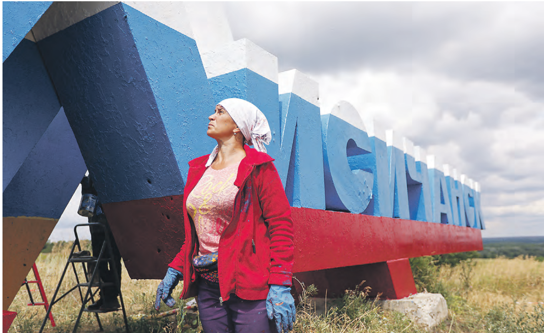
22 июля 2022 года. Мэляры во время работ по перекрашиванию стелы на въезде в город Лисичанск Луганской Народной Республики в цвета российского триколора. Населенные пункты, переходящие под полный контроль союзных войск, начинают восстанавливать. Туда возвращается спокойная и мирная жизнь