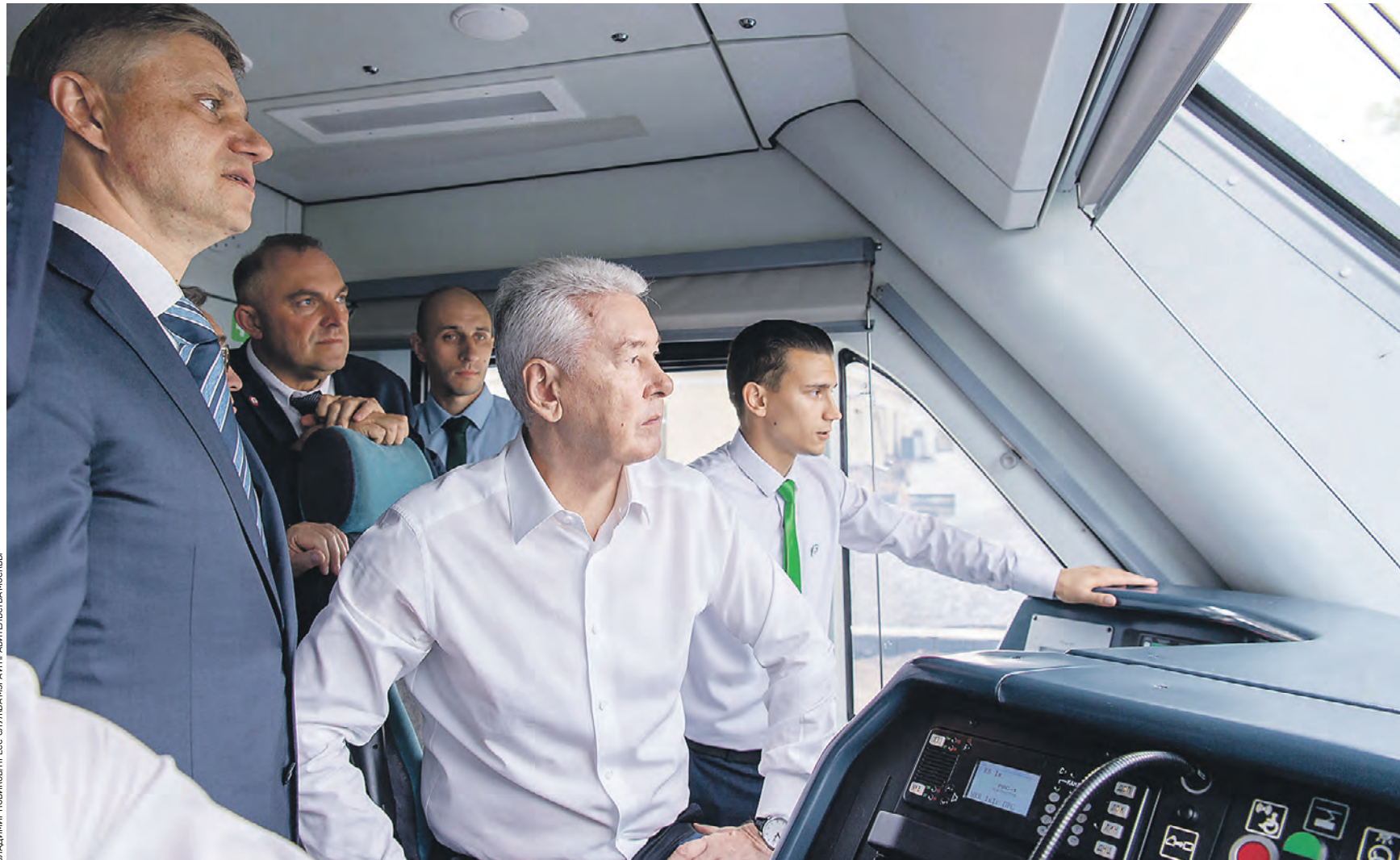
Вчера 13:17 Мэр Москвы Сергей Собянин (в центре) и генеральный директор ОАО «РЖД» Олег Белозеров (слева) едут в кабине машиниста поезда «Иволга» по реконструированному участку на центральном участке МЦД-2 от «Курской» до «Площади трех вокзалов»

— Одним из сложнейших проектов является МЦД-4, который объединит семь вокзалов и создаст 44 пересадочных пункта, — добавил мэр столицы.