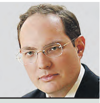
АЛЕКСАНДР СОЛОВЬЕВ ПРЕЗИДЕНТ ФОНДА РАЗВИТИЯ ТВОРЧЕСКИХ ИНИЦИАТИВ