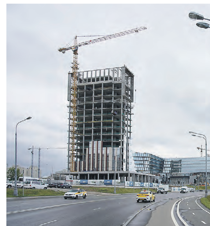
12 июля 2022 года. Завершение монолитных работ на кластере «Образовательный» научной долины МГУ

Первые восемь инновационных компаний уже получили статус резидентов кластера «Ломоносов». Пона они работают в других помещениях, но уже могут пользоваться налоговыми льготами и другими преимуществами участников проекта ИНТЦ. О своей заинтересованности стать резидентами технологического кластера заявили уже более 180 компаний.