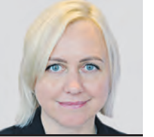
ЕКАТЕРИНА ДРАГУНОВА ПРЕДСЕДАТЕЛЬ КОМИТЕТА ОБЩЕСТВЕННЫХ СВЯЗЕЙ И МОЛОДЕЖНОЙ ПОЛИТИКИ МОСКВЫ

Я из своего района не собираюсь переезжать никуда. Активно участвую в его жизни, в районных субботниках, голосованиях на «Активном гражданине». К слову, мои родители живут неподалеку от меня. В той же квартире, где я выросла. И я часто захожу к ним в гости, вижу, как преобразился дворик моего детства. Он сохранил свой уют, но стал более современным. Благоустраивали и двор школы, в которой я училась несколько классов. Причем приходило туда теперь могут все горюжаны, заниматься спортом, играть на детской площадке.