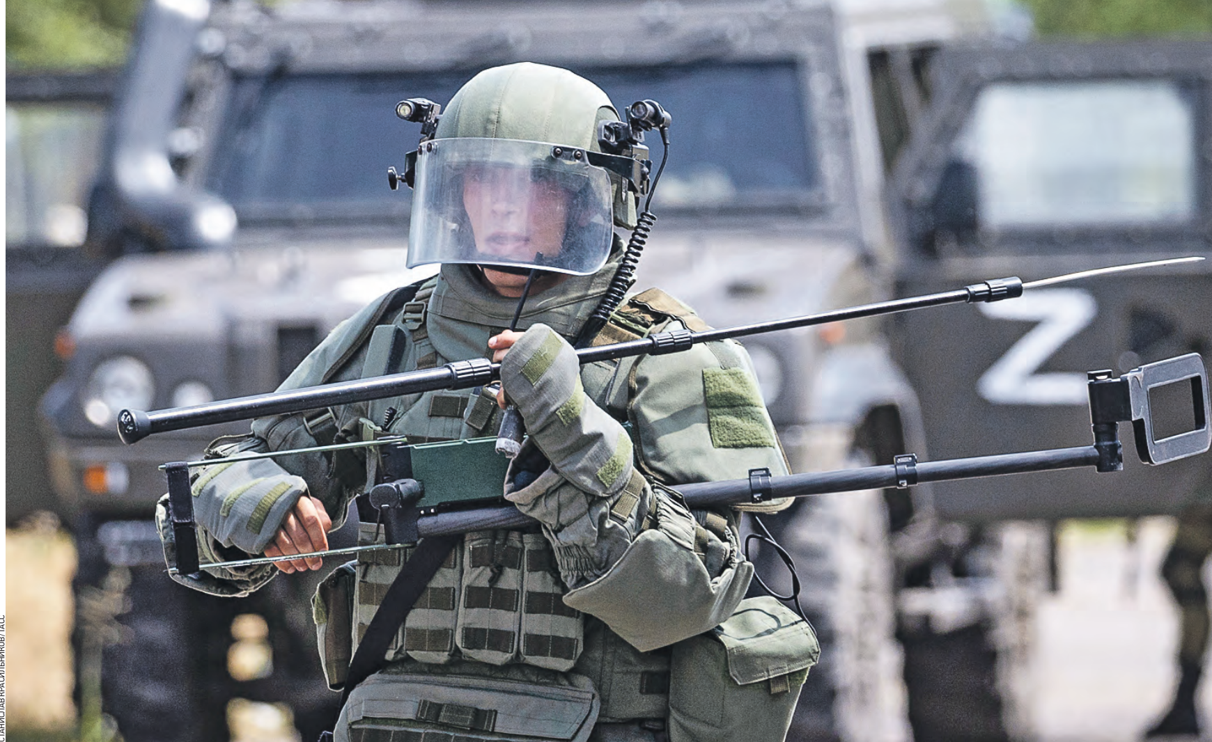
14 июля 17:23 Военнослужащий отряда разминирования Международного противоминного центра ВС РФ обследует улицы освобожденного от националистов Северодонецка. В руках у солдата — шуп и минискатель

— А дальше они идут в страны Запада, где цена на органы возрастает многократно, — уточнил Марочко. Министр обороны России Сергей Шойгу отдал указание