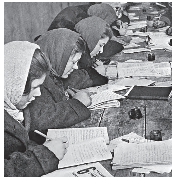
Март 1932 года. Рабочие московского завода «Красный богатырь» на занятии по ликвидации безграмотности

«Вечерняя Москва» рассказывает о событиях, которые происходили в этот день и повлияли на ход отечественной и зарубежной истории.