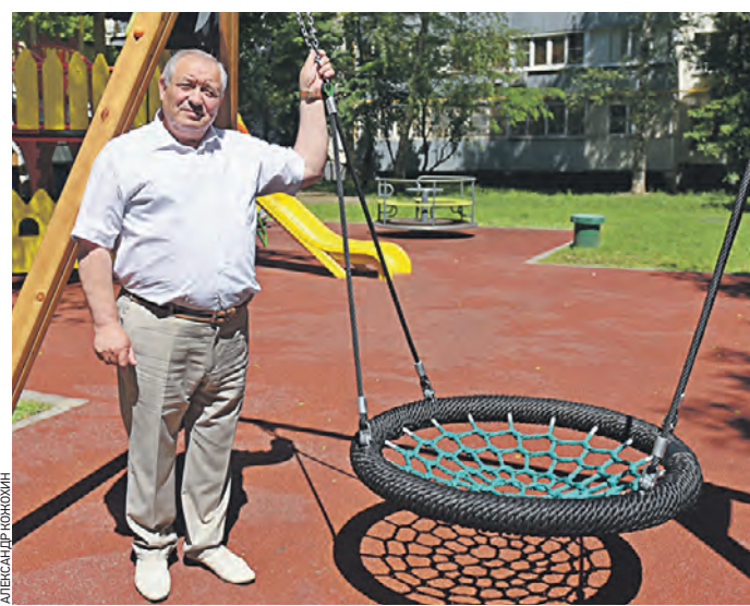
Вчера 14:15 Глава управы района Люблино Алексей Бирюков проверяет обновленную детскую площадку

В Люблине активно развивается спортивная инфраструктура и благоустраиваются дворовые территории. Вчера глава управы района Алексей Бирюков рассказал «ВМ», почему важно создавать все условия для комфортных занятий спортом.