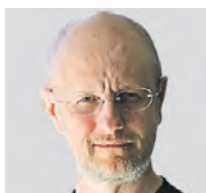
ДМИТРИЙ ПУЧКОВ ПИСАТЕЛЬ, ПУБЛИЦИСТ, БЛОГЕР

Падение доходов блогеров связано не только с блокировкой иностранных соцсетей, но и с тем, что это в принципе был большой мильный пузырь. Он должен был рано или поздно лопнуть. Из России ушли многие иностранные компании, которые платили блогерам за рекламу по западным расценкам, а у нас никого, кто мог бы отдавать такие же бешеные деньги за рекламу, не нашлось. Если говорить о будущем, то нас ждет отток и пользователей, и производителей контента в «дружественные» соцсети. Тот же Rutube, конечно, сильно отстал от своего западного конкурента, но если всерьез взяться за его развитие, то года два-три отрыв можно наверстать.