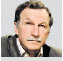
ГЕОРГИЙ БОБТ ОБОЗРЕВАТЕЛЬ

Официальный представитель МИД КНР напомнил, что Вашингтон 20 лет назад спровоцировал войну на Ближнем Востоке, унесшую жизни 900 тысяч человек. В их числе 335 тысяч гражданских — минимум в десять раз больше, чем цифры потерь среди мирного населения Украины, которые дают даже самые критически настроенные по отношению к России источники. По словам китайского дипломата, военные США продолжают незаконно находиться на северо-востоке Сирии под предлогом помощи курдам в ликвидации угрозы со стороны исламистов. При этом он обвинил американцев еще и в том, что они более пяти лет вывозят сирийскую нефть на свои базы в Ираке. Последнее обвинение символично. Как же так? Сирия ведь под гнетом санкций?