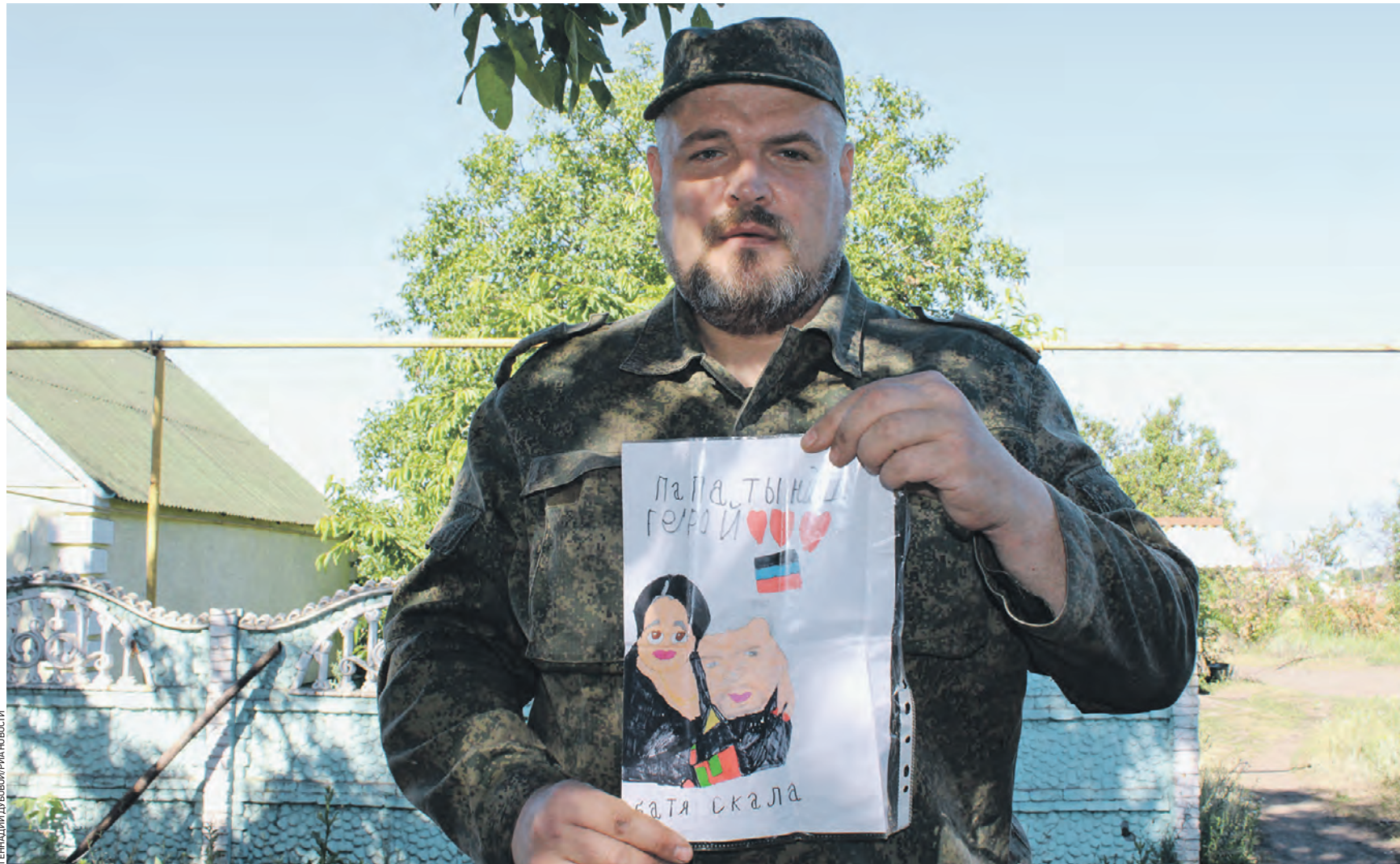
24 июня 16:12 Боец подразделения полка полиции специального назначения имени Героя России Ахмата-Хаджи Кадырова МВД Чеченской Республики показывает рисунок своего ребенка с надписью «Папа, ты наш герой». Отряд «Ахмат» сейчас занимает позиции вблизи Лисичанска