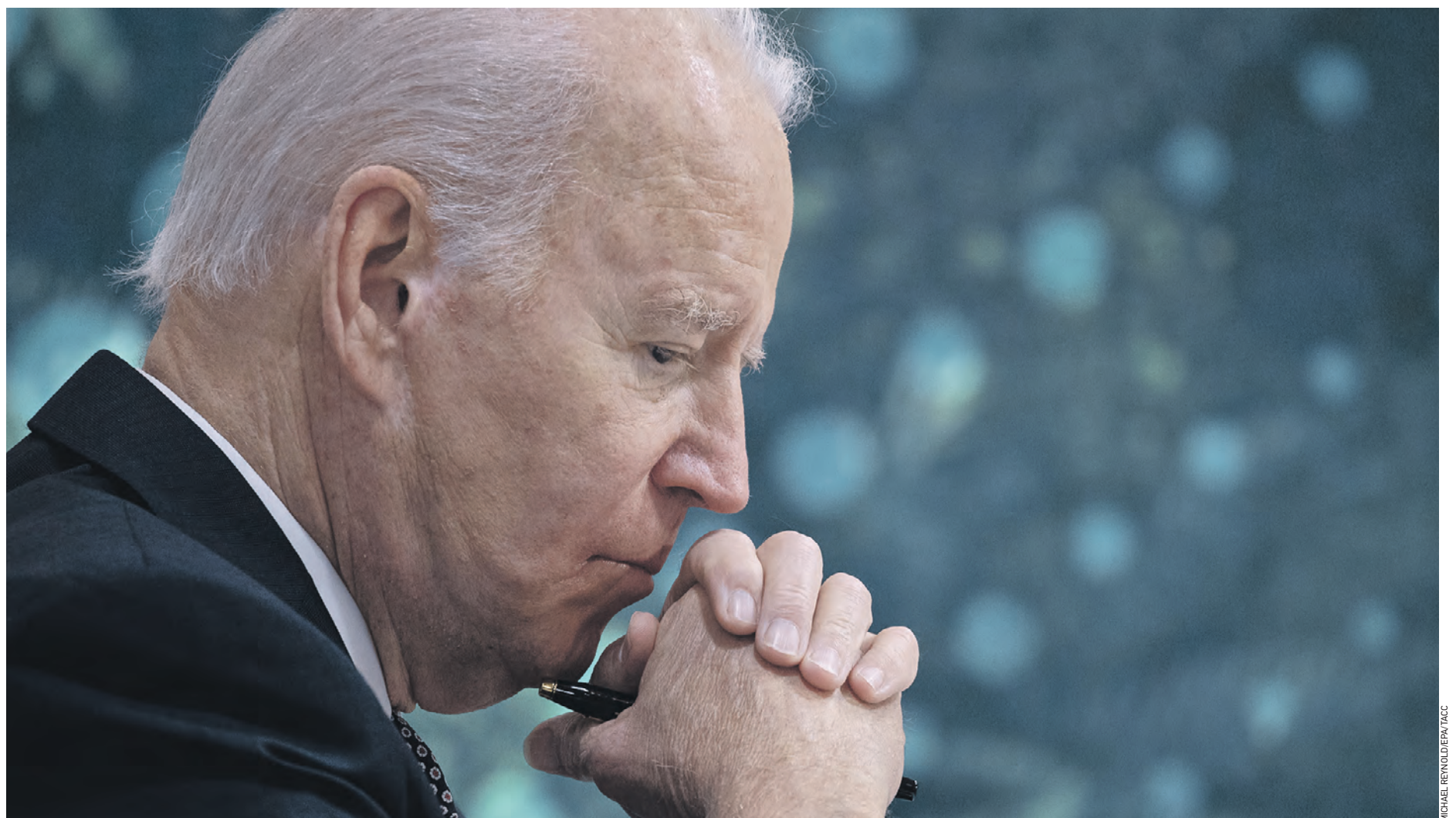
17 июня 2022 года. Президент Соединенных Штатов Америки Джо Байден в Белом доме в Вашингтоне. Он созвал лидеров Форума крупнейших экономик по энергетике и климату для обсуждения энергетической и продовольственной безопасности