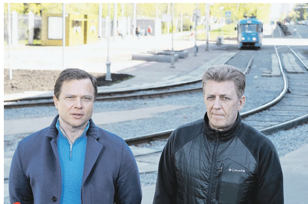
Вчера 11:06 Руководитель Департамента транспорта Максим Ликсутов (слева) и начальник Московского метрополитена Виктор Козловский на открытии трамвайной линии после ремонта

На севере Москвы, в районе станции метро «Войковская», на два с половиной месяца раньше срока закончен ремонт последнего участка трамвайных путей. Вчера возобновилось движение по маршрутам № 23, 27, 29 и 30.