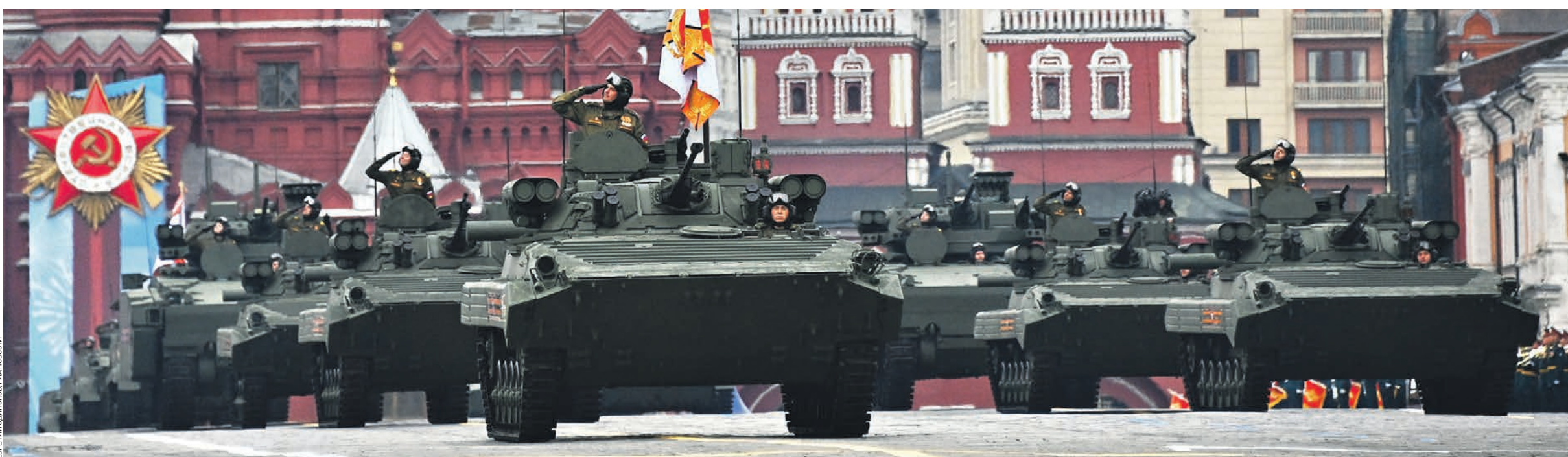
9 мая 10:51 Колонна боевых машин пехоты БМП-2М прошла на параде Победы по Красной площади. Эта грозная техника поступила на вооружение Советской армии 15 октября 1980 года. Впервые ее показали широкой публике спустя два года, во время парада на Красной площади 7 ноября. Всего 9 Мая зрители увидели 190 единиц боевой техники. Это машины времен Великой Отечественной войны и современные образцы оружия. По традиции на главе колонны прошли танки Т-34, которые считают одним из символов Победы. Несмотря на непогоду, воздушная часть парада тоже состоялась. Над Красной площадью пролетело 76 единиц авиатехники.