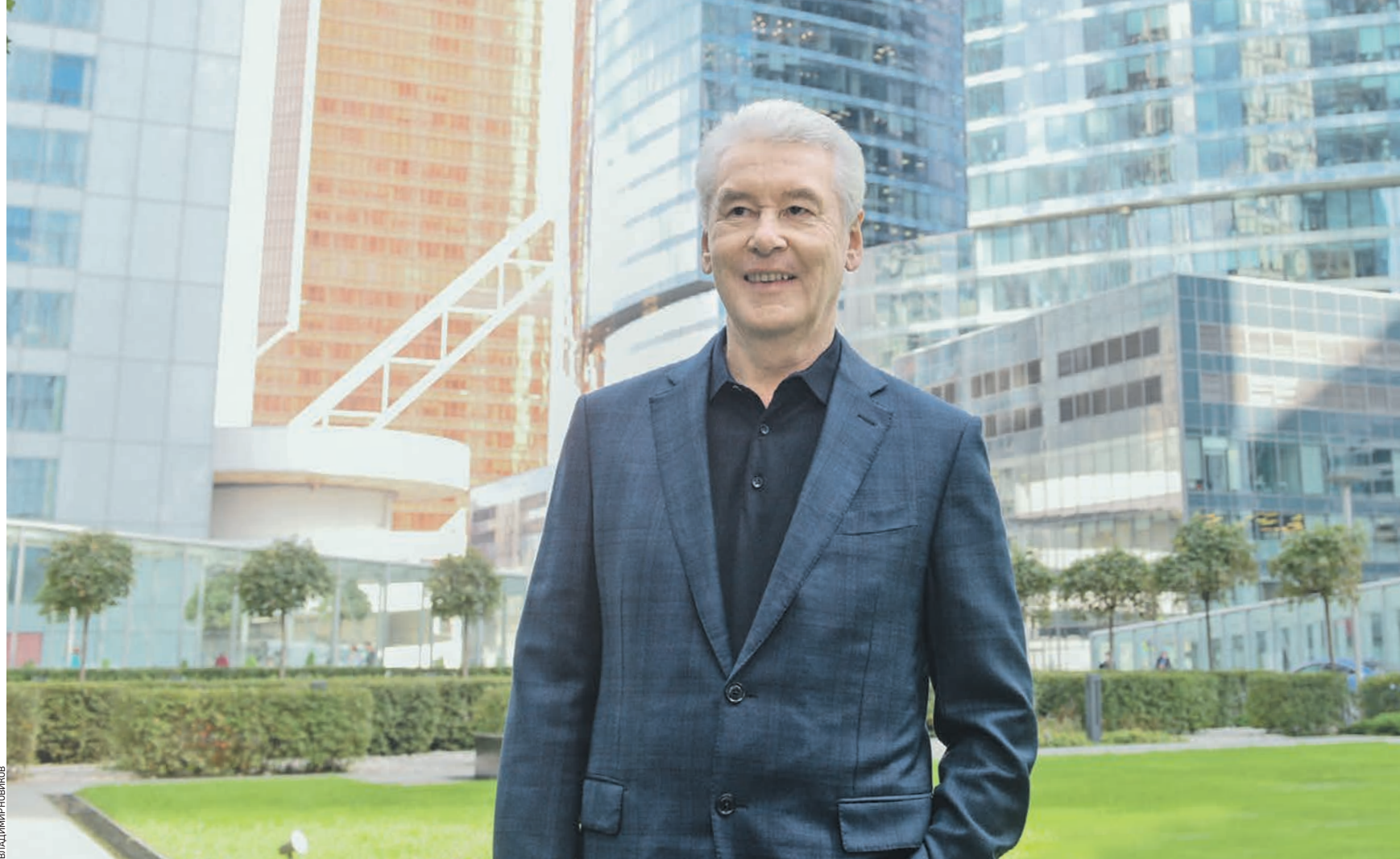
16 сентября 2020 года. Мэр Москвы Сергей Собянин рассказал о планах благоустройства на 2021 год. Среди основных проектов — реорганизация бывших промышленных зон, создание комфортных жилых и бизнес-кварталов, а также комплексное развитие транспортной инфраструктуры

В прошлом году во время обустройства на магистрали островков безопасности для пешеходов убрали под землю воздушные провода, которые портили вид. В планах на текущий сезон — заменить на автобусных остановках старые павильоны, установить вдоль дорог и отремонтированных