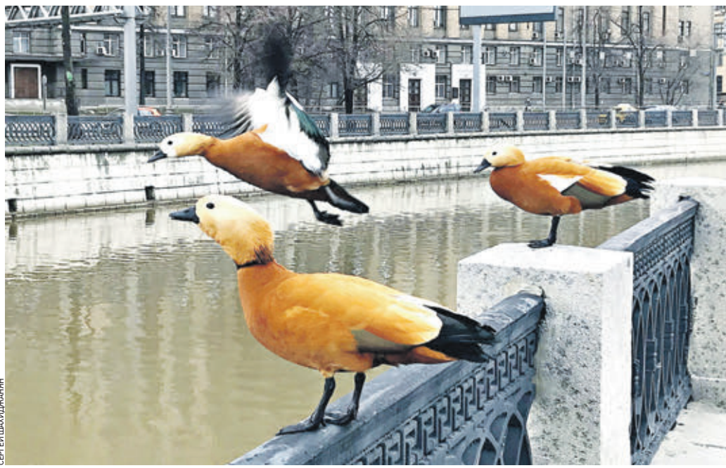
Вчера 15:50 Зимой утки-огары обитают на большом пруду Московского зоопарка. А когда потеплеет — селятся по всей столице. Например, на Головинской набережной

В дикой природе эти птицы обитают в степях. При этом ее влияние на московскую фауну пока мало изучено. В городской среде огары чувствуют себя превосходно. Хотя и бытует такое мнение, что если появилась эта птица на водоеме, то вести себя будет нагло — обязательно выживет других пернатых с на-