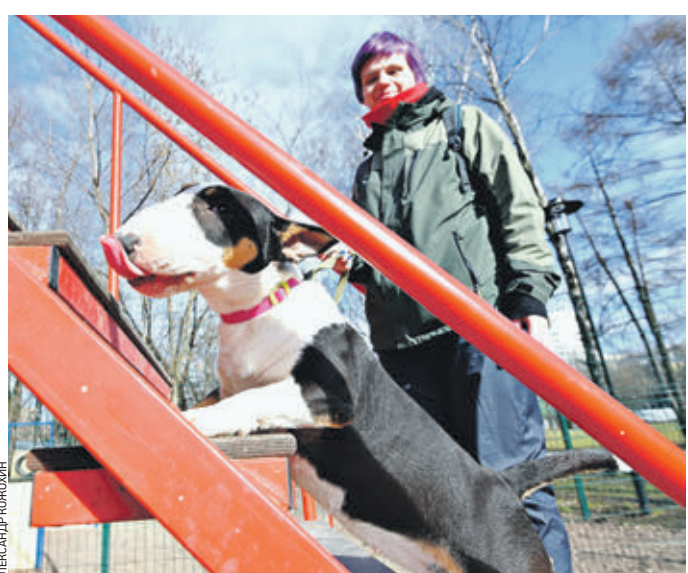
Вчера 15:00 Мини-бультерьер Кира штурмует спортивный снаряд, предназначенный для крупных собак