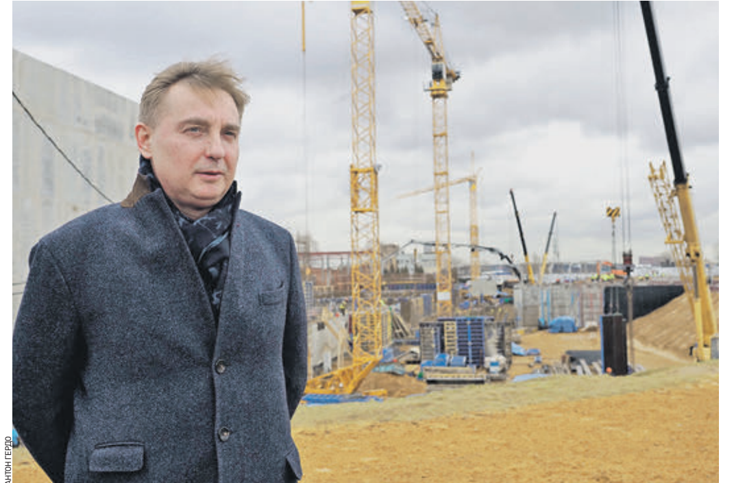
12 марта 2020 года Глава столичного Департамента природопользования и охраны окружающей среды Антон Кульбачевский на территории очистных сооружений

На Люберецких очистных сооружениях идет масштабная реконструкция. Она поможет не только повысить качество очистки воды, но и полностью устранить неприятные запахи, на которые жаловались жители восточных и юго-восточных районов столицы. Полный запуск сооружений со всеми технологическими новинками состоится в конце 2022 — начале 2023 года. Об этом вчера сообщили в Мосводоканале.