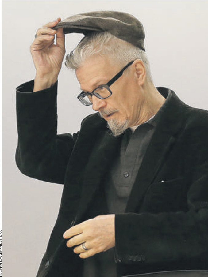
30 апреля 2014 года, Москва. Писатель Эдуард Лимонов на съезде незарегистрированной партии «Другая Россия»

В 20 лет Эдик продолжил «путь революционера», приняв участие в забастовках, затем потянулся в столицу. Обеспечивал себя, промышленный шитьем. «Самопальней» джинсы у Эдички получались не хуже оригинала. Не зря же их носили Эрнст Неизвестный и Булат Окуджава... Семь лет в столице и общение с диссидентами сделали Лимонова известным. Ему было всего тридцать, когда Юрий Андропов назвал его «убежденным антисоветчиком».