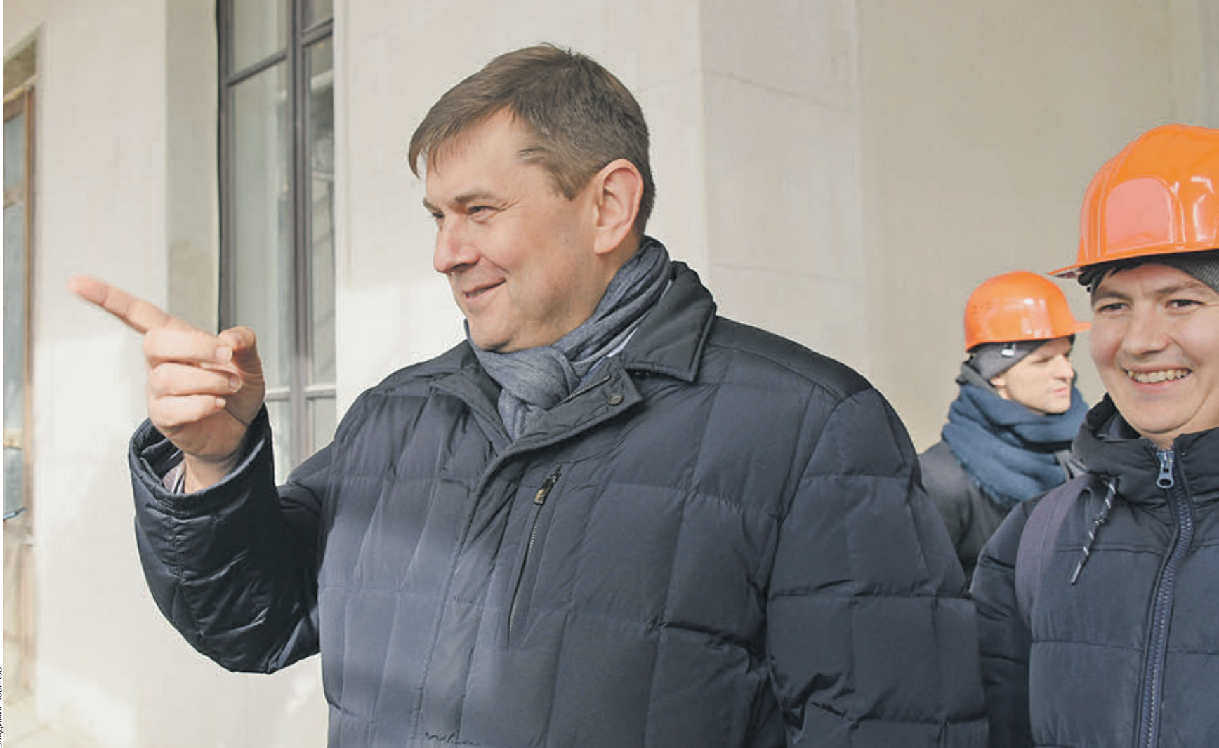
Вчера 14:21 Глава Департамента культурного наследия Москвы Алексей Емельянов на территории Северного речного вокзала. Проект реставрации предполагает приспособление памятника архитектуры и использованию в современных условиях. Как и раньше, вокзал будет принимать суда

Кроме того, специалисты восстановили фонари-ландыши на вентиляционных шахтах, позолоченные лоты и бра 1937 года — всего около 500 светильников. Интересно, что во время реставрации самой большой лоты на складе вокзала нашли несколько коробок с оригинальными запасными плафонами. Все они чудесным образом хорошо сохранились, и их использовали для замены старых. — Еще совсем недавно здание речного вокзала напоминало руины, — сказал Алексей Емельянов. — На наших глазах прошли противоаварийные работы, и к началу 2020 года завершилась реставрация фасадов.