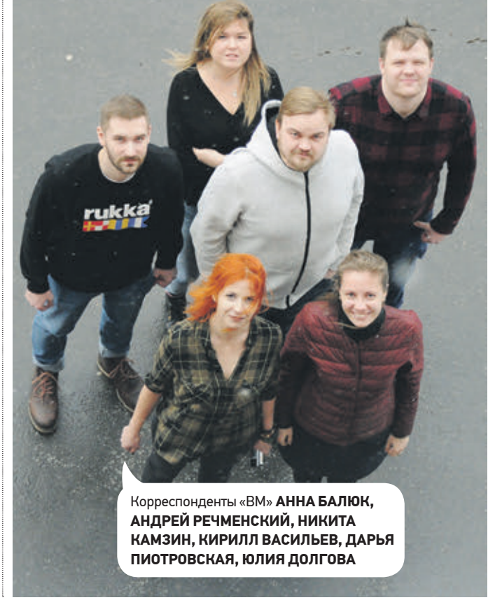
Корреспонденты «ВМ» АННА БАЛЮК, АНДРЕЙ РЕЧМЕНСКИЙ, НИКИТА КАМЗИН, КИРИЛЛ ВАСИЛЬЕВ, ДАРЬЯ ПИТРОВСКАЯ, ЮЛИЯ ДОЛГОВА