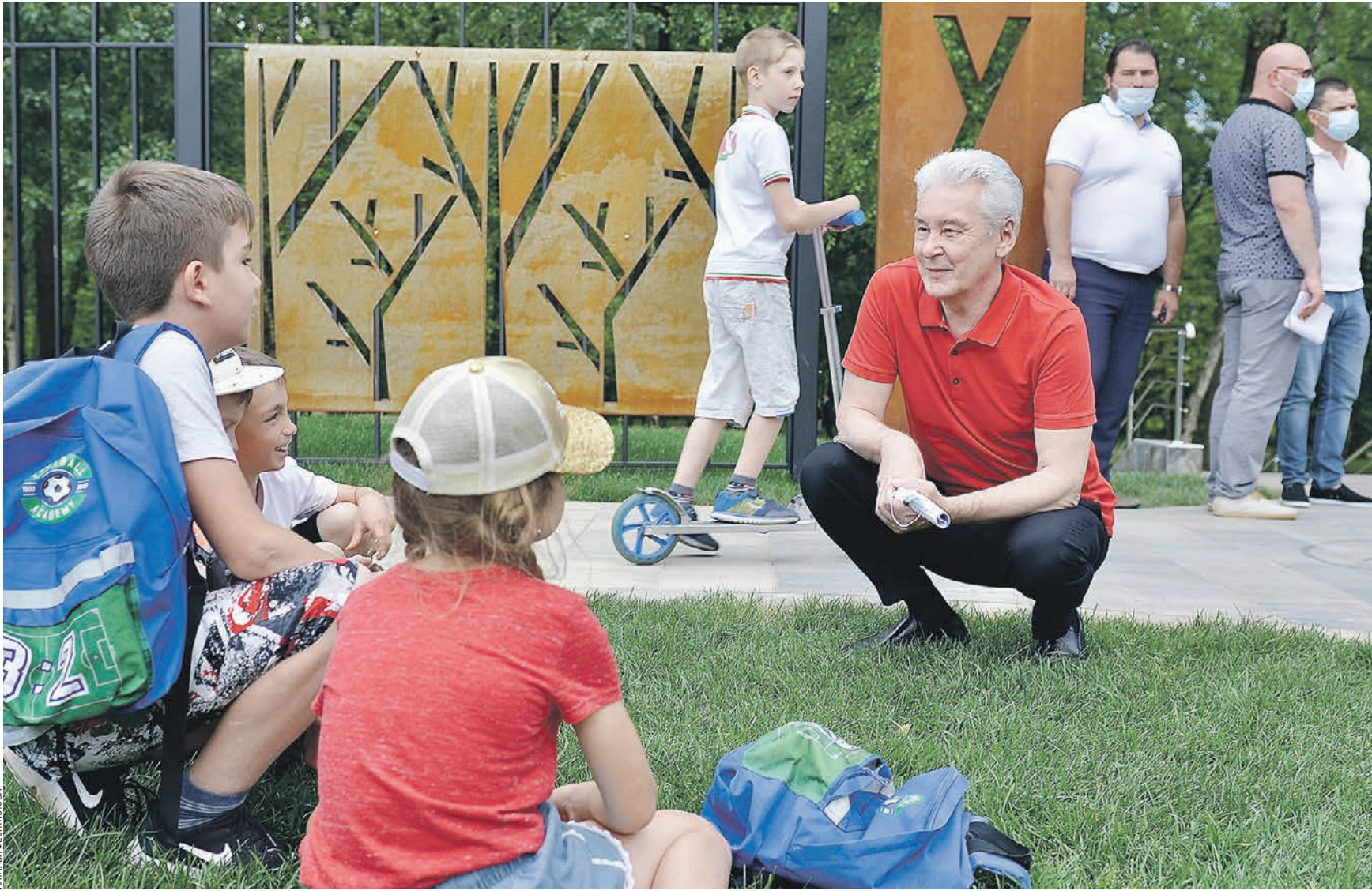
Вчера 13:51 Мэр Москвы Сергей Собянин (справа) во время открытия парка «Филатов луг» в Новой Москве пообщался с юными горожанами, которые уже успели оценить благоустройство территории и поиграть на детских площадках

В день годовщины присоединения новых территорий Сергей Собянин посетил строительство станции «Мамыри» Коммунарской линии метро. Она находится в поселении Сосенское вдоль Калужского шоссе на пересечении с улицей Адмирала Корнилова. Станция мелкого заложения с двумя вестибюлями — наземным и подземным. В пресс-службе столичной мэрии рассказали, что сейчас на стройке ведутся земляные и монолитные работы, а также возводятся ограждающие конструкции котлована. — Активно ведем строительство самой большой ветки метро в Москве за всю ее историю — 36 километров от станции «Улица Новаторов» до Троицка, — рассказал глава города. — Первая очередь от «Улицы Новаторов» до «Ком-