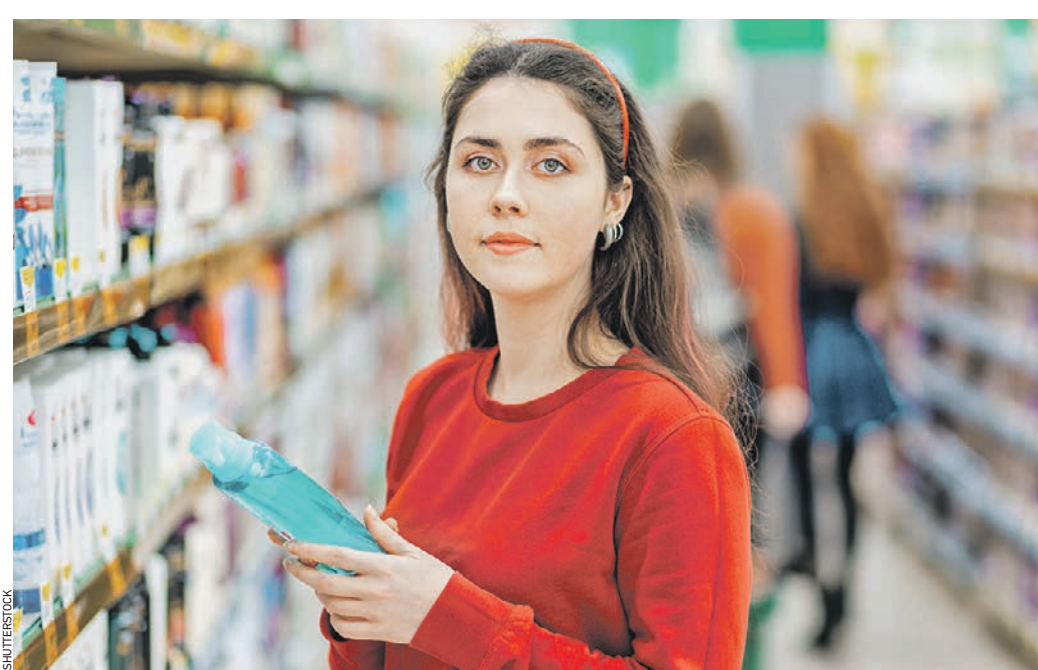
Женщины, выбирая в магазинах шампунь, обычно обращают внимание на упаковку, а также цвет моющего средства и запах. Состав на этикетке, к сожалению, большинству не говорит ни о чем

— По ГОСТу пенное число должно быть не менее 100 миллиметров, а устойчивость пены — не менее 0,8, — рас-