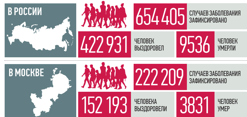
По данным стопкоронавирус.рф и mos.ru на 19:00 1 июля