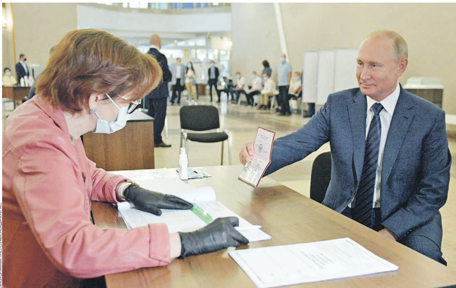
Вчера 10:57 Президент России Владимир Путин во время голосования по поправкам в Конституцию РФ на избирательном участке № 2151 в здании Российской академии наук, где он традиционно голосует на выборах разного уровня