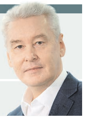
СЕРГЕЙ СОБЯНИН МЭР МОСКВЫ

Дорогие друзья! Сердечно поздравляю вас с Днем российской печати. Москва по праву является медной столицей России. Здесь издаются ведущие национальные газеты, выходят массовые и специализированные журналы, пользуются большой популярностью городские издания с богатой историей. Редакции столичных СМИ задают высокие стандарты качественной прессы и вносят огромный вклад в прумножение лучших традиций отечественной журналистики. Вы стремитесь быть в гуще событий, поднимаете острые темы, помогаете решать насущные проблемы, оперативно освещаете жизнь мегаполиса во всем ее многообразии. Благодаря вам миллионы читателей получают достоверную информацию о самом важном и интересном. Желаю вам, дорогие друзья, крепкого здоровья, благополучия и новых творческих успехов. Пусть 2020 год принесет всем нам много хороших новостей!