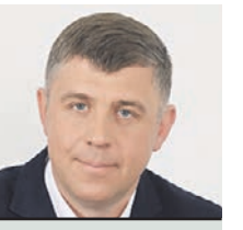
ИВАН ШУБИН РУКОВОДИТЕЛЬ ДЕПАРТАМЕНТА СМИ И РЕКЛАМЫ МОСКВЫ