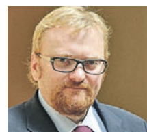
ВИТАЛИЙ МИЛОВ ДЕПУТАТ ГОСУДМУРФ

но при условии того, что будет вынесено соответствующее решение суда. Если законопроект, дающий право отключать телефоны, получит дальнейшее движение, нужно определиться с условиями его реализации. Именно их и будет устанавливать новый подзаконный нормативный акт.