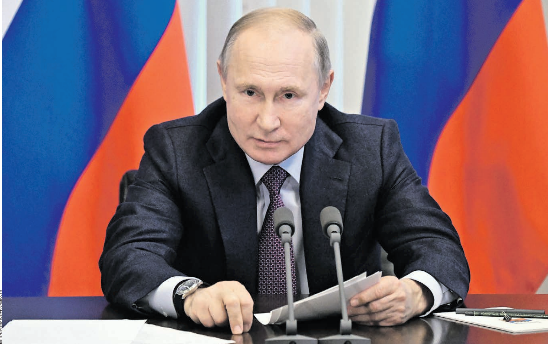
10 января 2020 года. Президент России Владимир Путин проводит совещание по вопросам социально-экономического развития Республики Крым и города Севастополь на территории гостиничного комплекса «Мрия» в Ялте

Мэр Москвы Сергей Собянин в пятницу принял участие в совещании по вопросам развития Крыма и Севастополя, которое проводил в Ялте президент Российской Федерации Владимир Путин.