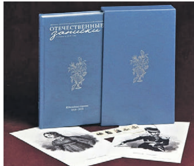
Юбилейное издание журнала «Отечественные записки», выпущенное к его двухсотлетию в 2018 году

Тут сложно не отметить, что бренд «Отечественные записки» — это саморегенирирующий феникс! Вся его история наполнена досадными закрытиями, томительными летаргиями и затем — уже традиционно! — удачными пробуждениями. Выход