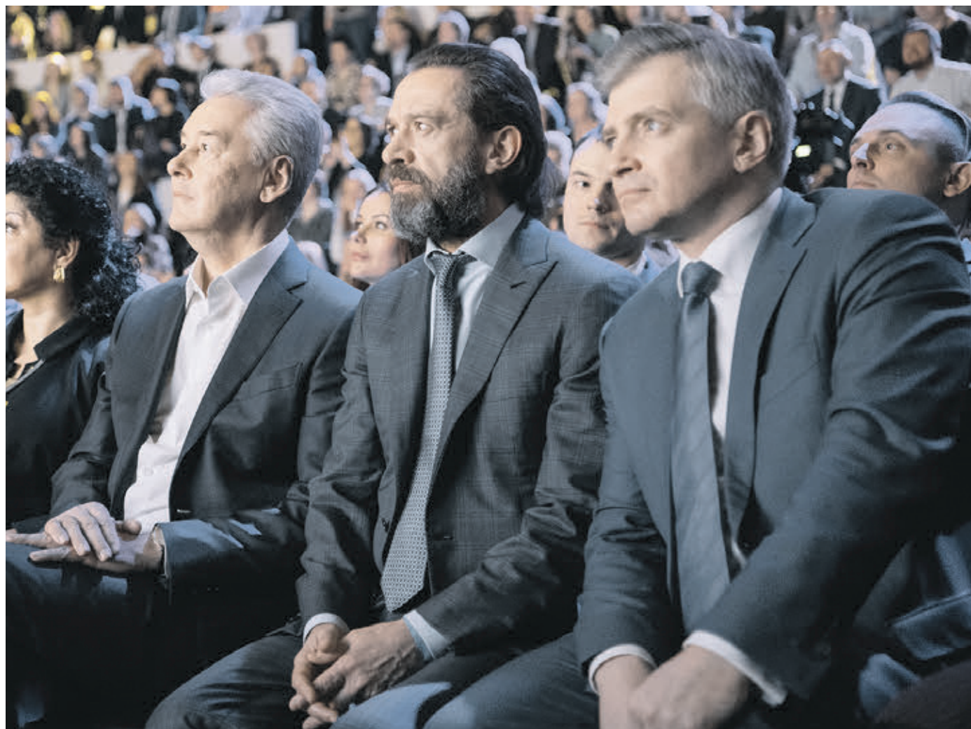
22 марта 15:52 Слева направо: мэр Москвы Сергей Собянин, худрук Театра Олега Табакова Владимир Машков и глава столичного Департамента культуры Александр Кибовский на открытии Московского культурного форума в Манеже

За последние годы визитной карточкой столицы стали ночные культурные акции. В марте проходит «Ночь в театре», в апреле — «Библионочь», в мае — «Ночь в музее», в августе — «Ночь кино», в ноябре — «Ночь искусств». В прошлом году их посетили свыше миллиона человек. — С 1 января прошлого года 70 городских театров перешли на грантовую систему фи-