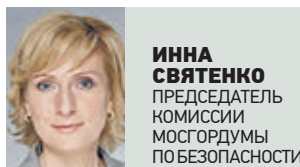
ИННА СВЯТЕНКО ПРЕДСЕДАТЕЛЬ КОМИССИИ МОСГОРДУМУ ПО БЕЗОПАСНОСТИ

Эти средства на электротяге развивают скорость до 60 километров в час, и таких участников движения уже сложно назвать пешеходами. Поэтому сейчас появилась необходимость введения новых нормативных правил. Этот вид транспортного средства необходимо оформлять как отдельные участники дорожного движения. Нужно ограничивать и регулировать скоростной режим электросамокатов и территории, по которой они могут передвигаться. Более того, владельцы электросамокатов должны получать водительские права. Еще один очень важный момент. Выезжая на проезжую часть, владелец самоката не несет никакой ответственности за других участников движения. Соответственно, если во время движения по дороге произойдет столкновение с авто, то по действующим правилам эта авария будет расценена как наезд на пешехода, что не совсем корректно. Именно поэтому необходимо введение форм регулирования электросамокатов. Люди должны ощущать ответственность за совершаемые ими действия. Но решить этот вопрос можно только на уровне федерального законодательства. Двухколесный транспорт появился не только в Москве, и невозможно ввести определенные правила и требовать их исполнения от жителей и гостей города.