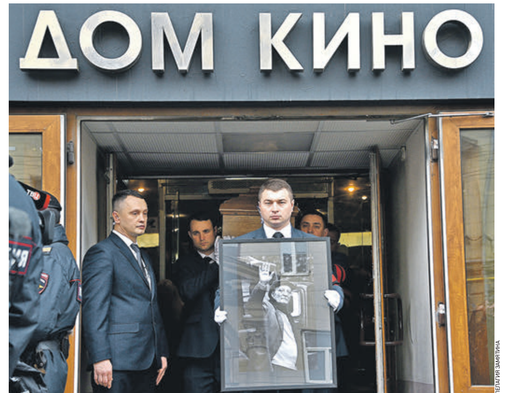
Вчера 13:10 После окончания панихиды в Доме кино. Гроб с телом Георгия Данилии отправился в один из храмов Новодевичьего монастыря, где прошло отпевание режиссера