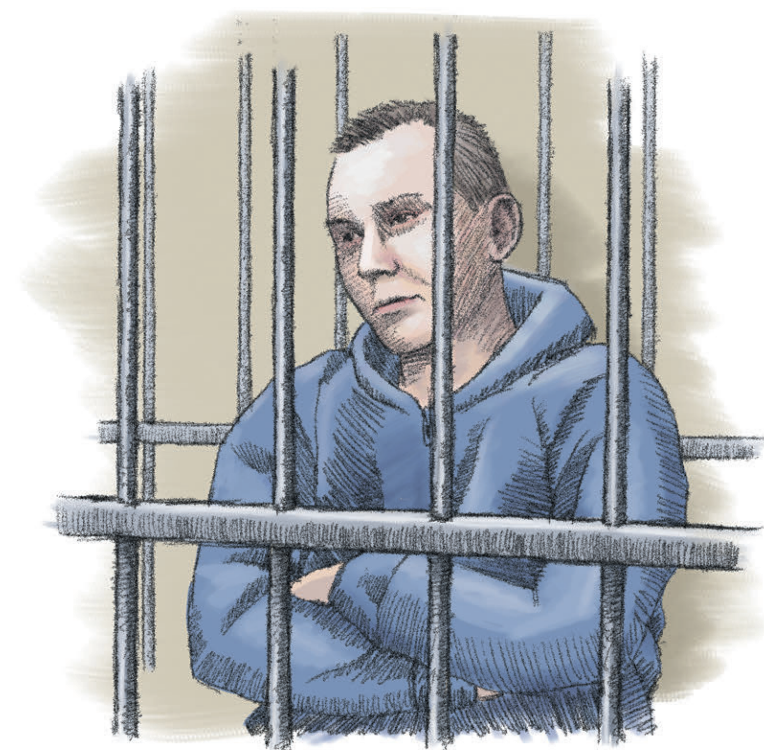
тиры в центре Москвы хватало, по существу, поддельного паспорта и доверенности!

Сегодня появилось «одно окно», информационные технологии и электронный документооборот все ускорили и упростили. Но породили новые, доселе не существовавшие риски. Что и подтверждает наша история: для похищения квар-