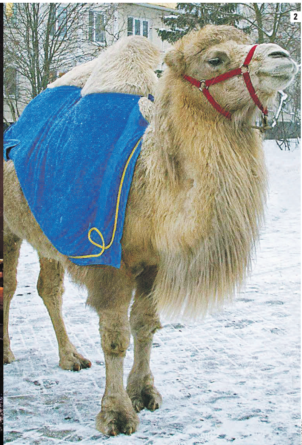
Весь год на этом месте выходила рубрика «Москва красивая». Но накануне грядущих каникул мы решили порадовать читателей, заменив привычную уже рубрику «Москвы волшебной». Ведь каждый год в столице творятся все новые и новые чудеса. Сегодня в Покровском парке москвичам поможет исполнить заветное желание сказочная Жар-птица (1). А в 2015-м на Сиреневом бульваре в Троице катал детишек заколдованный дряквяк-верблюд (2)