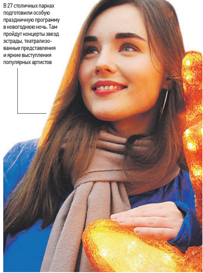
В 27 столичных парках подготовили особую праздничную программу в новогоднюю ночь. Там пройдут концерты звезд эстрады, театрализованные представления и яркие выступления популярных артистов