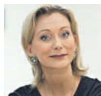
ИРИНА ГИНКЕВИЧ ЗАСЛУЖЕННАЯ АРТИСТКА РОССИИ, БАЛЕРИНА

Каждый раз, когда я выхожу на сцену, — волнуюсь. Вне зависимости от того, в каком городе я танцую. Мои любимые города это Нью-Йорк, Париж и, конечно, Москва. Я выросла в Петербурге, однако столица России меня всегда привлекала и манила. Я помню, как мы в детстве приезжали в Москву на гастроли и на сцене Большого театра я чувствовала себя на своем месте. Здесь совсем другая величина танца и большая энергетика.