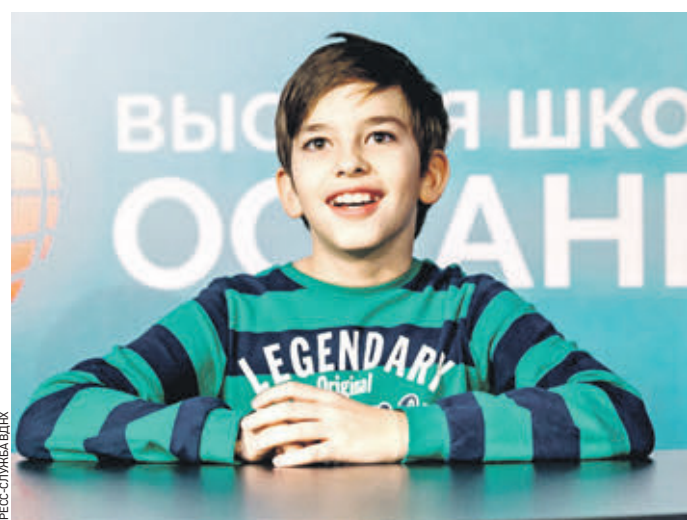
Вчера 12:00 Московский школьник с удовольствием примерил на себя роль ведущего выпуска новостей

Я прихожу за десять минут до начала. Входной зал музея ВДНХ почти пуст.