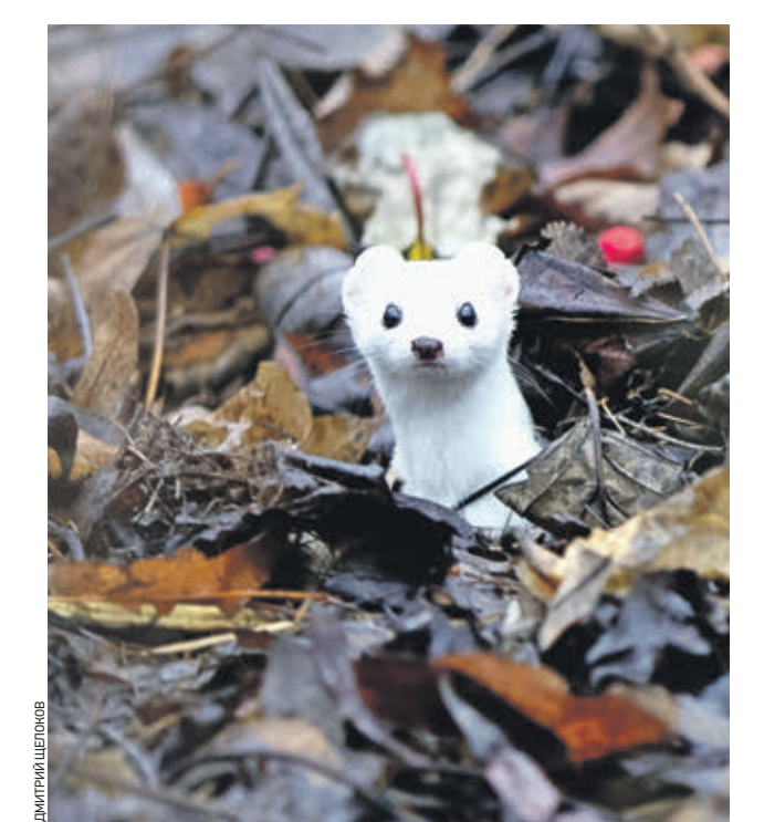
Вчера 11:48 Наши читатели заметили в музее-заповеднике «Царицыно» ласку. Она уже сменила свою шубку с буровато-коричневой на белоснежную, но из-за отсутствия снега не смогла замаскироваться — и теперь выделяется на фоне потемневших опавших листьев. С приходом холодов в столице все чаще можно обнаружить этих животных на природных территориях — их привлекают мелкие грызуны, обитающие рядом с нормушками для птиц.