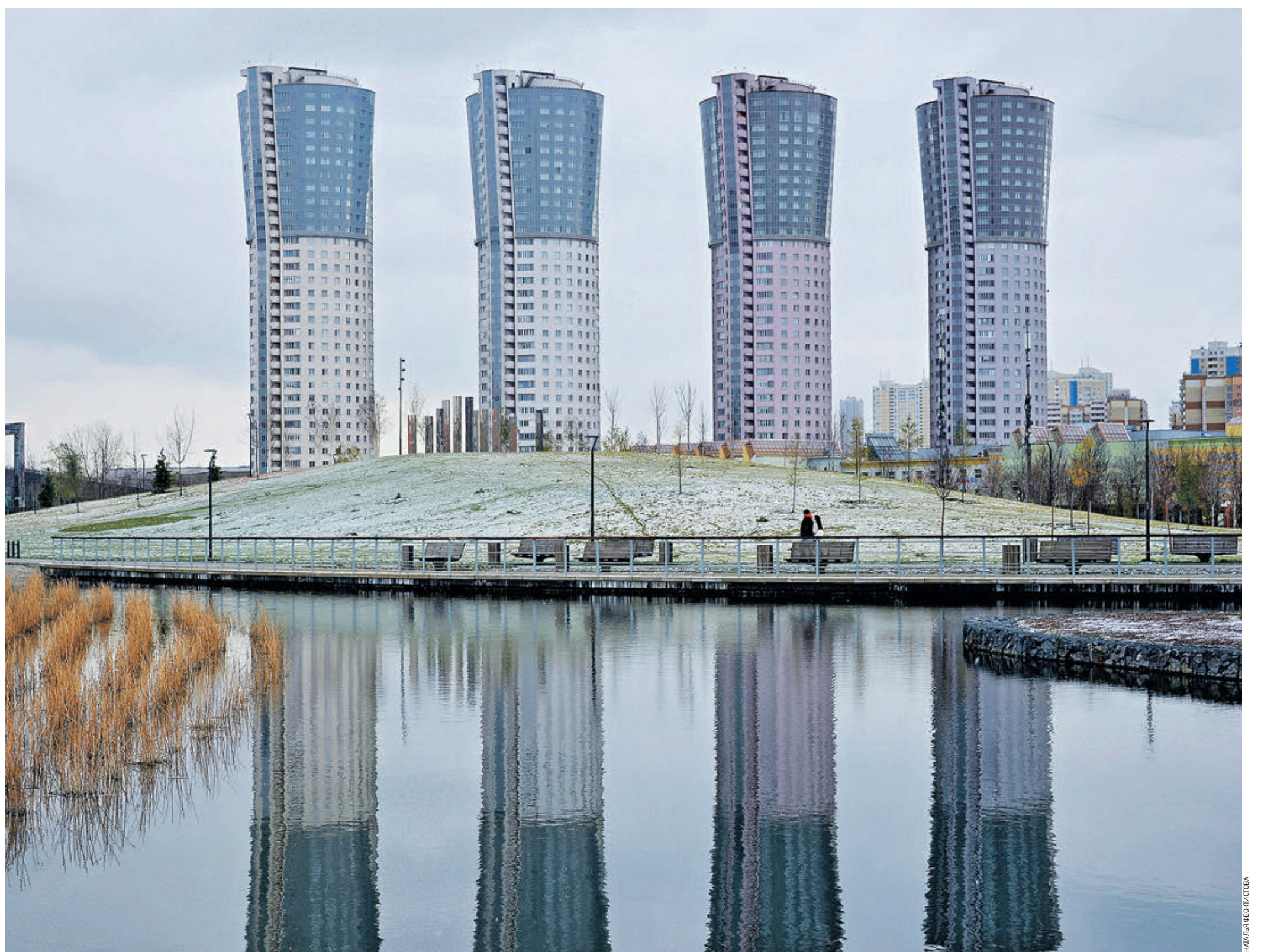
Дыхание зимы коснулось и столицы. Ярко-рыжие и зеленые цвета уходящей осени еще попадают на глаза, но зимних белых тонов с каждым днем становится все больше, а прогулки у Ходынского пруда — короче