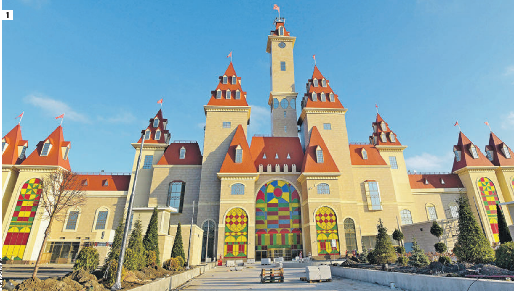
Вчера 13:55 Так выглядит центральный вход в крытый тематический парк развлечений «Остров Мечты» (1) Специалист немецкого концерна Александр Кейс проводит тестирование аттракциона на безопасность его использования (2)

Настала очередь и московского парка развлечений. Здесь, кстати, работы вышли на финишную прямую. На площадке появились аттракционы с известными отечественными и иностранными мультипликационными героями. Первые, между прочим, были специально созданы российскими художниками для проекта «Остров Мечты». — Нам очень приятно работать с «Островом Мечты».