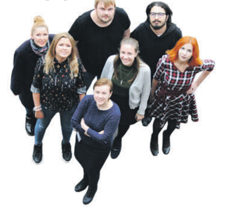
Корреспонденты «ВМ»: ЕВГЕНИЯ ПОПОВА, НИКИТА КАМЗИН, САМЕР МУСТАФА, АННА БАЛЮК, ЮЛИЯ ДОЛГОВА, ДАРЬЯ ПИОТРОВСКАЯ, МАРИЯ ГУСЕВА