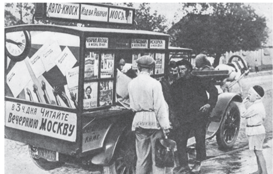
1927 год. В то время «Вечернюю Москву» и другие газеты и журналы, выпускаемые издательством «Рабочая Москва», продавали на улицах в таких вот «автоматических». Судя по надписи на заднем борту фургона, «Вечерняя Москва» поступала в продажу в 15 часов.