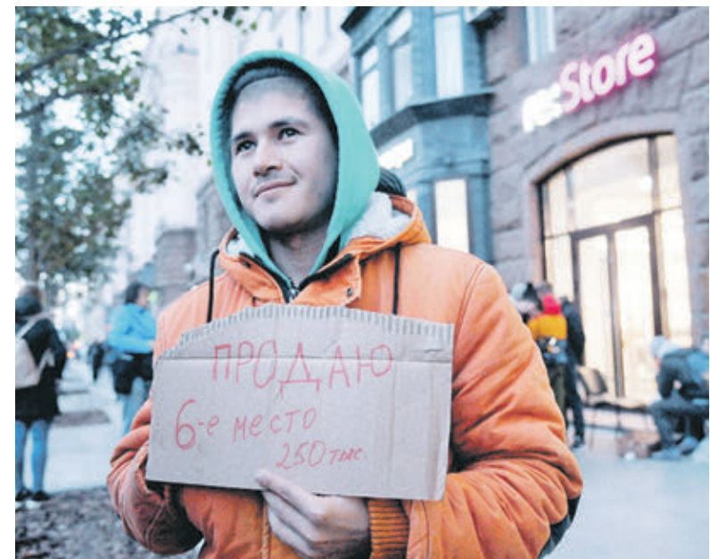
Вчера 14:30 Тверская улица. Перед стартом продаж супермодного гаджета нашлось много жаждущих легкой наживы

14:15 Социальные сети бурлят сильнее обычного. Через пару дней в продаже появятся новые iPhone. Больше, быстрее, дороже преннх. По традиции фанаты этого смартфона за несколько дней до старта продаж выстроились у магазина в предвкушении заветного часа, невзирая на плохую погоду и холод. Корреспондент «ВМ» вместе с ними ждал новинку.