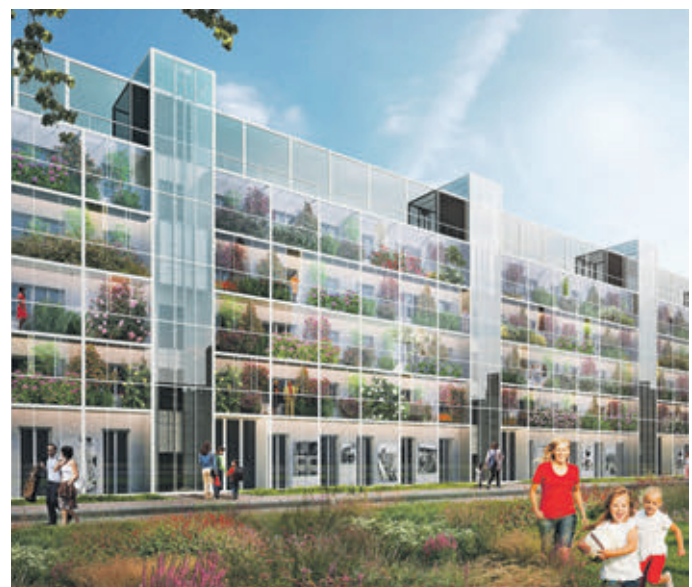
По мнению архитекторов из бюро Speech, так могут выглядеть жилые кварталы в районе Кузьминки

К конкурсу проявили интерес архбюро из Германии, Испании, США, Японии, Украины и многих других стран. В финал вошло всемирно известное британское бюро Zaha Hadid Architects, однако жюри присудило победу другим участникам.