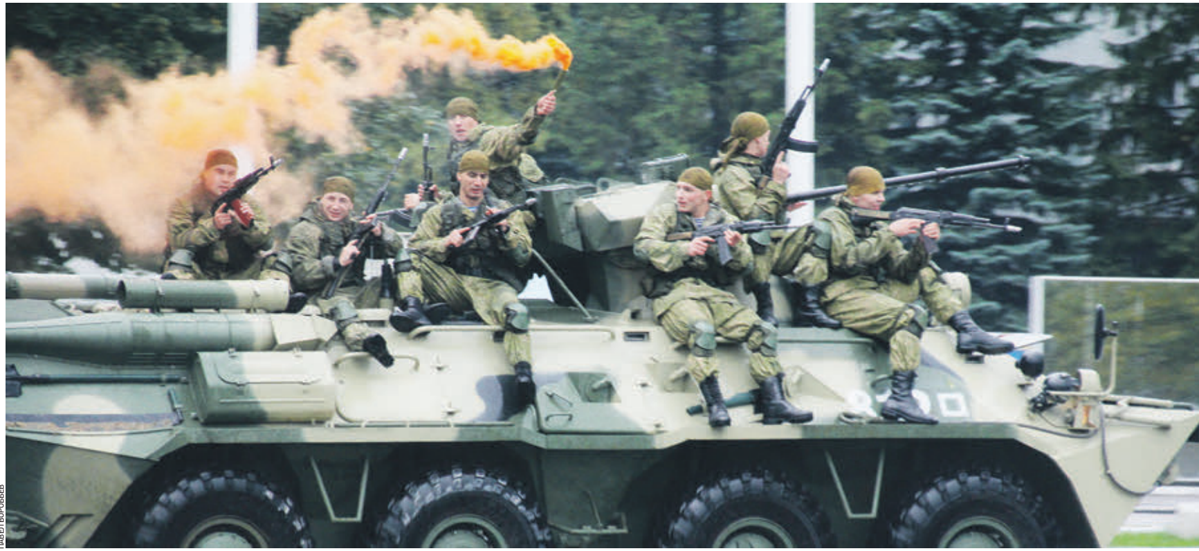
Вчера 09:00 Разведывательная рота 27-й Севастопольской отдельной мотострелковой бригады проводит показательные выступления с использованием бронетехники и спецсредств в поселке Мосрентген

армия Спортивные старты, в которых равны и младшие офицеры, и генералы, открылись на базе 27-й Севастопольской отдельной мотострелковой бригады, что в Мосрентгене.