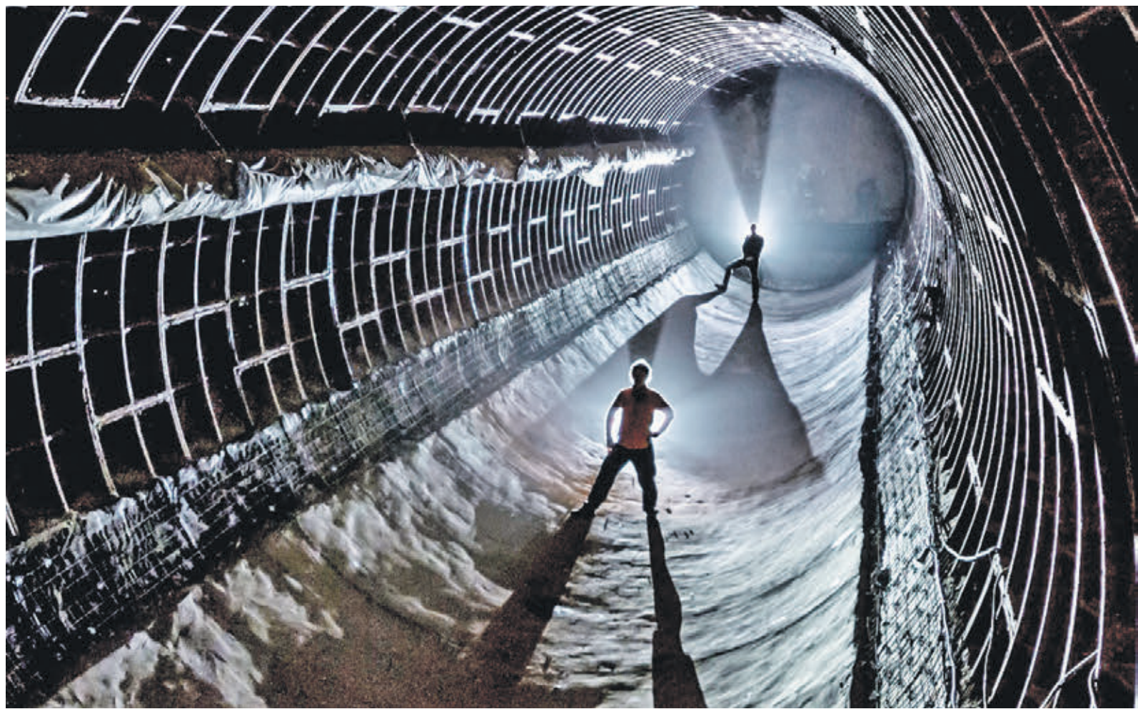
Вчера 13:47 Хранилища бункера № 703 — точь-в-точь тоннели метро. Так они выглядят после незавершенной реконструкции. До 2005 года в них хранились секретные документы, важнейшие международные договоры. На глубине 43 метров их не нашел бы ни один диверсант