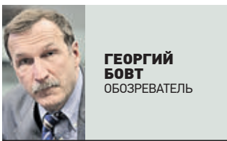
ГЕОРГИЙ БОБТ ОБЪЕДИНИТЕЛЬ

Госдепартамент США объявил о введении новых санкций против России. На сей раз — из-за «дела Скрипалей». Закон предусматривает два этапа введения санкций. Второй наступает через 90 дней после первого, если страна, подвергающаяся санкционному удару, «не исправится». Первый санкционный пакет предполагает полный запрет на экспорт в Россию электронных устройств и комплектующих двойного назначения. Также под эмбарго попадут испытательное и калибровочное оборудование и компоненты систем, разработанных для использования в авиации в качестве бортовой электроники. Эти меры простой обыватель не почувствует. Но вслед за этим, говорит Госдеп, если Россия «не даст твердых гарантий», что не будет использовать химическое или биологическое оружие, будут введены санкции следующего уровня, гораздо более жесткие. Применительно к России ограничительные меры могут подразумевать, по сути, полное прекращение двусторонней торговли, отзыв послов и сокращение до минимума численности сотрудников посольств и консульств. Последнее может привести уже к полной остановке выдачи виз. Может быть приостановлено действие соглашения об авиасообщении, в частности прекращены полеты «Аэрофлота» в США. Штаты могут начать блокировать