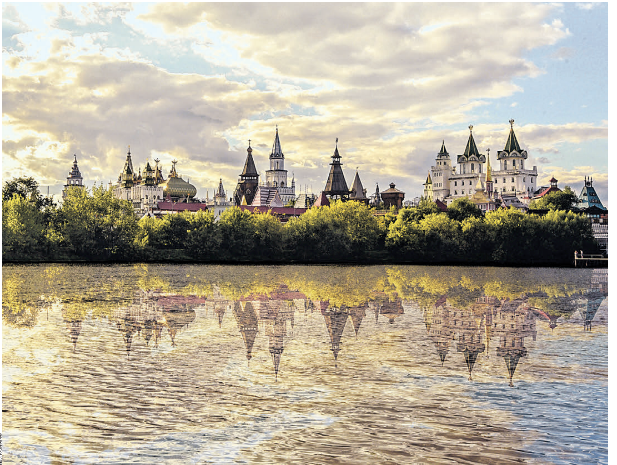
8 августа 18:20 В воде Серебряно-Виноградного пруда отражаются башни сказочного Измайловского кремля, овеянные золотистой дымкой последних солнечных лучей