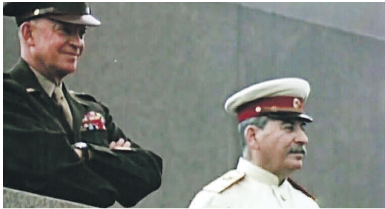
И немного истории. 12 августа 1945 года. За Всесоюзным парадом физкультурников, который проходил на Красной площади, наблюдают лидер СССР Иосиф Сталин и «четырёхзвездный» генерал, командующий союзными войсками в Европе, Дуайт Эйзенхауэр. Это единственный случай, когда президент США (правда, будущий) стоял на трибуне мавзолея рядом с советским вождем. Кстати, в этом году грандиозный спортивный парад в честь Дня физкультурника пройдет 11 августа в спорткомплексе «Лужники».