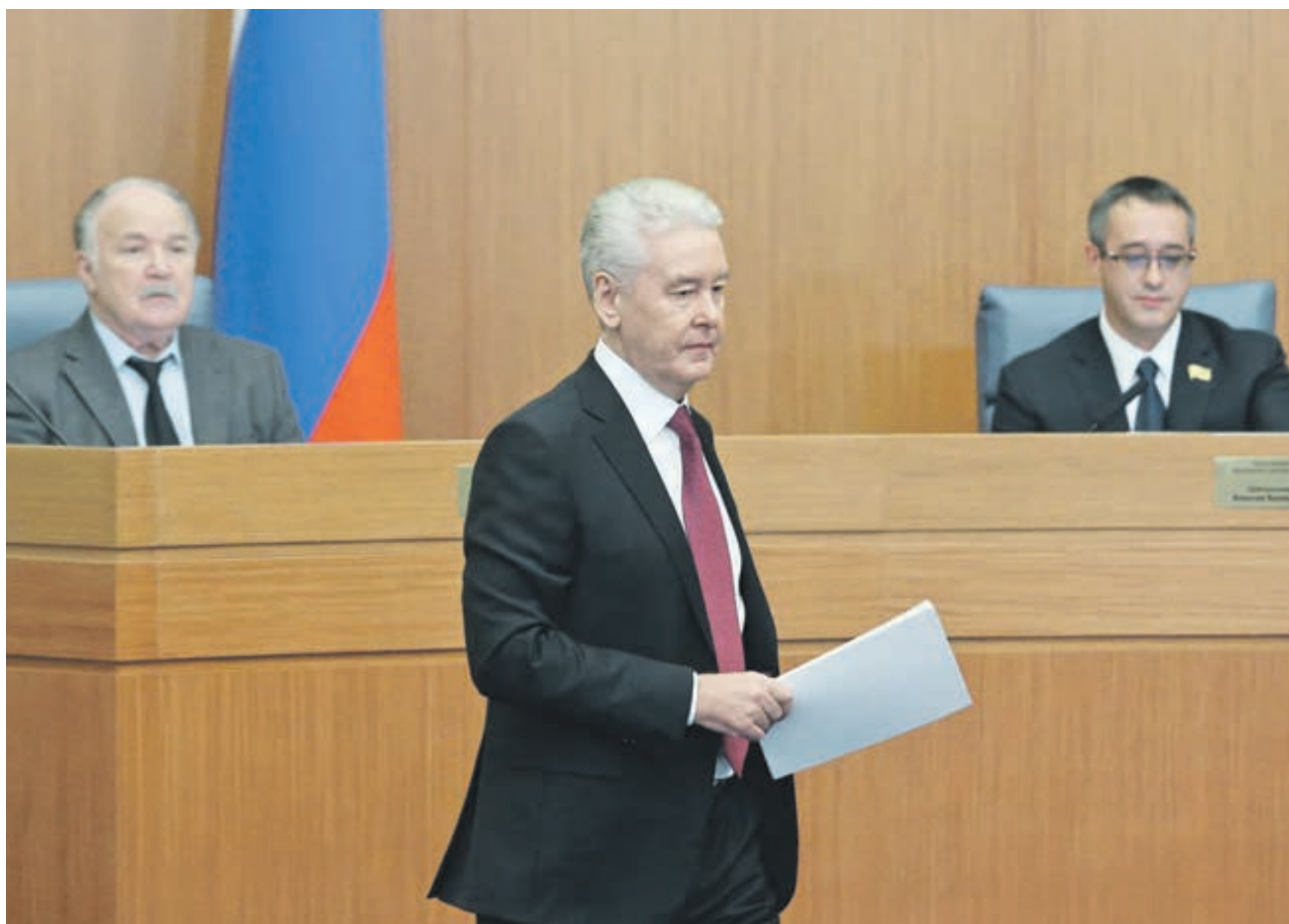
Вчера 12:00 Мэр Москвы Сергей Собянин во время ежегодного отчета о работе столичного правительства в Мосгордуме. Среди участников заседания — председатель городского парламента Алексей Шапошников (справа на втором плане) и его заместитель Николай Губенко