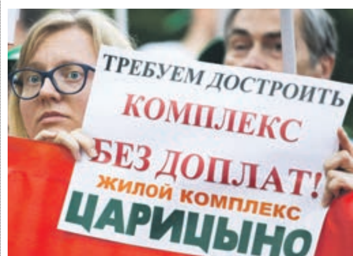
25 июля 2017 года. Парк «Сокольники». Участники митинга обманутых дольщиков требуют достройки ЖК «Царицыно» без доплат

Участники Экспертного совета по строительству, промышленности строительных материалов и проблемам долевого строительства утвердили пакет поправок в действующее законодательство, призванных еще надежнее защитить права дольщиков. «ВМ» попыталась разобраться в законодательной новации. Одним из инициаторов поправок выступил депутат Госдумы, советник мэра Москвы Владимир Ресин. Вчера в России начал работать Фонд защиты прав дольщиков.