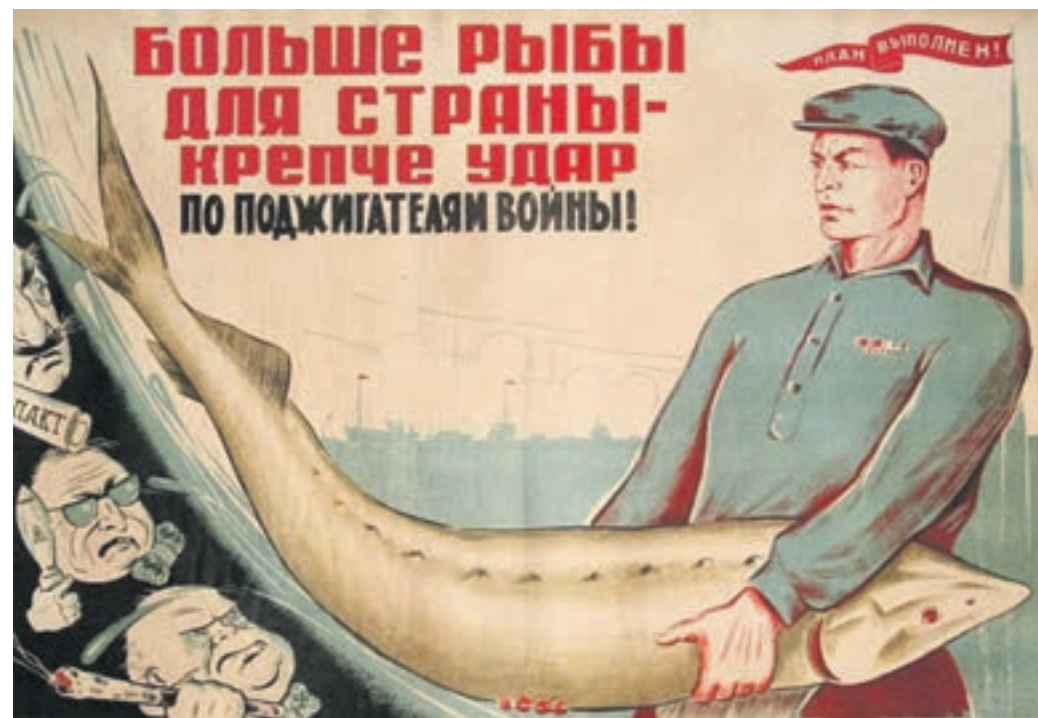
Советский плакат (1950). Завалить прилавки рыбой удалось лишь 20 лет спустя — в 1970-е годы

К 1970-м годам в СССР стал ощущаться дефицит мяса. Дело не только в огрехах планового хозяйства. Потребность постоянно увеличивалась — население росло, приучалось к современным нормам питания (мало кто согласился бы есть мясо только по праздникам, как до революции). Попытка с этим спросом было действительно трудно. А вот для рыболовного промысла 1970-е годы как раз были золотым временем — появились большие океанские траулеры. Вот и решили обратить вни-