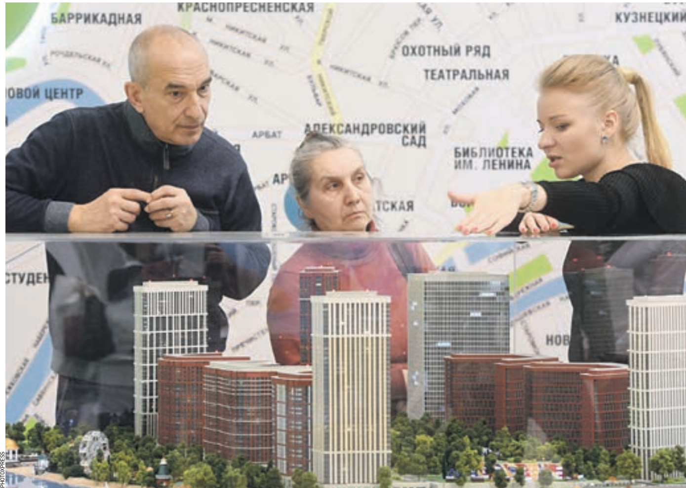
16 июля 2017 года. Центральный дом художника. Посетители ярмарки «Недвижимость от лидеров» рассматривают проекты новостроек, представленные компаниями-участниками