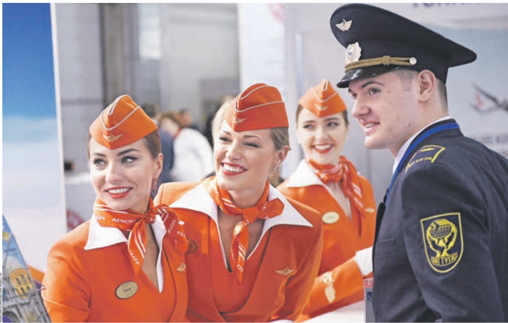
8 февраля 2017 года. Стюардессы представляют стенд своей авиакомпании на Национальной выставке инфраструктуры гражданской авиации NAIS 2017, проходившей в Москве. Коммуникабельности и целеустремленности им не занимать, а значит, и продвижения по службе ждать недолго