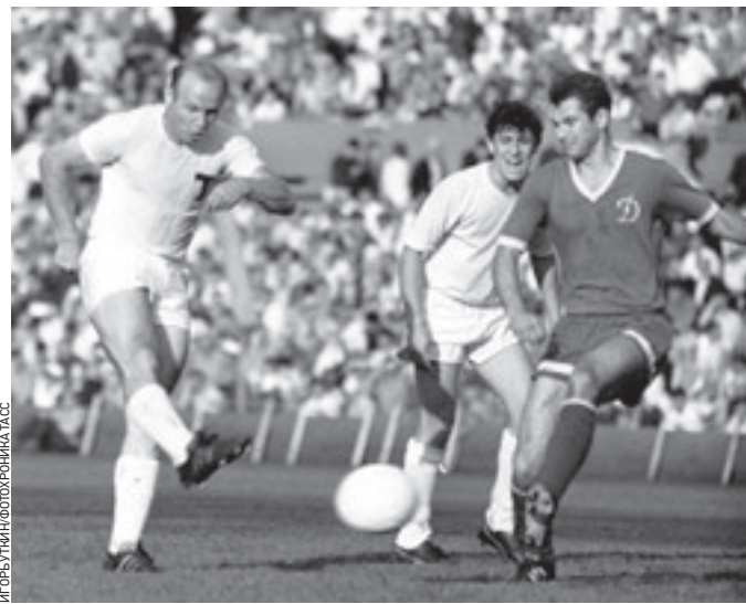
1 января 1987 года. Эдуард Стрельцов (слева) во время матча на первенство страны «Торпедо» — «Динамо»

В пятницу, 21 июля, исполнилось бы 80 лет легендарному футболисту московского «Торпедо» и сборной СССР Эдуарду Стрельцову. В этот день в память о советском нападающем на стадионе, носящем его имя, прошел товарищеский матч, на котором побывал корреспондент «ВМ».