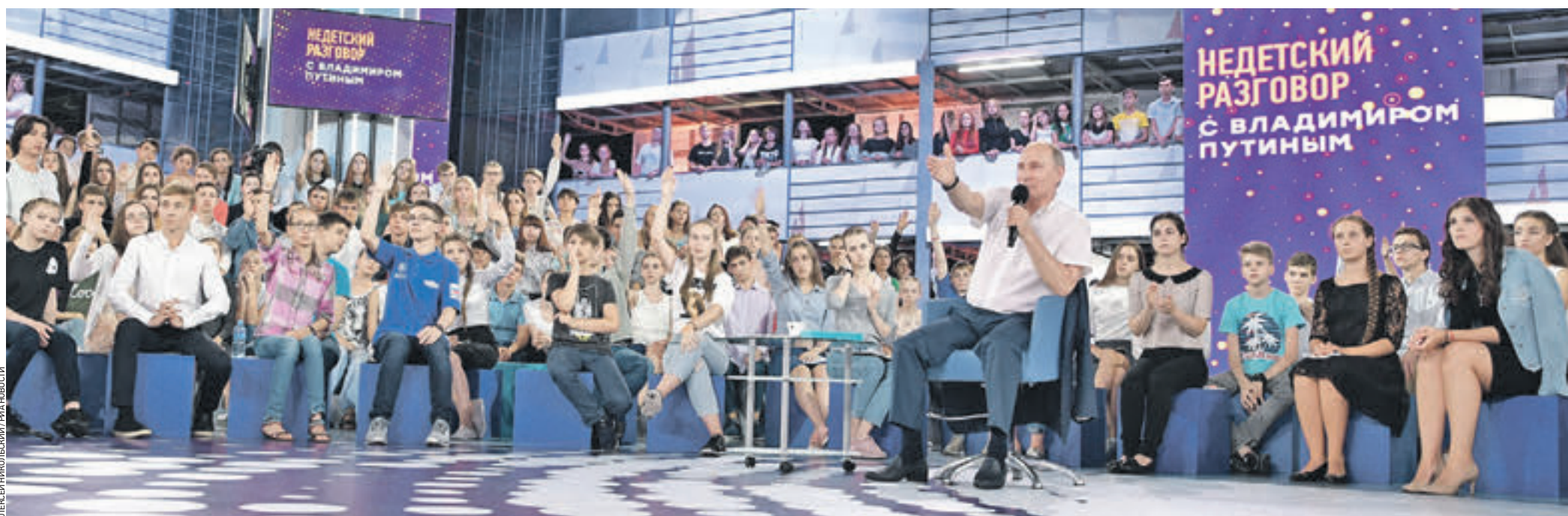
21 июля 2017 года. Президент РФ Владимир Путин (на фото в центре) встретился с учениками образовательного центра для одаренных детей «Сириус» в Сочи. В ходе разговора он открыто ответил на вопросы ребят об образовании, науке и личной жизни

Стр. 1 → Анонимный вопрос: Чем вы собираетесь заняться после того, как уйдете с поста президента?