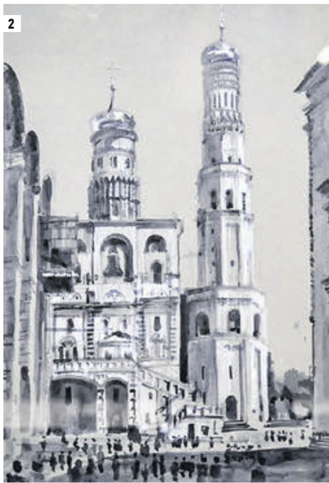
20 июля 18:34 Главный архитектор Москвы Сергей Кузнецов с женой Ириной и сыновьями Всеволодом (в центре) и Евгением на церемонии открытия выставки (1) Аварель колокольни Ивана Великого в Москве, 2012 год (2)