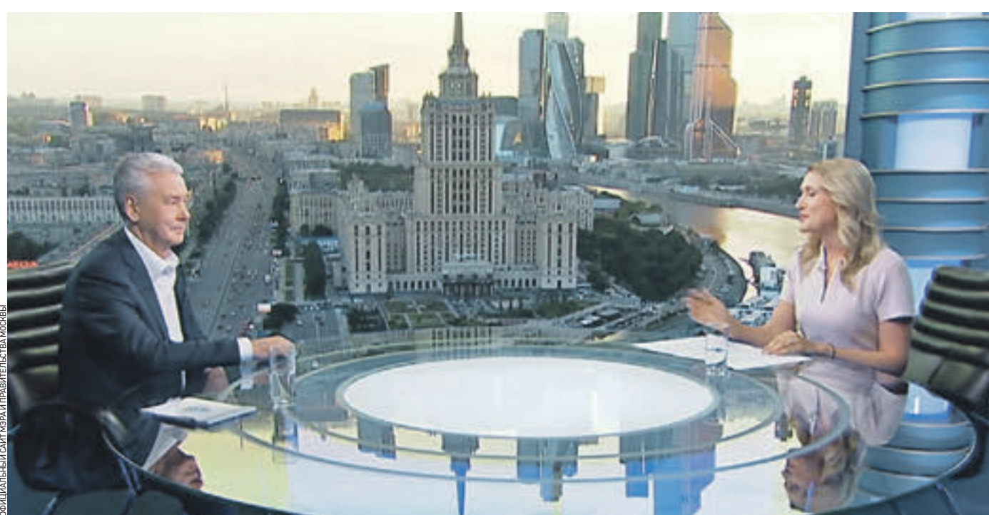
20 июля 2017 года. Мэр Москвы Сергей Собянин в студии телеканала «ТВ Центр» отвечает на вопросы, которые прислали жители столицы. Интервью с мэром в формате прямого диалога провела корреспондент телеканала Евгения Карих

Как показывает практика, после расширения тротуаров движение и пропускная способность дорог не ухудшаются. Ведь площадь тротуаров увеличивается за счет выравнивания количества полос.