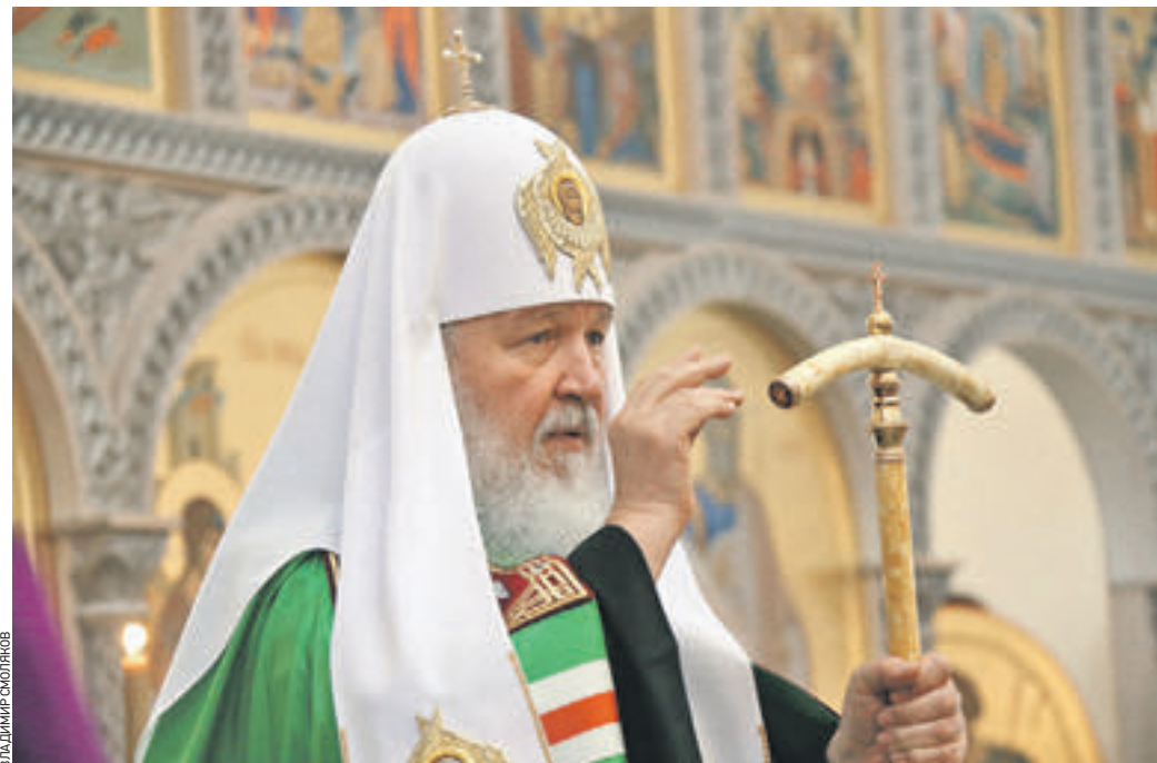
Вчера в 10:25 Патриарх Московский и всея Руси Кирилл совершил обряд великого освящения храма Живоначальной Троицы в городе Троицке, благословил многочисленных прихожан

Вчера Святейший Патриарх Московский и всея Руси Кирилл возглавил освящение храма Живоначальной Троицы в Троицке.