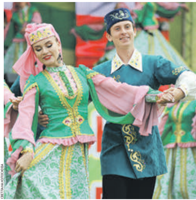
Вчера 11:25 На главной сцене Сабантуя в «Коломенском» выступали национальные творческие коллективы