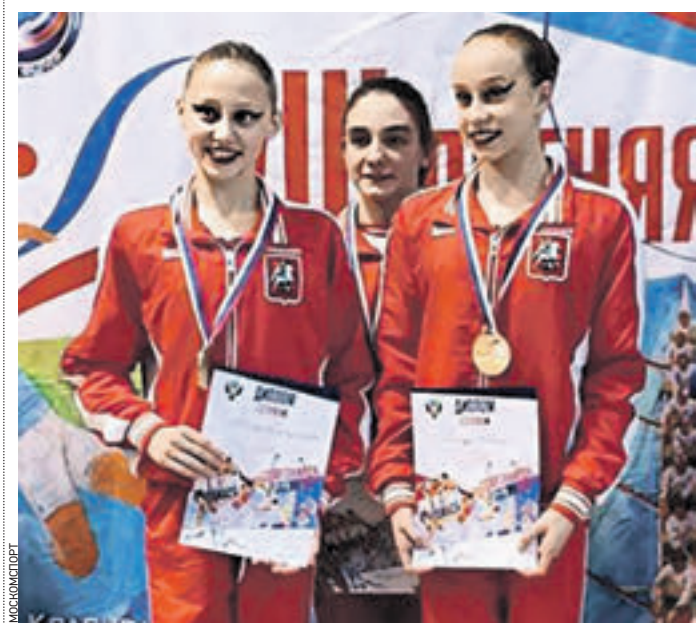
Команда спортсменок из Москвы взяла первое место в соревнованиях по синхронному плаванию в Ростове-на-Дону