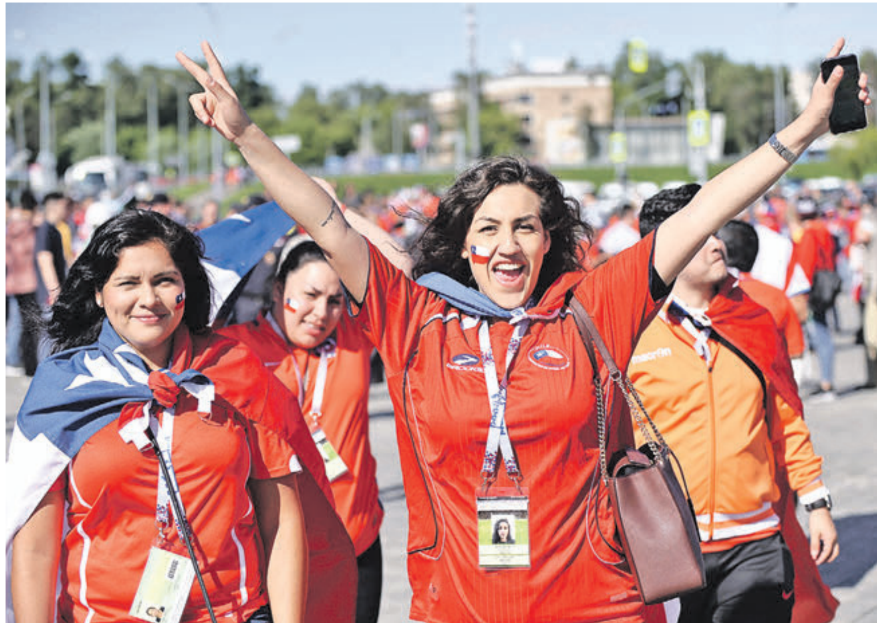
27 июня 11:30 Столица в дни проведения матча Кубка конфедераций-2017 примет около 70 тысяч болельщиков из стран, команды которых участвуют в турнире. А в следующем году на чемпионат мира в Москву приедет еще больше футбольных фанатов