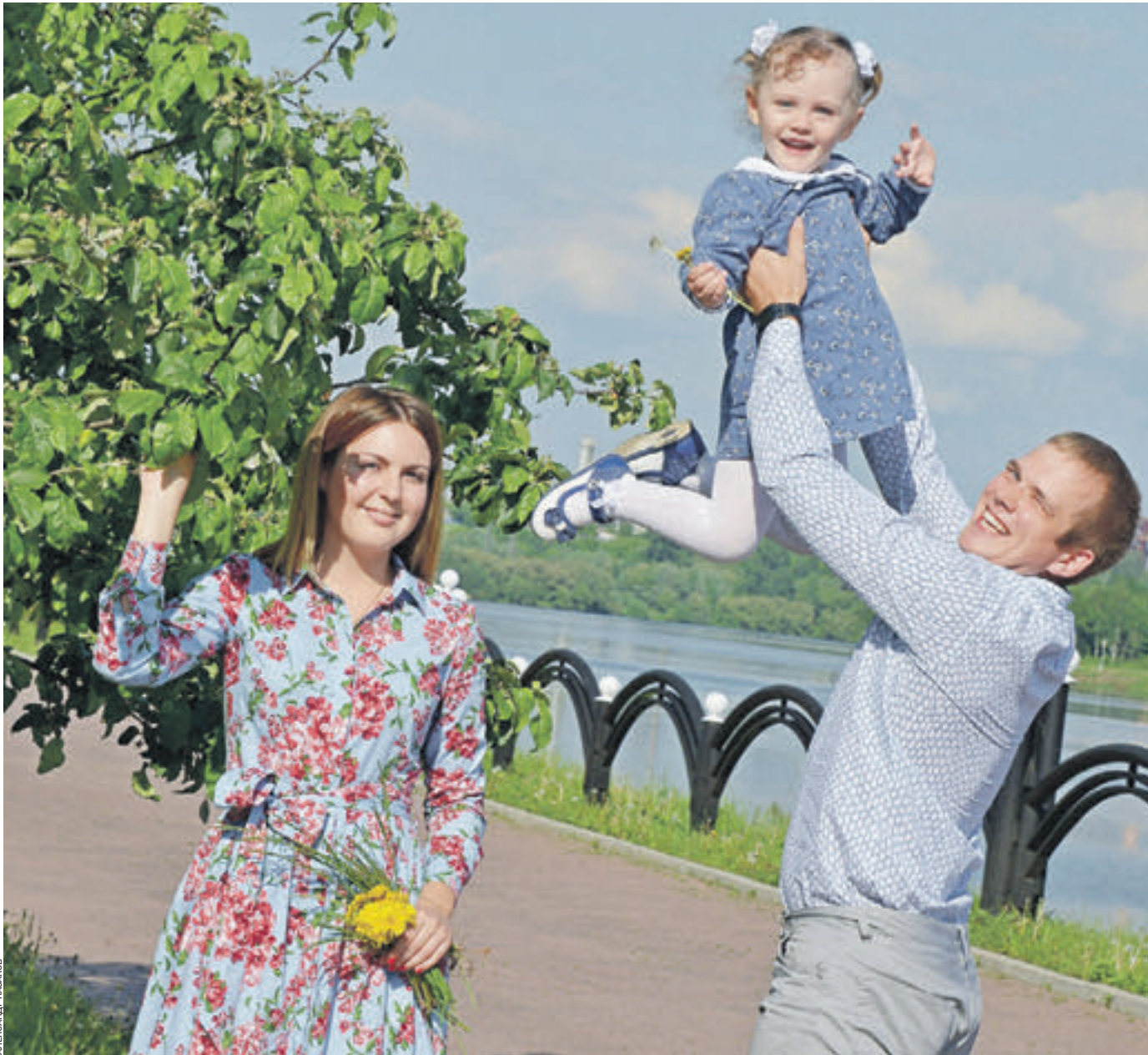
8 июля 2016 года 13:45 День памяти святых Петра и Февронии, который стал отмечаться как День семьи, любви и верности, становится все более популярным. Московские семьи в этот день принимают участие в многочисленных праздничных мероприятиях