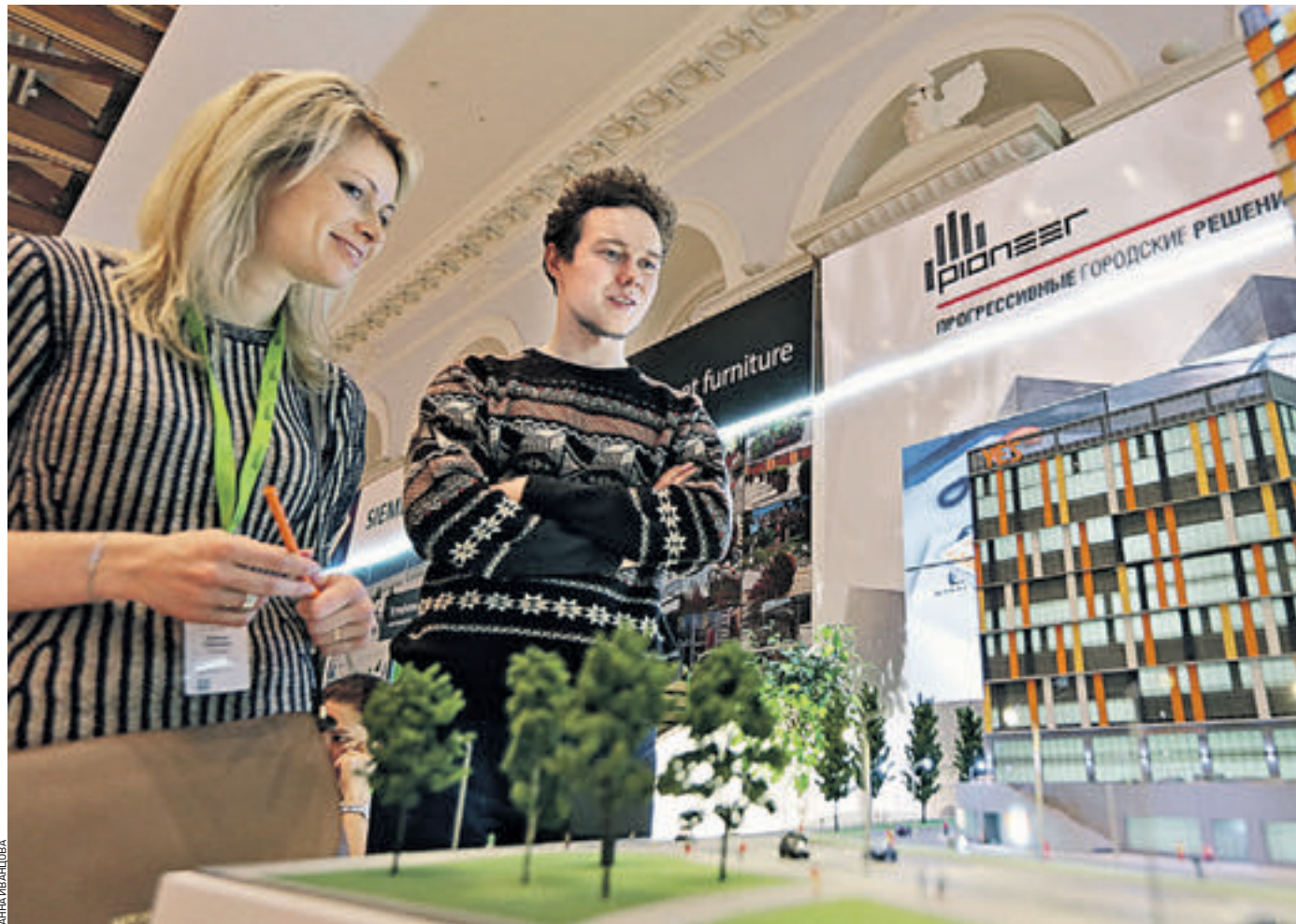
30 июня 2016 года 11:50 Посетители Московского урбанистического форума узнавали о самых крупных градостроительных проектах: строительстве жилья, новых станциях метро, стадионе «Лужники», парке «Зарядье» и многих других объектах столицы

— Впервые мы замахнулись на беспрецедентный масштаб конгресса. В этом году Moscow Urban Forum включает в себя не только деловую программу, на которые съедутся мэры крупнейших мегаполисов и представители мирового бизнес-сообщества, но также самую крупную в России деловую выставку и городской фестиваль, который объединит более 20 культурных площадок Москвы, — рассказал Денис Бойков «ВМ». — Тема форума этого года — «Эпоха агломераций. Новая карта мира» — инициирует диалог Москвы и мирового сообщества о развитии глобальных мегаполисов. Фестивальные мероприятия растянутся на неделю, с 6 по 12 июля. Что важно — посетить выставку,