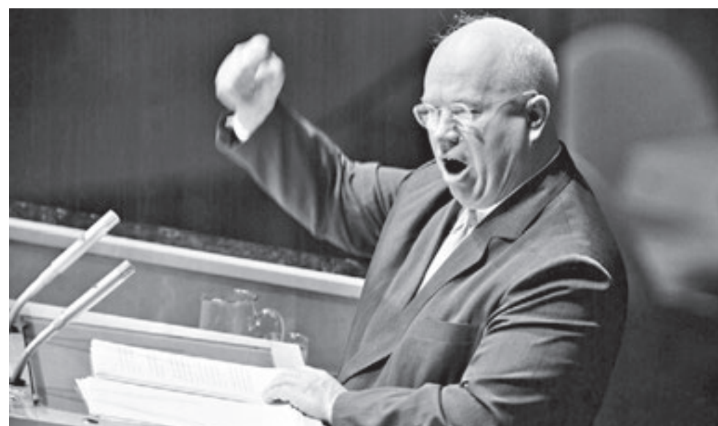
23 сентября 1960 года. Первый секретарь ЦК КПСС Никита Хрущев выступает на Генеральной ассамблее ООН в Нью-Йорке в присущей ему эмоциональной манере

— Мы можем говорить, что в 1957 году Хрущев предпринял попытку полностью реформировать всю модель управления страной. Полностью ему удалось этого добиться к 1961 году. Он переместил центр экономического руководства страной из Совета министров в Центральный комитет, тем самым полностью уничтожив сталинскую модель управления. Министры были «хребтом» управления хозяйственной