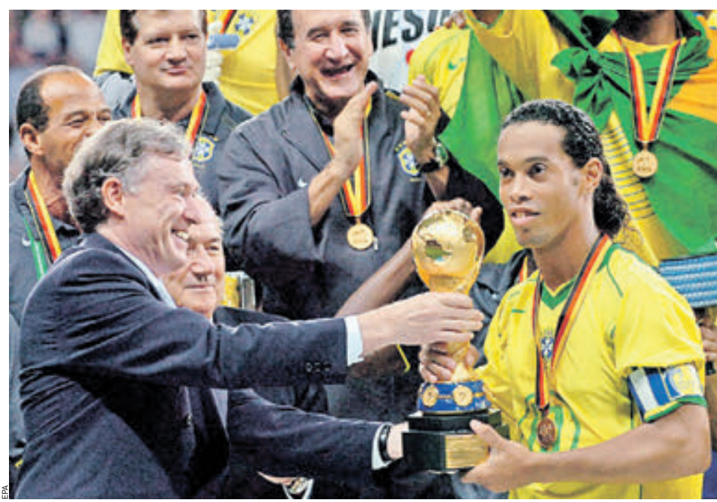
29 июля 2005 года. 20:30 Президент Германии Хорст Келер вручает Кубок конфедераций-2005 капитану сборной Бразилии Роналдиньо