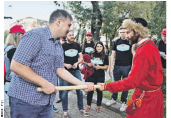
6 сентября 16:30 Команды первого исторического городского квеста на Петровке вспомнили древнюю игру — кто отнимет березовый спил