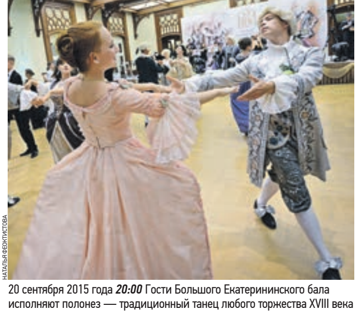
20 сентября 2015 года 20:00 Гости Большого Екатерининского бала исполняют полонез — традиционный танец любого торжества XVIII века

* В заголовке использованы слова песни «Диалог у новогодней елки»