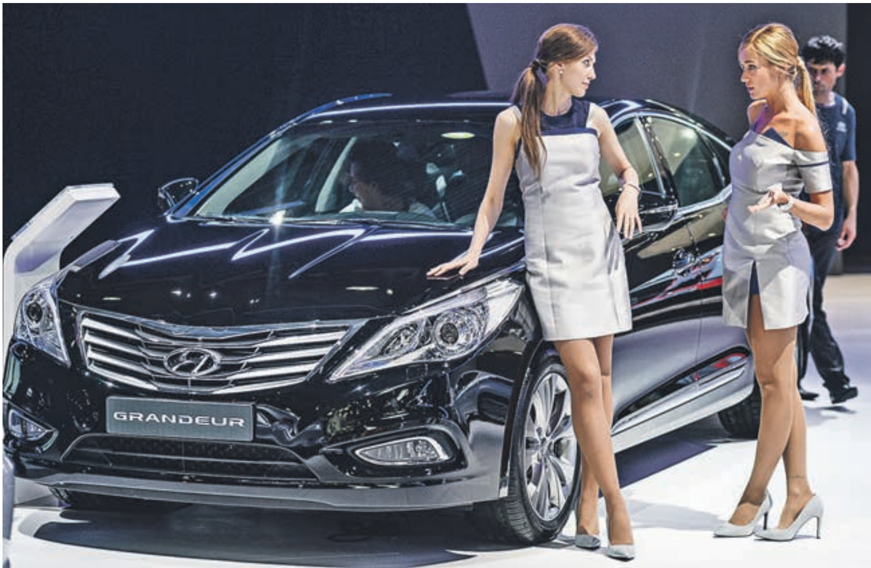
29 августа 2014 года. 17-й Московский международный автосалон. Корейские автопроизводители традиционно привозят в Россию все свои премьерные модели

ПРЕМЬЕРЫ В этом году Московский международный автосалон будет менее представительным, чем двумя годами ранее. Выросшие курсы валют сыграли свою роль. Но стенды пустовать не будут.