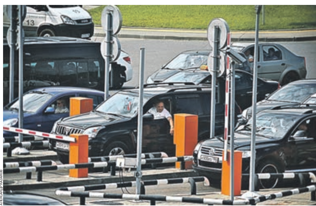
28 июля 2016 года. Парковка у аэропорта «Домодедово». Стоять бесплатно можно только первые 15 минут, но водители нередко в это время не укладываются

Я ЗАСЕК ВРЕМЯ. РОВНО ЧЕРЕЗ 10 МИНУТ ВЫЕЗЖАЮ, А НА ШЛАГБАУМЕ ПОКАЗЫВАЕТ ВРЕМЯ БОЛЬШЕ 15 МИНУТ!