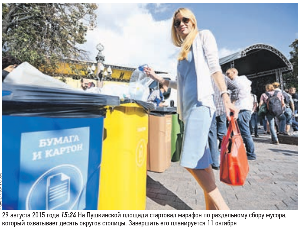
29 августа 2015 года 15:24 На Пушкинской площади стартовал марафон по раздельному сбору мусора, который охватывает десять округов столицы. Завершить его планируется 11 октября