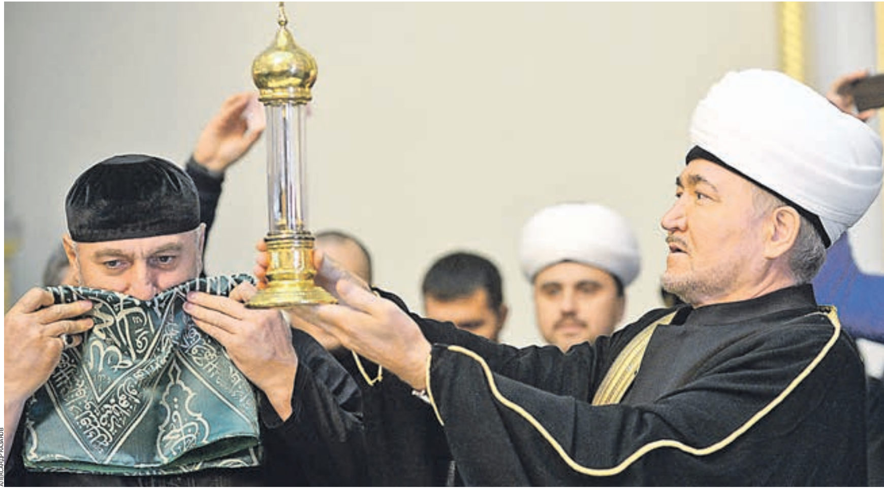
Вчера 18:49 Председатель Совета муфтиев России Равиль Гайнутдин (на фото справа) привез в Московскую соборную мечеть капсулу с волосом пророка Мухаммеда. Впервые за всю историю ислама в России величайшая мусульманская реликвия будет постоянно храниться в столице страны

Прихожане стали собираться примерно за час до момента прибытия ковчега. Еще идут приготовления к важному для мусульман столицы событию. Вот расстилают зеленую дорожку, по которой в мечеть внесут реликвию.