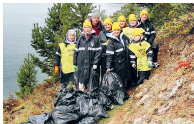
Сохранение окружающей среды для будущих поколений — неотъемлемая часть корпоративной культуры НК «Роснефть».

«Роснефть» стала единственной российской нефтегазовой компанией, получившей в 2021 году статус лидера в области устойчивого развития и включенной в состав участников глобальной инициативы Global Compact LEAD за неизменную приверженность Глобальному договору ООН и десяти принципам ответственного бизнеса