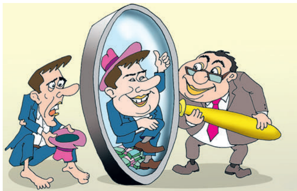
ИЛЛЮСТРАЦИЯ САРИСАТУРА. RU

Отметим, что в 2021 году, когда пандемия коронавируса в России в основном прошла, а СВО еще не началась, отечественная экономика показала самый значительный с 2008 года рост ВВП – 4,7%. Поднялись тогда и реальные денежные доходы населения – в среднем на 3,1%. Через год оба