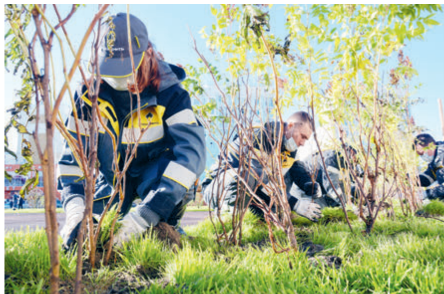
Компания вносит значительный вклад в поглощение выбросов парниковых газов лесами, высаживая деревья в регионах своей деятельности.

инициативы, способствующие переходу к экономике замкнутого цикла. Вторичное сырье на предприятиях «Роснефти» собирают в специальные контейнеры, которые установлены во всех административных зданиях. Затем бумагу измельчают и направляют на заводы для вторичного использования.