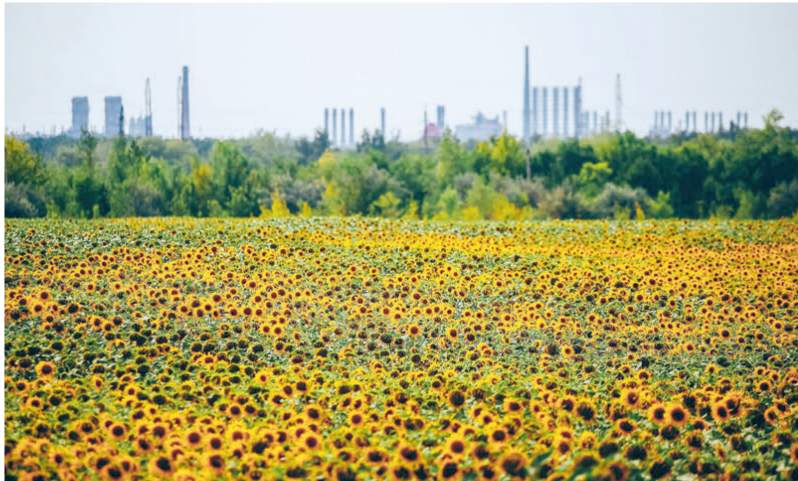
Экологические цели «Роснефти» предусматривают минимизацию воздействия на окружающую среду.

«Роснефть» регулярно внедряет производственную деятельность