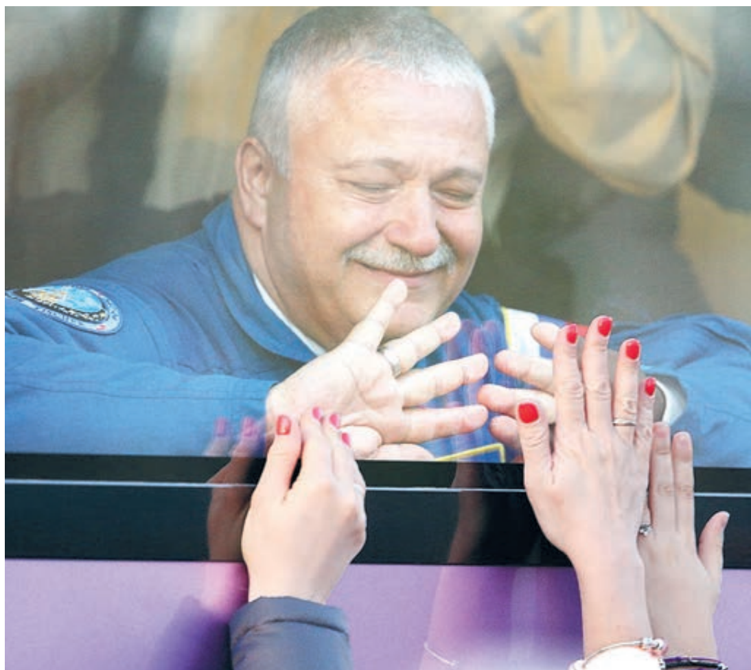
2017 год. Федор Юрчихин на космодроме Байконур.

Сегодня летные испытания планируются на 2023–2024 годы. Но есть большие сомнения, что за предстоящие три года удастся изготовить корабли для летных испытаний. Да и испытательная база у нас оставляет желать лучшего. Вот недавно сообщалось, что инженеры «Энергии» протестировали канатно-спусковое устройство для корабля «Орел». Где проходило тестирование? В Центре подготовки кадров и развития новых технологий Завода экспериментального ма-