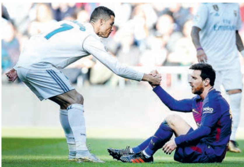
Два лучших футболиста современности не так-то часто встречаются на поле.

Итак, Лиссабон. А ведь поначалу были разговоры о Москве... Как пишет немецкая пресса, готовность провести престижный мини-турнир выражали также Франкфурт и Мадрид. Но последний отпал сразу: уровень пандемии в испанской столице еще высок, УЕФА не может закрыть глаза на печальный опыт состоявшихся в марте четырех игр 1/16 ЛЧ. Тогда после матча «Аталанта» – «Валенсия» оказались инфицированными сразу девять игроков и сотрудников испанской команды. А игра «Ливерпуль» – «Атлетико», по мнению медиков, стала причиной