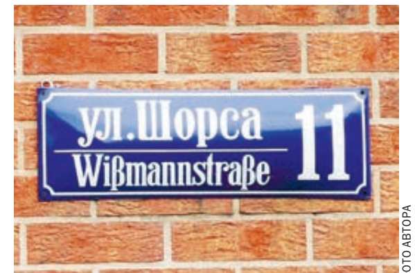
С некоторых пор в Калининграде на домах стали появляться таблички с названиями улиц «по-кенигсбергски».

В ходе проверки в городской прокуратуре установили, что размещенный на особняке знак адресной информации не соответствует фактическому наименованию улицы. В связи с выявленными нарушениями федерального законодательства прокурор Калининграда направил исковое заявление в суд. Иск удовлетворен. Теперь гражданин обязан привести уличную табличку в соответствие с установленными требованиями. Ну или попытаться обжаловать решение.