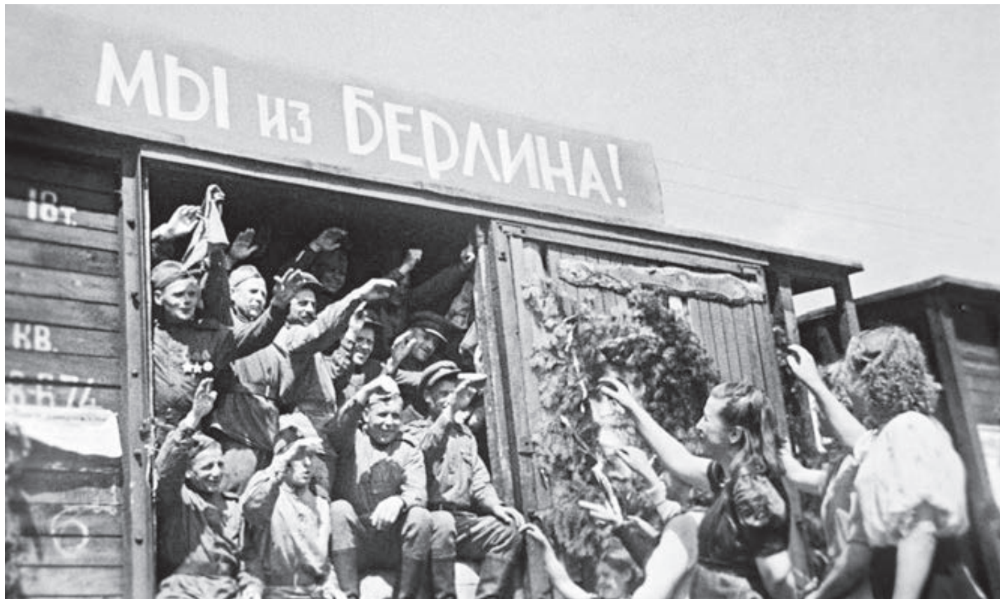
1945-й и 1941-й. Так они к нам шли и так мы от них ехали...

В качестве военных трофеев перед падением на СССР немцам достались и активно использовались различные виды вооружений. Из 28 танковых дивизий, подготовленных для первого удара по СССР, восемь были вооружены трофейными ан-