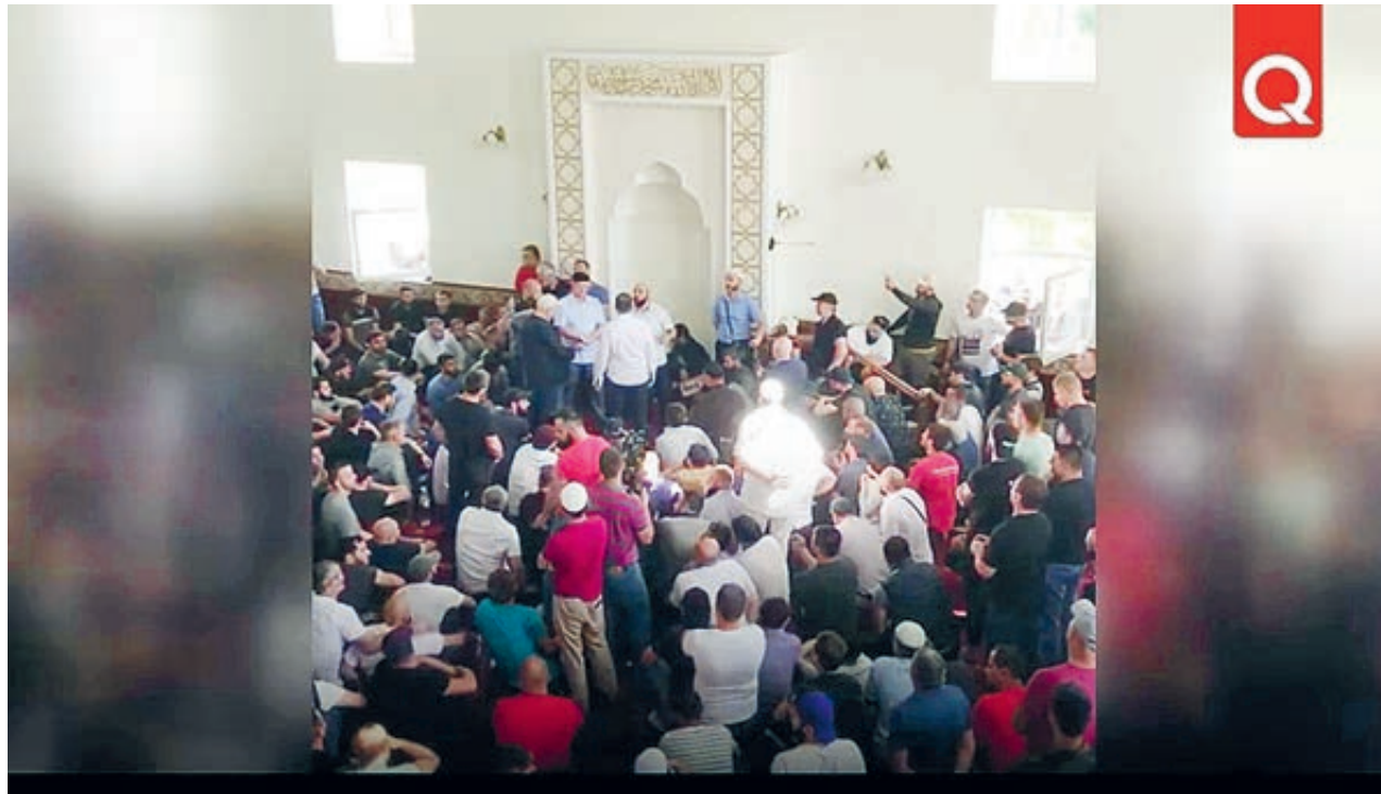
Суд в Крыму. И никто не вспоминает о сущей мелочи – Уголовном кодексе РФ...