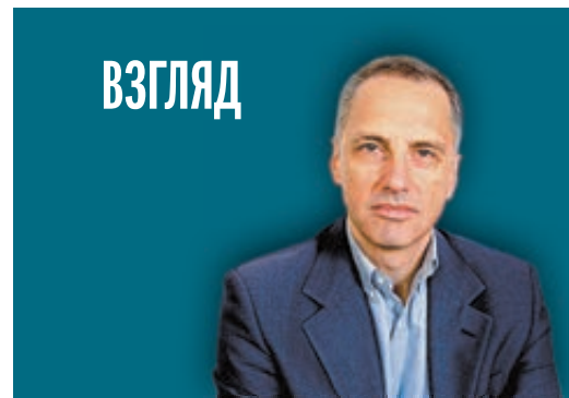
ОЛЕГ ШЕВЦОВ ПОЛИТИЧЕСКИЙ ОБОЗРЕВАТЕЛЬ