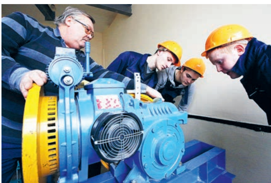
Кто бы мог подумать? Рабочие специальности входят в моду.

Не лучше ситуация в среднем профессиональном образовании (СПО).