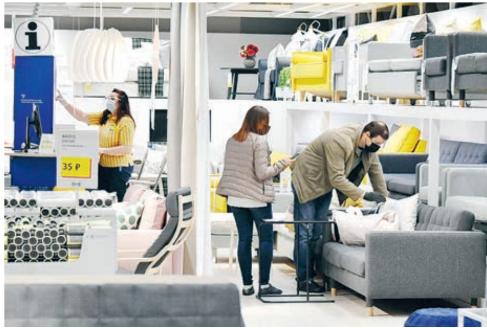
В магазинах ИКЕА, как всегда,людно.