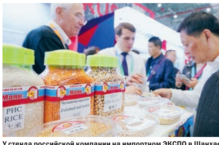
У стенда российской компании на импортном ЭКСПО в Шанхае в 2018 году. На выставке представлены самые разные продукты из многих стран мира.