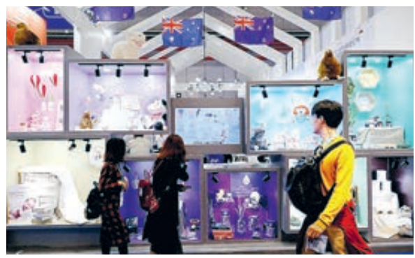
Неизменный интерес посетителей Первого Китайского международного импортного ЭКСПО вызывали бытовые товары.

30 июля в Китае вступили в силу пересмотренные негативные списки по доступу иностранных инвестиций на китайский рынок, что продемонстрировало большую открытость в таких секторах, как услуги, обрабатывающая и горнодобывающая промышленность. Это позволяет иностранным инвесторам владеть контрольным пакетом акций или стопроцентными акция-