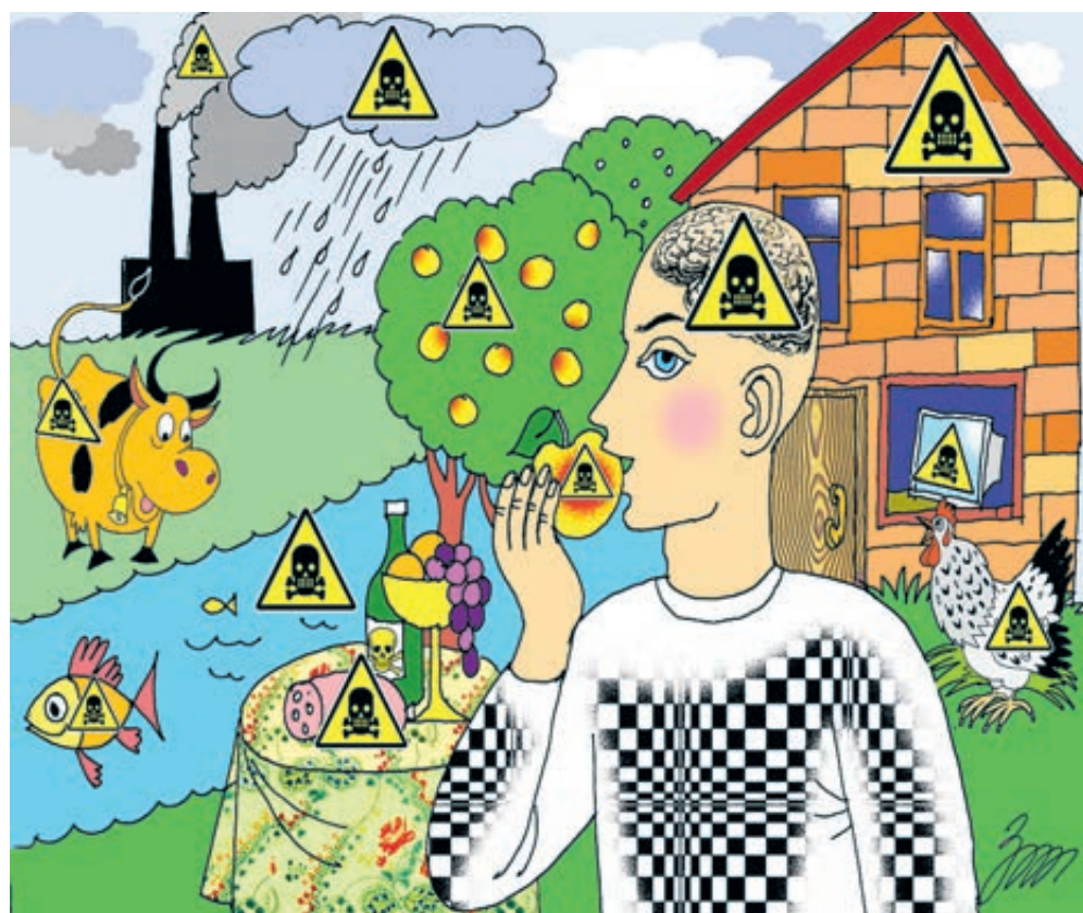
ИЛЛЮСТРАЦИЯ ТАТЬЯНЫ ЗЕЛЕНЧЕНО / САРТОВБАНК.RU