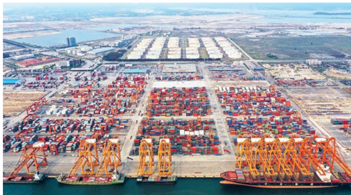
Контейнерная пристань в порту Циньчжоу Гуанси-Чжуанского автономного района на юге Китая. Аэроснимок был сделан 11 апреля 2019 года.

долларов США иностранных инвестиций привлек Китай за 8 месяцев 2019 года