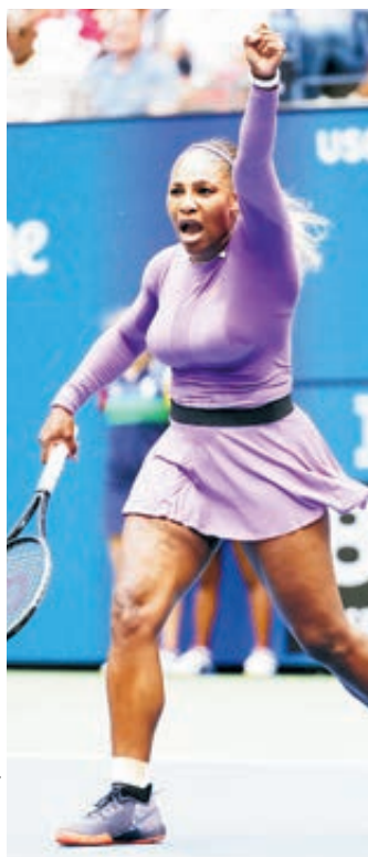
Симона Байлз, Джастин Гэтлин и Серена Уильямс. Кто скажет, что американские звезды спорта больны?

Впрочем, история легкой атлетики знает случаи и поабсурднее. Так, Международная ассоциация легкоатлетических федераций (ИААФ) на пике допинг-скандалов, связанных с россиянами, составила длинный список наших атлетов с запретом на их участие в международных турнирах. Туда попали и юноши 13–14 лет, и ветераны за 80, и даже несколько покойников! Похоже, клерки ИААФ тупо переписали всех граждан РФ, выступавших на международной арене в течение последних 20 лет.