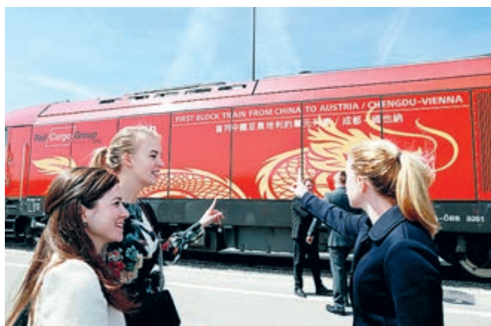
Товарный поезд, прибывший в Вену из Чэнду по железнодорожному мосту Китай – Европа.