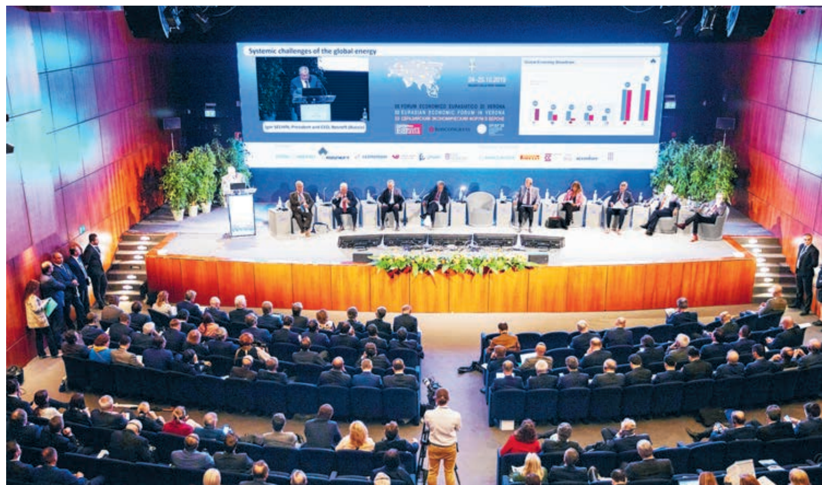
В форуме приняли участие представители деловых кругов, политические и общественные деятели, дипломаты и эксперты.

Учитывая тот факт, что в Европе действуют отрицательные ставки, единственный надежный рынок,