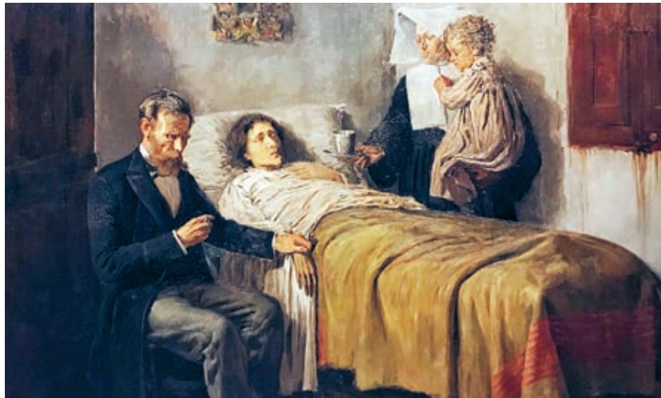
Пабло Пикассо. «Наука и милосердие», 1897 год.

ГУЗЕЛЬ АГИШЕВА РЕДАКТОР ОТДЕЛА «ОБЩЕСТВО»