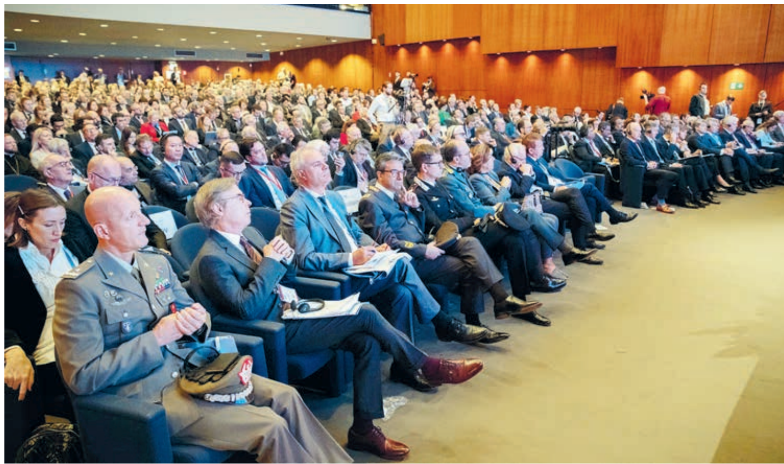
Участники форума высоко оценили предложение участвовать в новом проекте «Восток Ойл» на Таймыре.

Возобновляемая энергетика действительно субсидируется, поэтому она является нерыночным сектором, утверждает старший