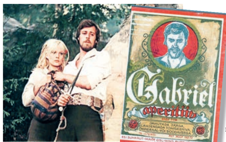
Герой фильма «Последняя реликвия» запечатлен на бутылке. Это ли не знак признательности?

После роли Габриэля его пригласили в Москву, где он служил в театрах Малом и Моссосовета. А в кино запомнились ролями Фомы Гордеева, Юрия Долгорукого, Григория Орлова, генсека Брежнева, маршала Рокоссовского (все, заметьте, герои незаурядные,