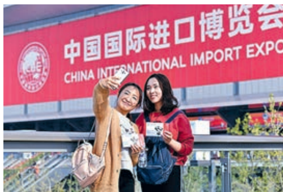
Посетители фотографируются на ЭКСПО в Шанхае в 2018 году.

ЭКСПО не только стимулирует импорт товаров и услуг, но и способствует увеличению иностранных инвестиций за счет торговли и рынка