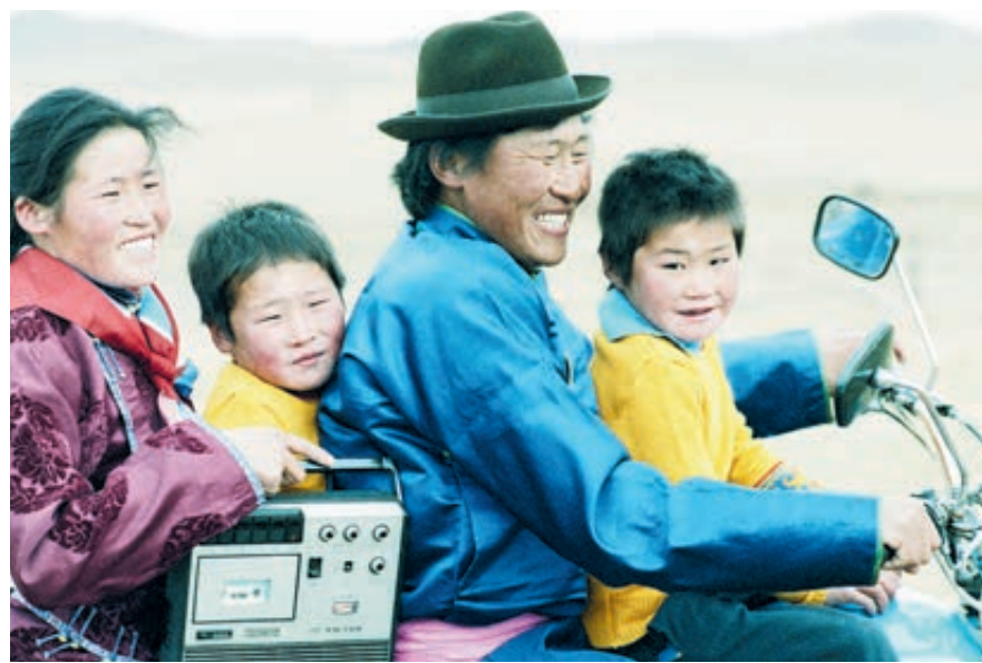
Монгольское семейство: с песней по жизни!

Начнем с того, что многие аудиофилы все еще считают, что у звука, записанного на кассету, тоже есть свои преимущества перед цифрой. Да, цифровая запись гораздо чище пленочной, она не имеет никаких искажений, но для профессионального уха при этом представляется неживой, рафинированной. А все потому, что в процессе «чистки» запись в подавляющем большинстве случаев лишается едва различимых обертонов и неуловимых нюансов, которые вместе с шумами и помехами присутствуют на пленке, делая запись живой – «настоящей».