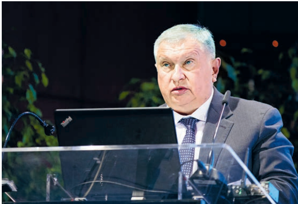
Главный исполнительный директор ПАО «НК «Роснефть» Игорь Сечин выступил с ключевым докладом на тему «Общая цена нестабильности» на XII Евразийском экономическом форуме в городе Вероне.

Главным драйвером роста потребления энергоресурсов, отметил Сечин, станут страны Азиатско-Тихоокеанского региона. По его словам, повышение уровня жизни и увеличение численности среднего класса будут способствовать распространению легкового автотранспорта. Это приведет к росту спроса на нефть в Азии на 20% или на 300 млн тонн к 2040 году. Более половины этого роста придется на Индию, значительно увеличится потребление в Китае, Индонезии и Вьетнаме. Глава «Роснефти» напомнил, что только за последние