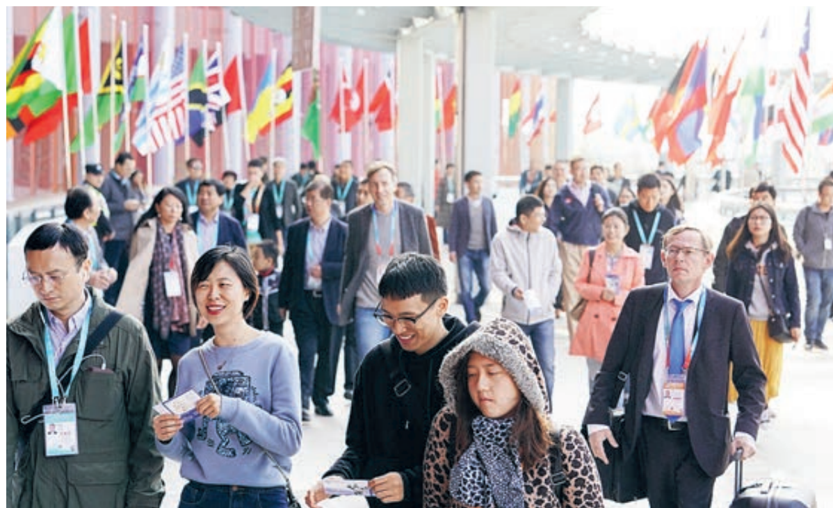
На Первом Китайском международном импортном ЭКСПО в Шанхае было очень многолюдно.

Новая политика Китая по расширению открытости в этом году дала большой стимул для