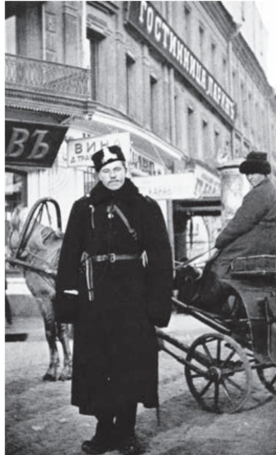
Начало XX века. Городовой и извозчик.