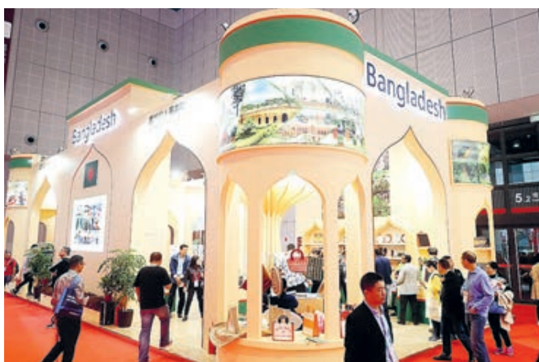
Выставочный стенд Бангладеш на Первом Китайском международном импортном ЭКСПО в Шанхае.

ЭКСПО не только стимулирует импорт товаров и услуг, но и способствует увеличению иностранных инвестиций за счет торговли и рынка