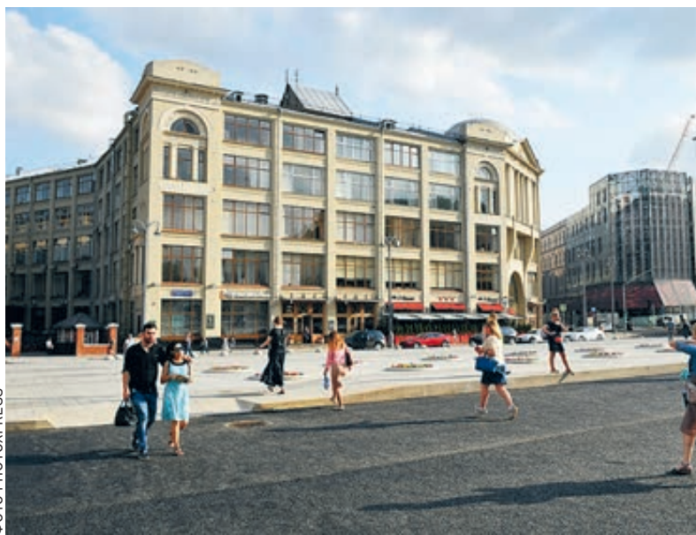
Славянская площадь в процессе реконструкции.

Серьезная реконструкция началась в этом году, когда площадь вошла в программу благоустройства «Моя улица». Главные изменения касаются пассажиров и пешеходов. Людям теперь будет