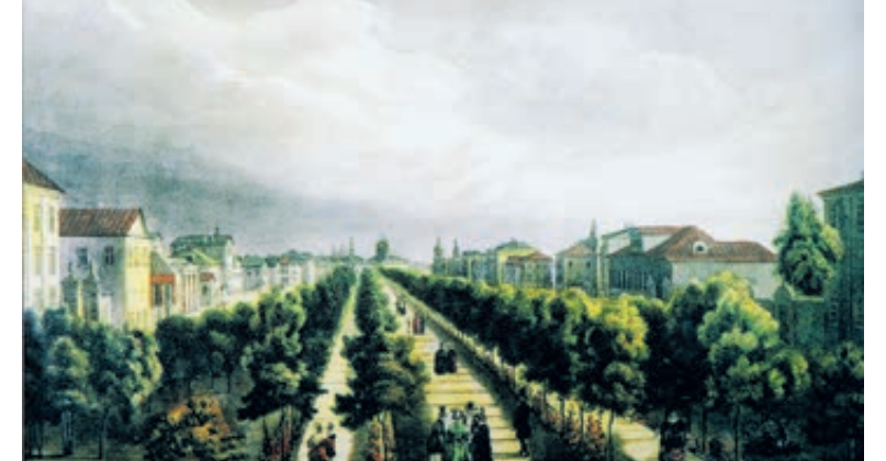
Огюст Кадоль. Тверской бульвар, 1825 год. Литография.