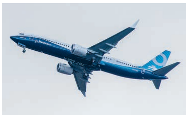
На Парижском авиасалоне представляют Boeing-737 MAX 10, который скоро прилетит в Китай.

с. 1 Я так подробно рассказываю о лидерах китайского авиационного транспорта, чтобы можно было представить различия. Вся группа компаний «Аэрофлот» (включая «Победу», «Россию», «Аврору» и другие ЗАО, ПАО и пр.) получила в прошлом году чистую прибыль 38,826 млрд рублей (чуть более полумиллиарда долларов). И это очень неплохо, поскольку годом ранее был убыток на 6,5 млрд рублей. Что касается воздушного флота отечественного лидера, то он состоит из 199 самолетов, средний возраст которых составляет 4,3 года. «Аэрофлот» по праву гордится тем, что с конца 2008 года воздушный парк пополнили 22 новых дальнемагистральных лайнера Airbus A330, а в период с февраля 2013 по июнь 2017 года – 16 лайнеров Boeing-777-300ER. Весь этот флот перевез в 2016 году около 43 млн пассажиров.