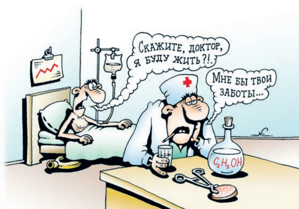
ИЛЛЮСТРАЦИЯ ИГОРЬ НИКИФОРОВ / CARTOONBANK.RU

Депрессия тем временем усугубляется. Помимо упаднического настроения яркими ее симпто-