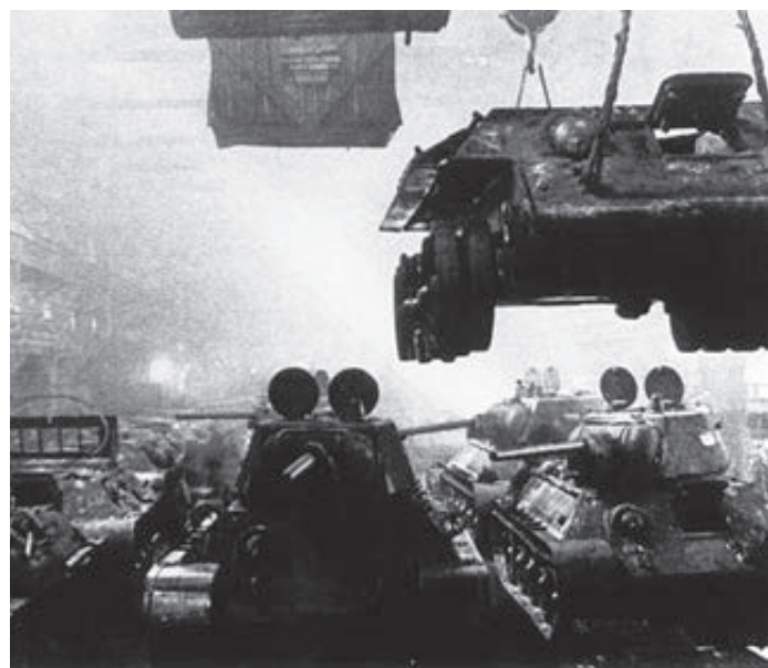
В войну уральские заводы показали пример ударного труда или, как бы сказали сейчас, импортозамещения.

с. 1 А еще мало-мальски сведущему в экономике человеку понятно: без серьезных заказов, типа крымского, без доходов и прибыли за их выполнение ни один завод любого профиля никогда не сможет модернизироваться, обновить оборудование и технологии, стать тем самым «пупером», который у нас все так любят видеть исключительно в импортной упаковке. К тому же мощные турбины для электро- и теплоэнергетики нынче нужны в самых разных концах страны на замену уже выработавшего ресурс оборудования. По данным Фонда энергетического развития, ныне только 26% котлов и 36% турбин российских ТЭЦ мо-