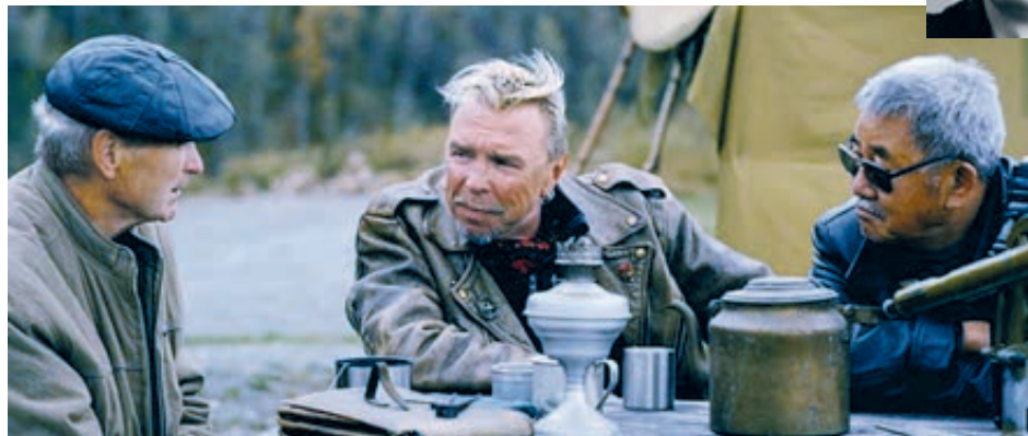
Кадр из фильма «То, что во мне».

Выборгский форум – значимое событие в культурной жизни, это один из самых масштабных и авторитетных смотров отечественного кино в нашей стране. В основных конкурсах фестиваля представлены все виды кинематографа: до-