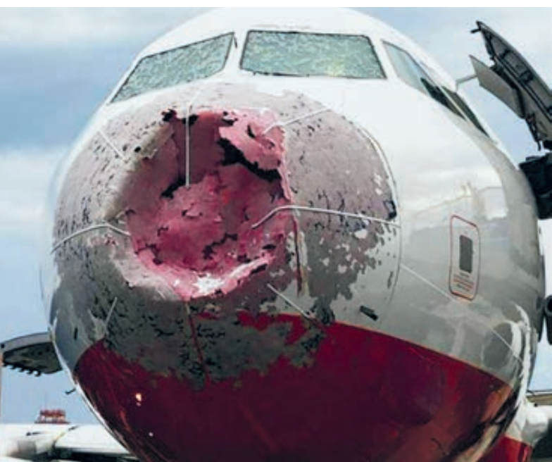
Вот так выглядел после встречи с грозой и градом Airbus-320 Atlas Global, чудом севший в аэропорту им. Атагюрка 27 июля.

Сиюю этого года, согласно приказу №99 Росгидромета, подведомственный ему «Авиаметеле-