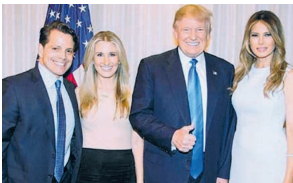
В веселой компании соратников Трампа Скарамуччи не засиделся.

Вот только в старорежимной Европе пока никак не разберутся, что за