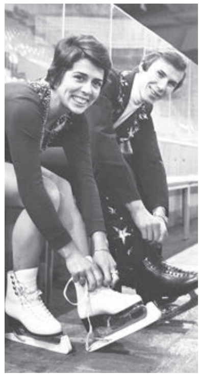
Ирина Роднина и Александр Зайцев перед выступлением, 1 июля 1974 года.

На лето нам организовывали летний лагерь от завода «Светлана». Ставили две армейские палат-