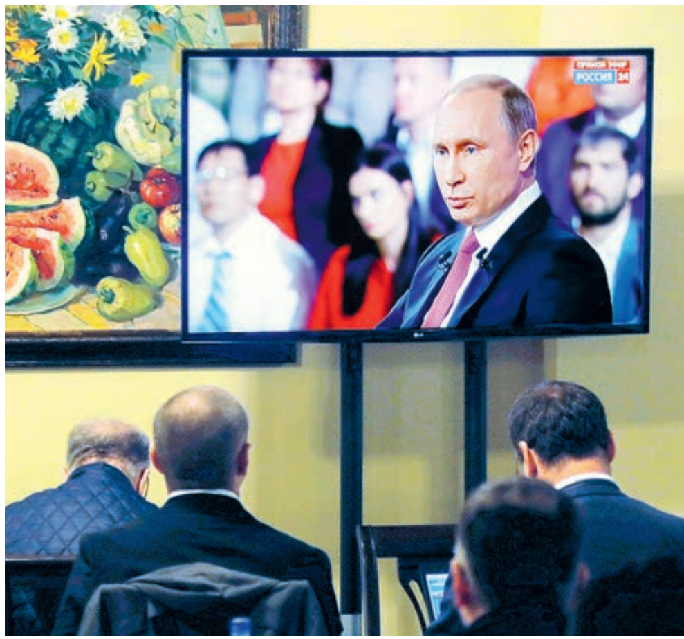
Общение с президентом — уже давняя традиция.