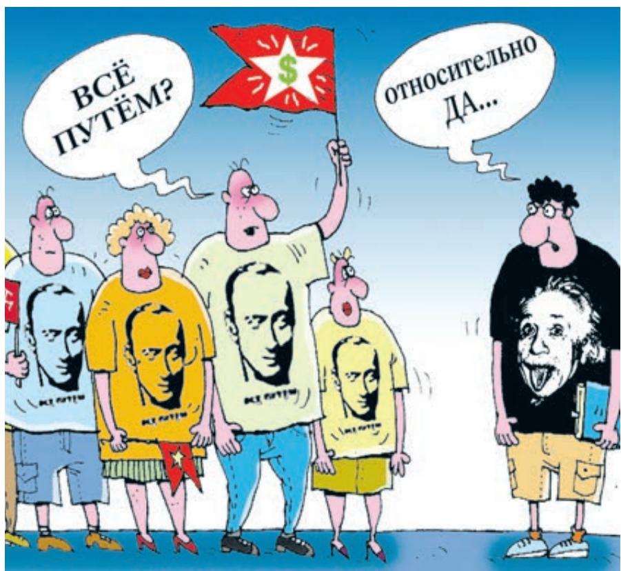
ИЛЛУСТРАЦИЯ СЕРГЕЯ КОКАРЕВА (SART/DOUBANK.RU)

А в целом вчерашний разговор принципиально мало чем отличался от 14 предыдущих. Люди и адреса другие, а проблемы все те же.