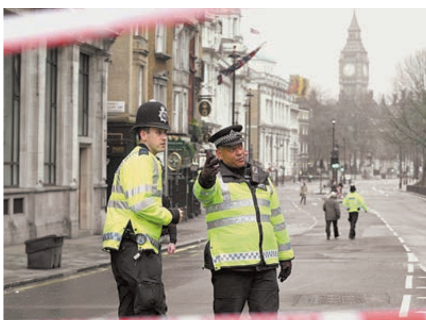
Полицейские Лондона ждут удара отовсюду.