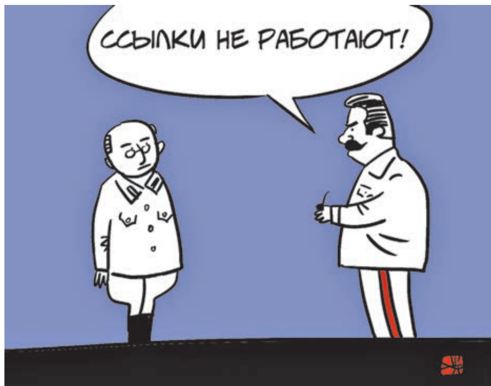
ИЛЛЮСТРАЦИЯ АЛЕКСЕЯ ИОРДЫ/САЙТОВАНК.РУ

Ранее «Труд» писал о том, что Росреестр фактически отменил право россиян на недвижимое имущество. Произошло это после перехода на электронные выписки из реестра недвижимости, который должен был состояться 1 января 2017 года. Должен был, но не случился. Из-за того, что фактически рухнула вся электронная система Росреестра,