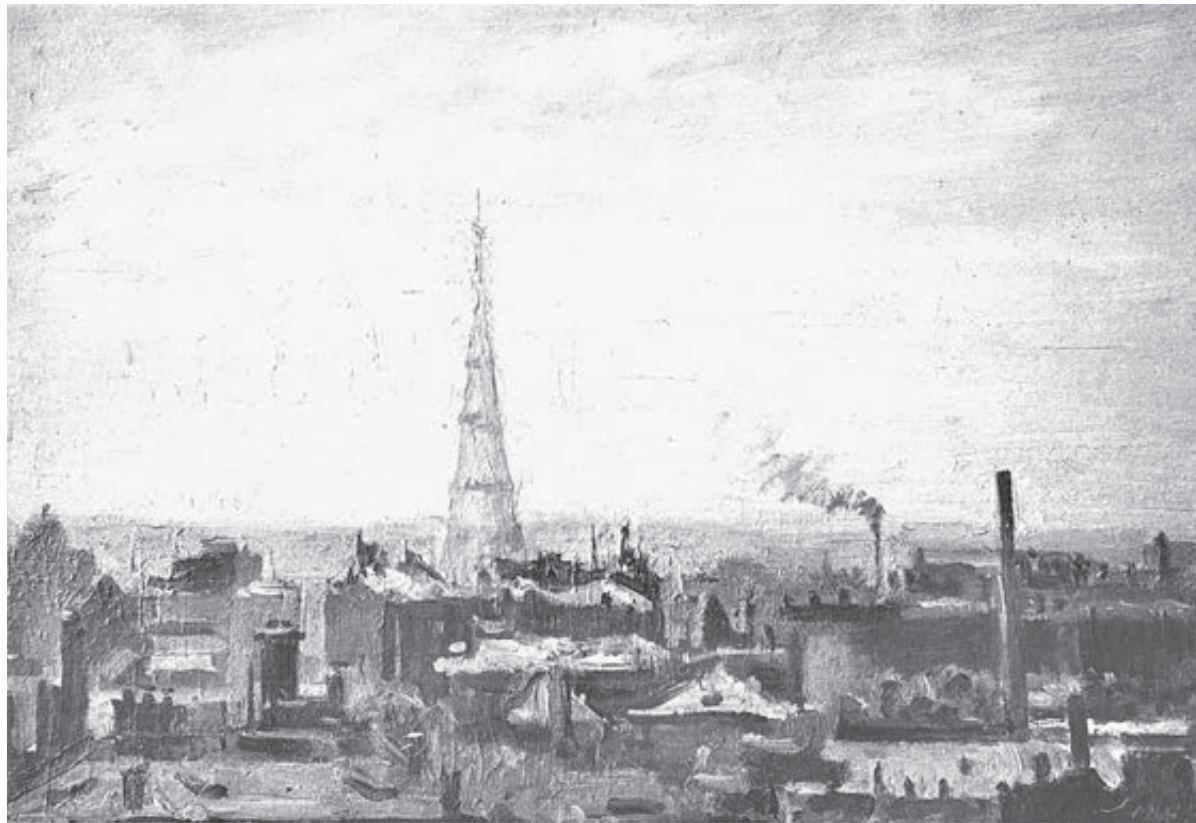
Башня в 1938 году.

второстепенных конструкций. Такие специалисты в России есть. Предварительные работы проведены шесть лет назад нашим институтом. В архивах сохранились уникальные документы, начиная с 1947 года, когда проводилось первое, очень тщательное обследование башни. Без проведения реставрационных работ у нее нет будущего, и начинать их нужно не откладывая.