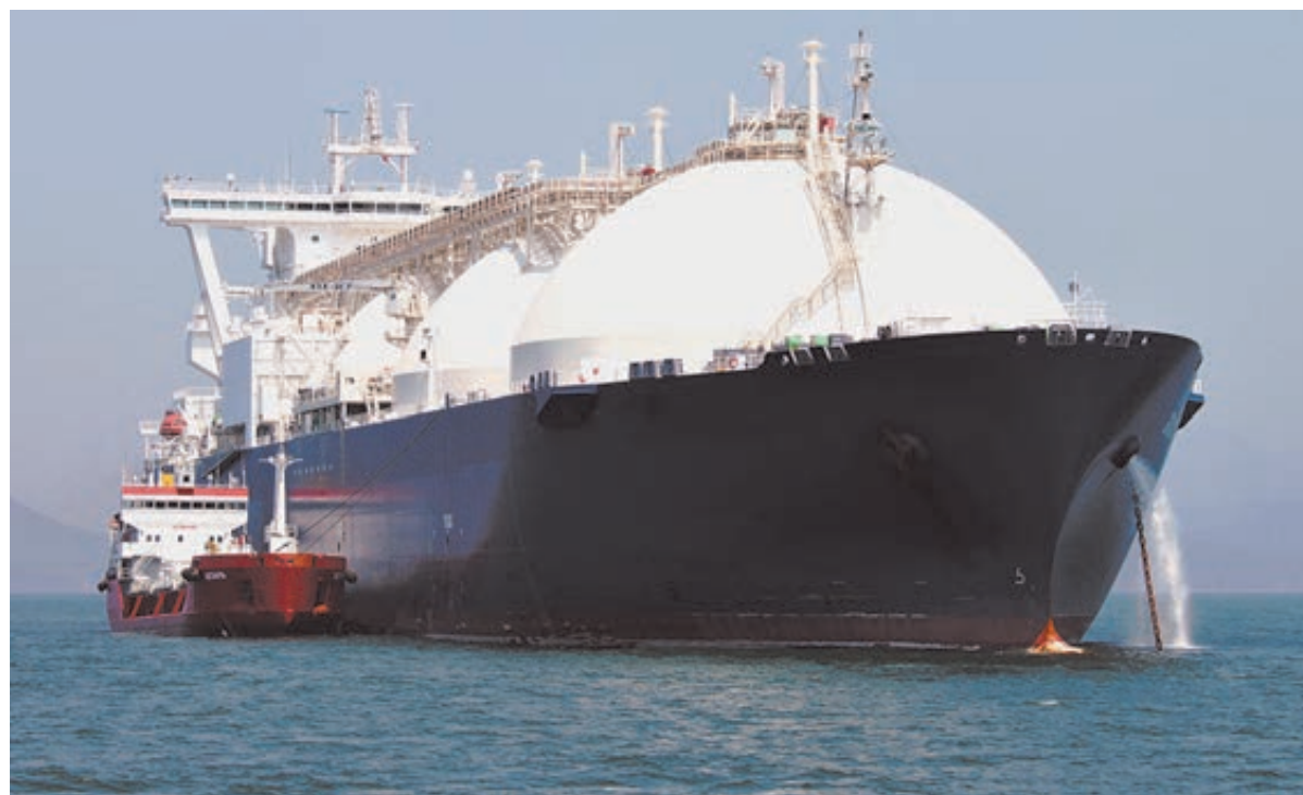
Такие танкеры транспортируют СПГ.