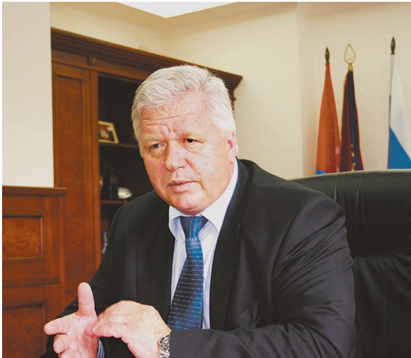
Председатель ФНПР Михаил Шмаков.

И наконец, там, где взаимный труд, – там не может быть профсоюзов. А далее простая цепочка: сведение к нулю защиты работников – угроза внутренней социальной стабильности – угроза стратегическим интересам России – и установление фактического экономического рабства. Поэтому пропаганда и продвижение взаимного труда в нашей стране – индикатор социальной безответственности, а если называть вещи своими именами, то почти государственная измена.