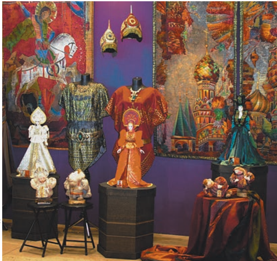
Экспозиция Елены Пелевиной на выставке в храме Христа Спасителя.