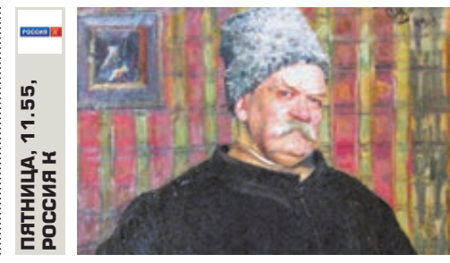
ПЯТНИЦА, 17.05, РОССИЯ К

Ток-шоу Как отличить фальшивый мед от настоящего? А почему врачи не рекомендуют пить чай с мёдом? И правда ли, что при нагревании мед становится ядовитым?