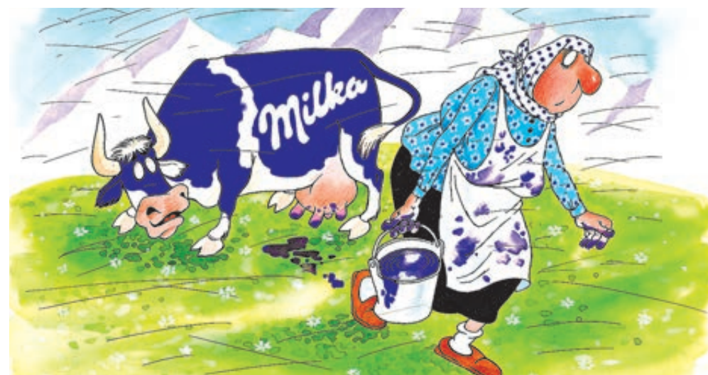
ИЛЛЮСТРАЦИЯ ВАЛЕНТИНА ДРУНИНИНА/CARTOONBANK.RU

По мнению экспертов Счетной палаты, объемы собственного произ-