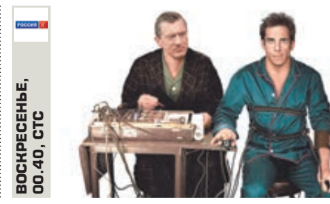
ВОСКРЕСЕНЬЕ, 00.40, СТС

Незабываемый праздничный концерт с грандиозным шоу Радио «Шансон» и все звезды шансона на одной сцене!