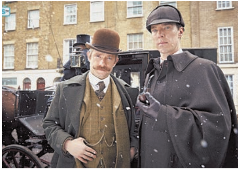
Кадр из сериала «Шерлок».

Правда, «Первый» уверяет, что его «Новогодняя ночь» будет особенной. А также предупреждает: «Подробности праздничного эфира держатся в строжайшем секрете, и лишь 31 де-